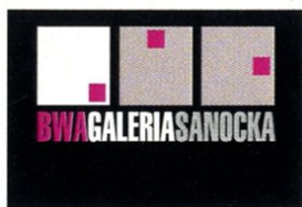
PLACÓWKA KULTURY MIASTA SANOKA