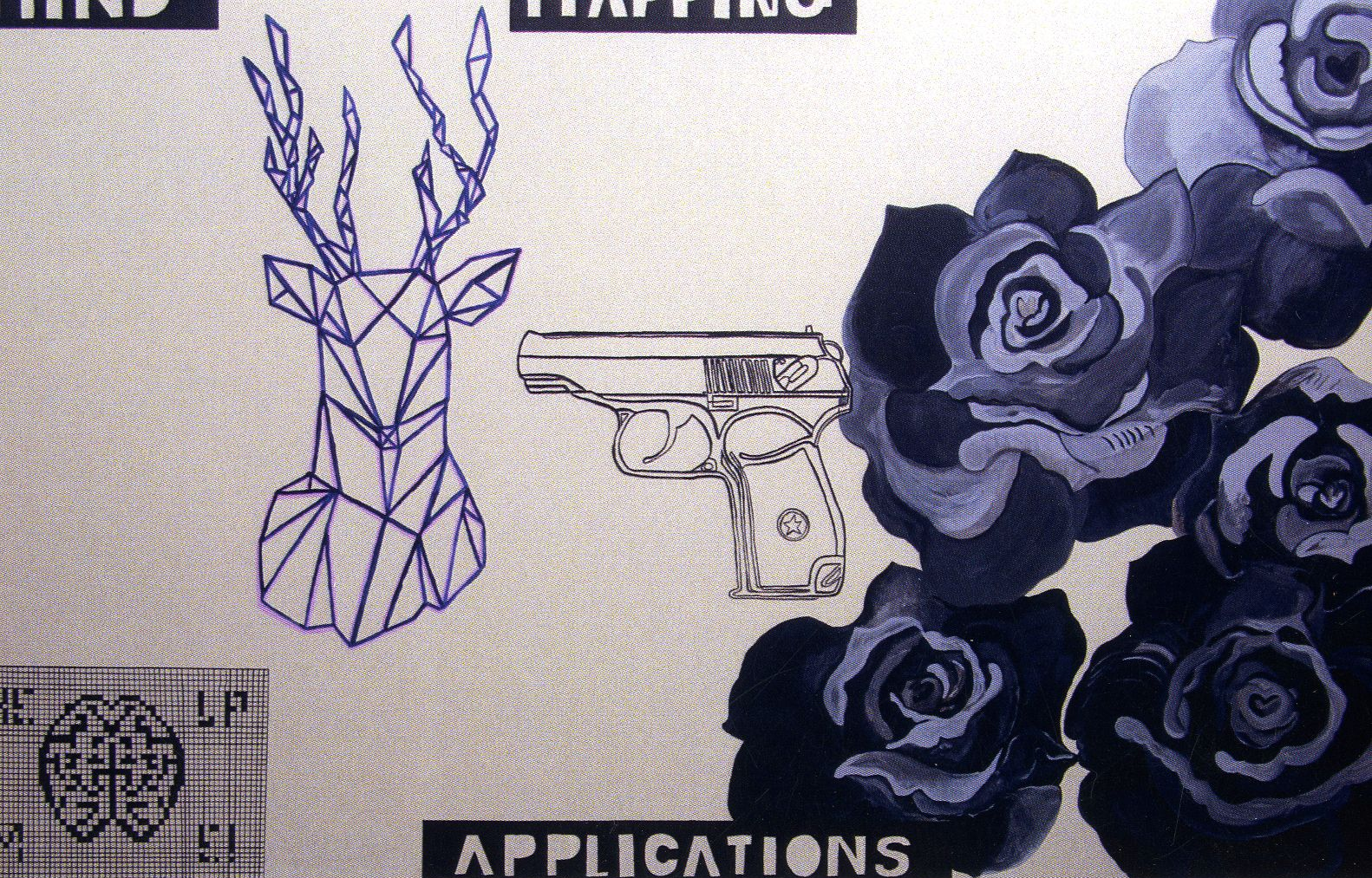
Maria Piątek Mind Mapping Applications / 140x220 cm / 2021