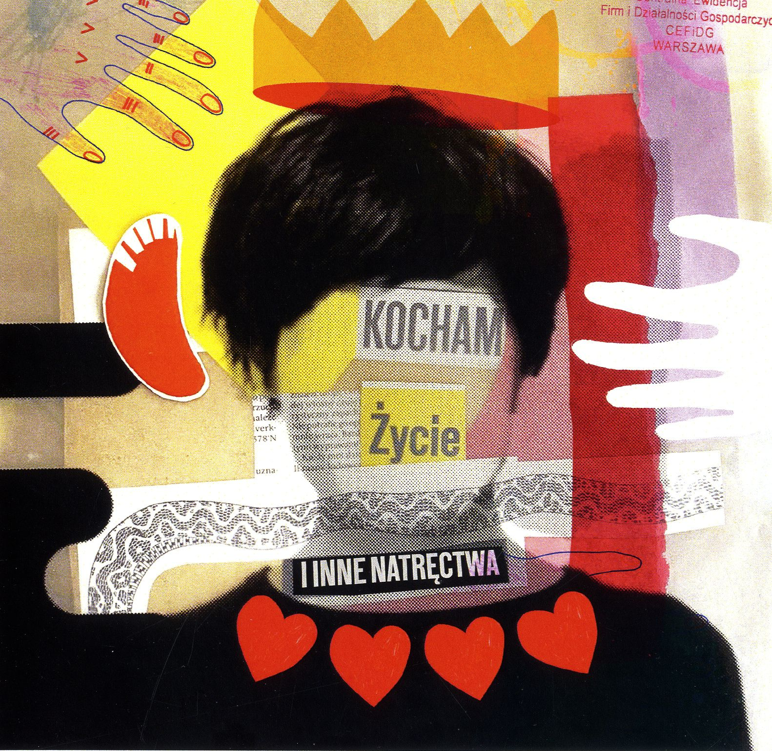
Sabina Twardowska Życie i inne natręctwa / 30x30 cm / kolaż / 2021