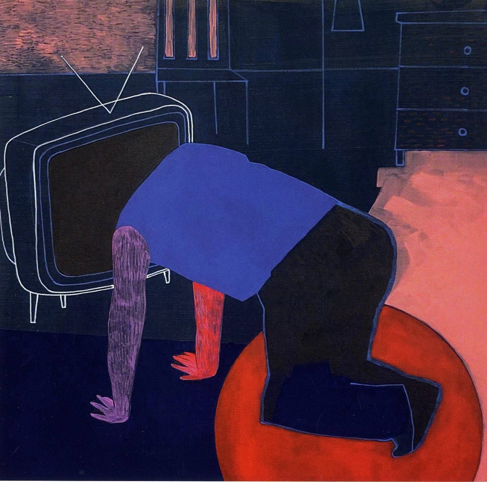
Sabina Twardowska Wiadomości / 60x60 cm / akryl na płótnie / 2021