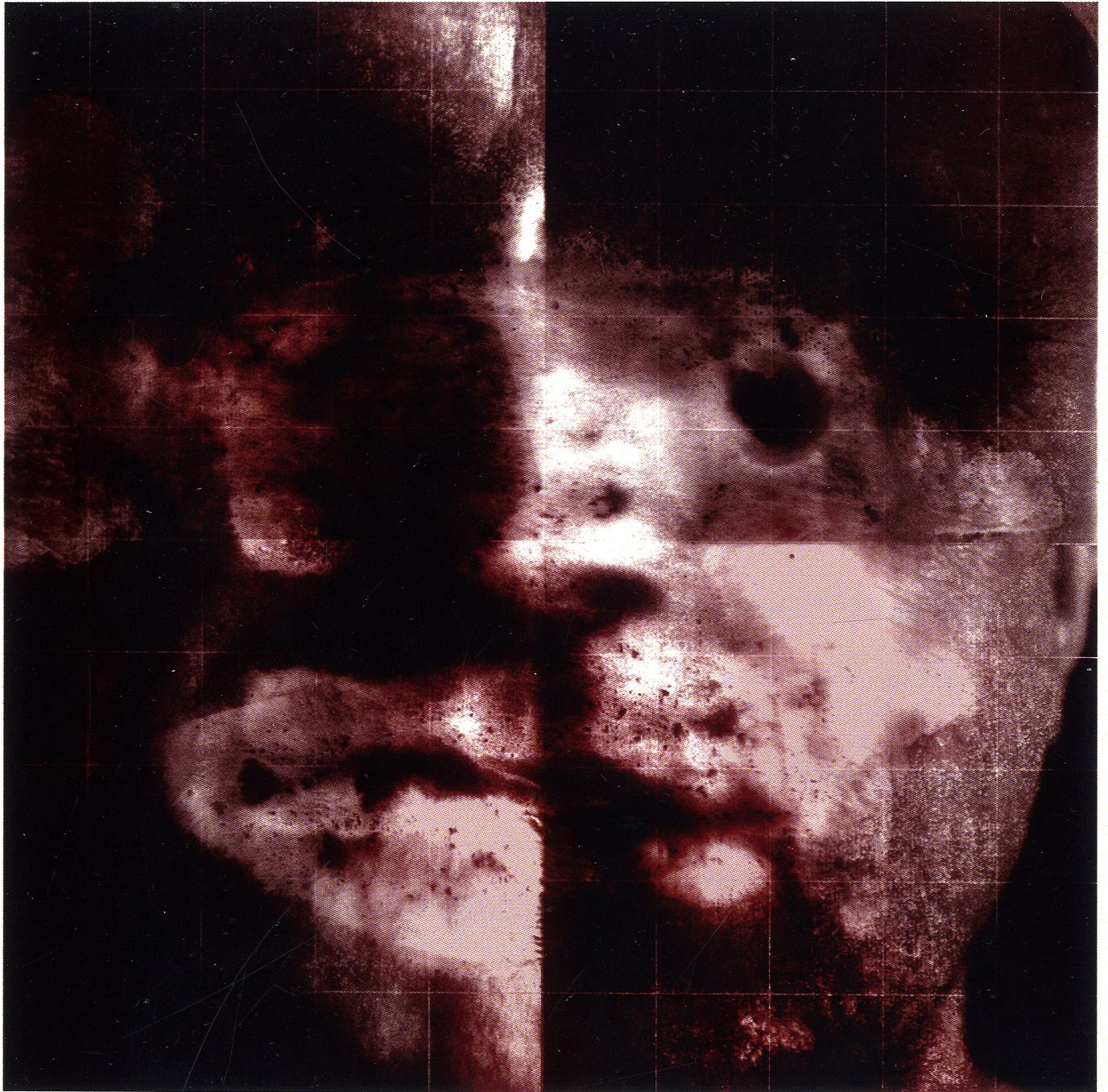
Quadro z cyklu Powłoki / technika mieszana na szkle / 60 x 60 cm / 2019