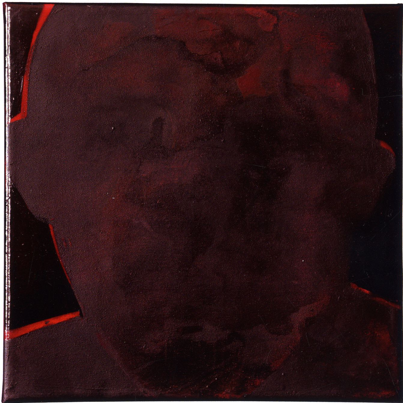
Cykl Destrukt / technika mieszana na płótnie / 40 x 40 cm / 2019