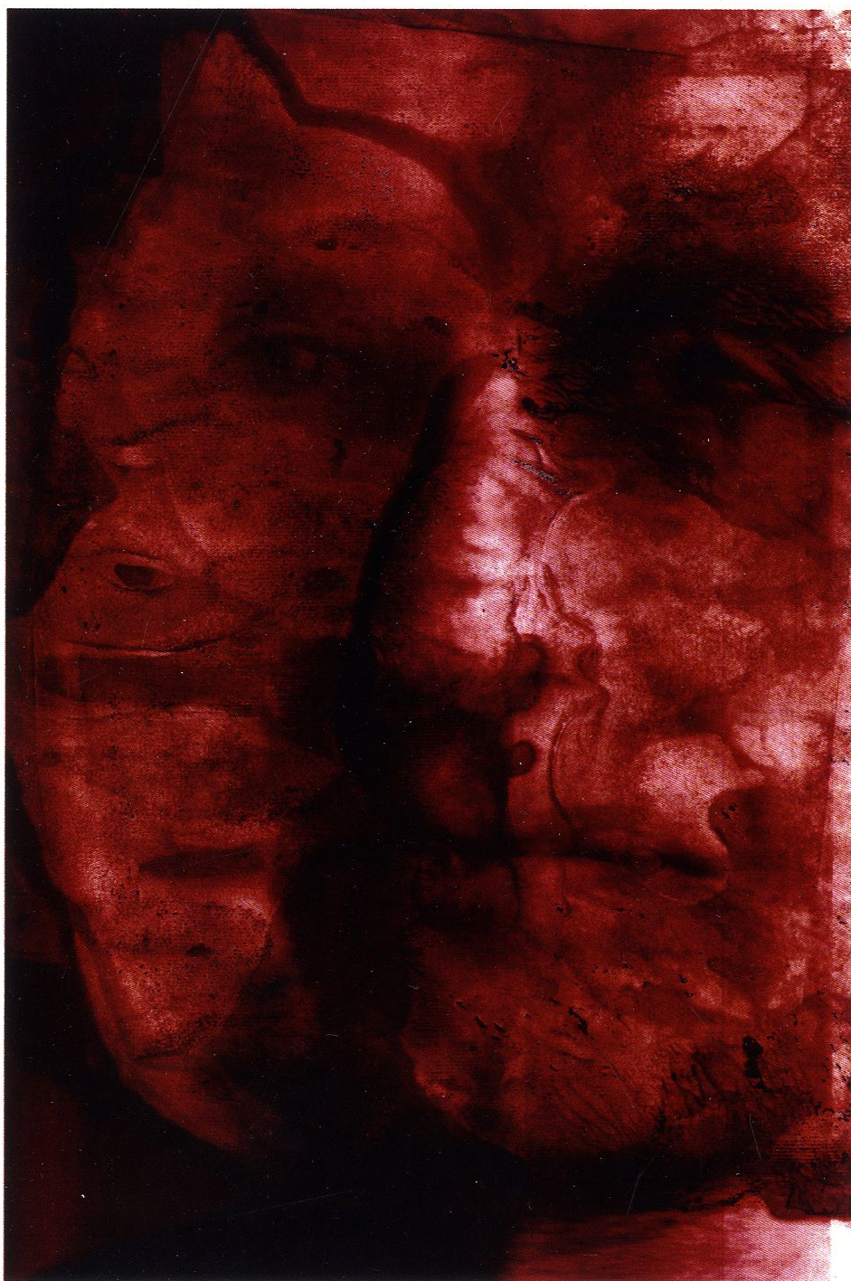
Cykl Powłoki / technika mieszana na szkle / 40 x 60 cm / 2019