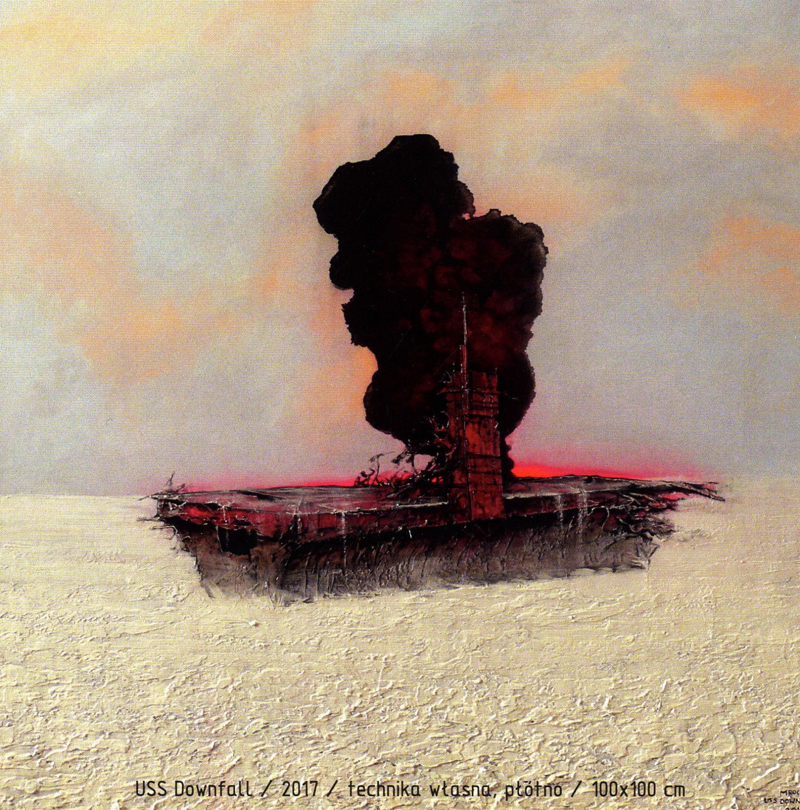
USS Downfall / 2017 / technika własna, płótno / 100x100 cm