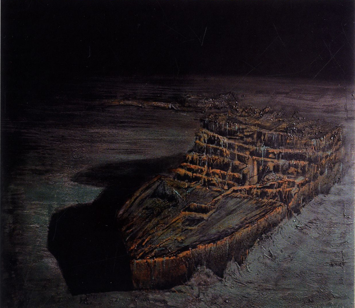
Titanic / 2020 / technika własna, płótno / 120x90 cm