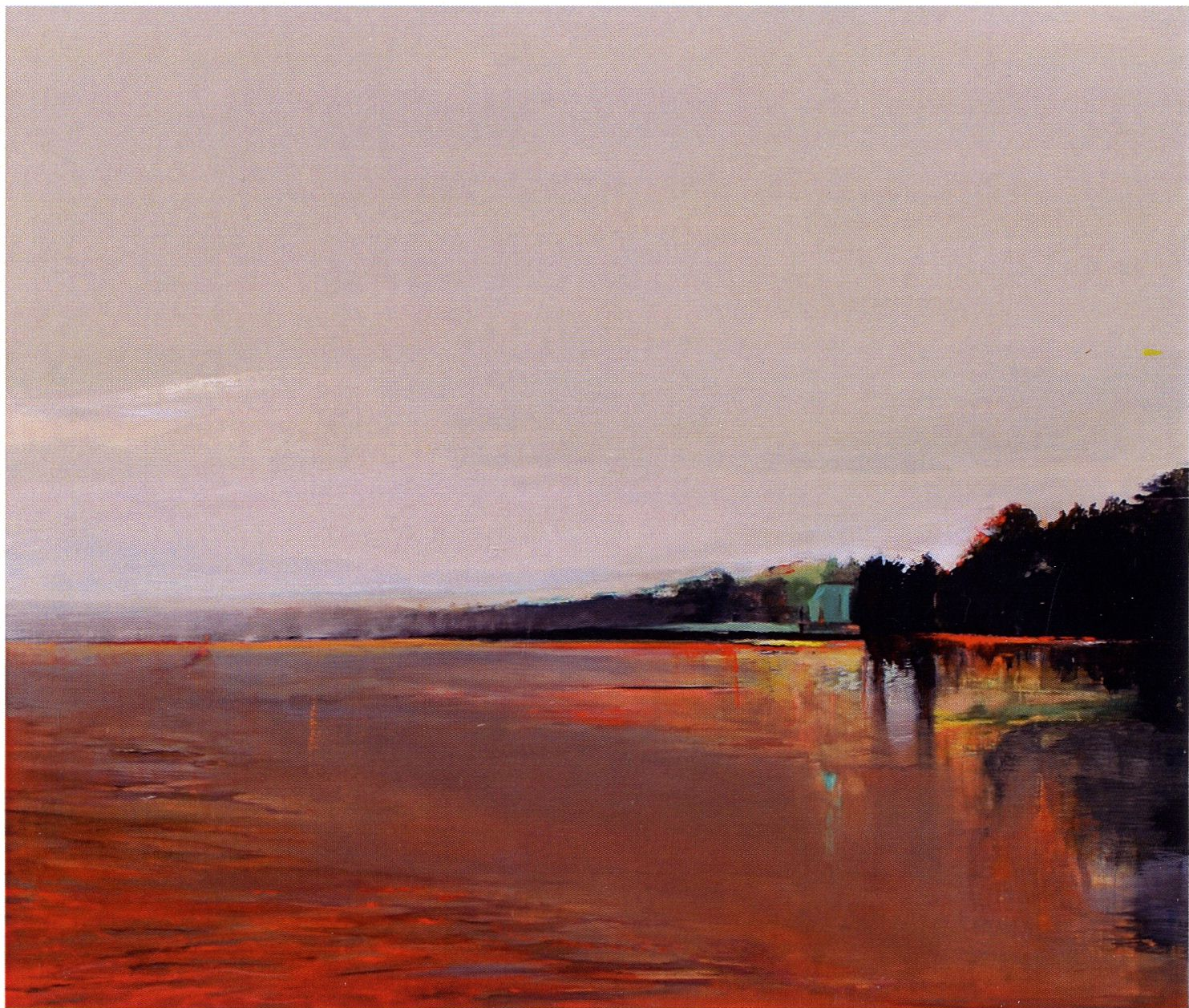
Zmierzch / 130x150cm / olej na płótnie / 2016 r.