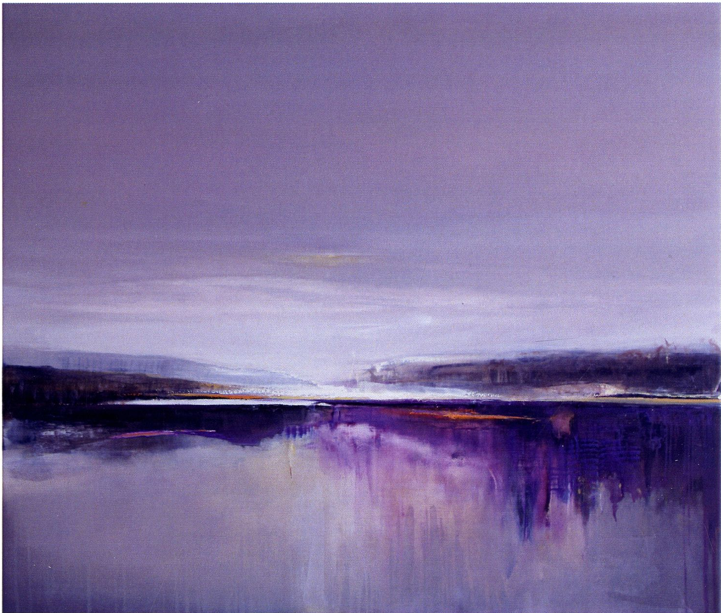
Październik / 110x130cm / olej na płótnie / 2016 r.