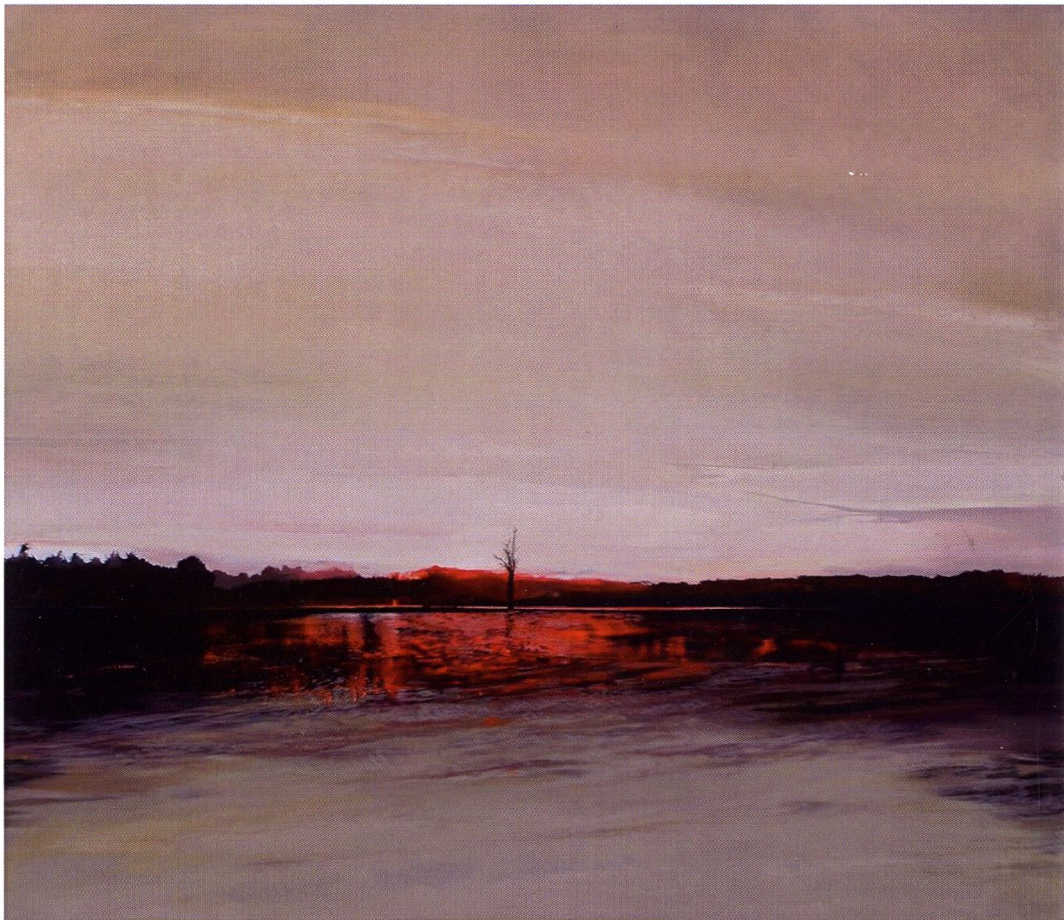
Suche drzewo / 130x150cm / olej na płótnie / 2016 r.