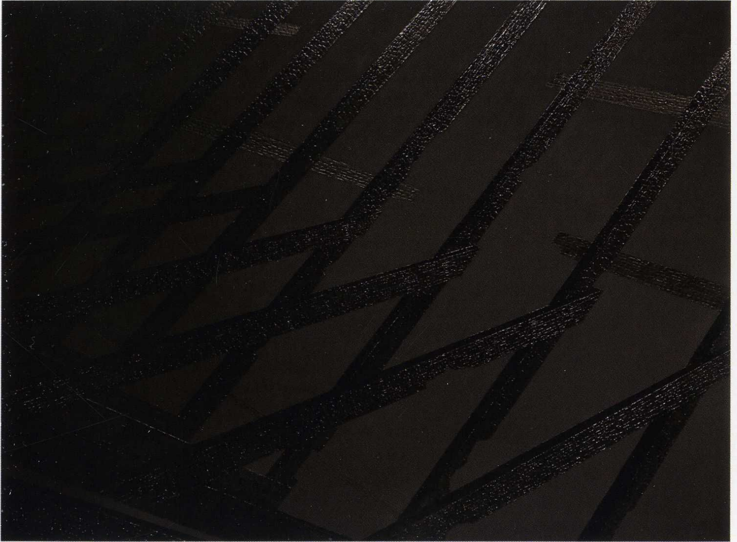
Jakub Cieżki / Blackout 4 / emalia akrylowa, akryl i olej na płótnie, 2013