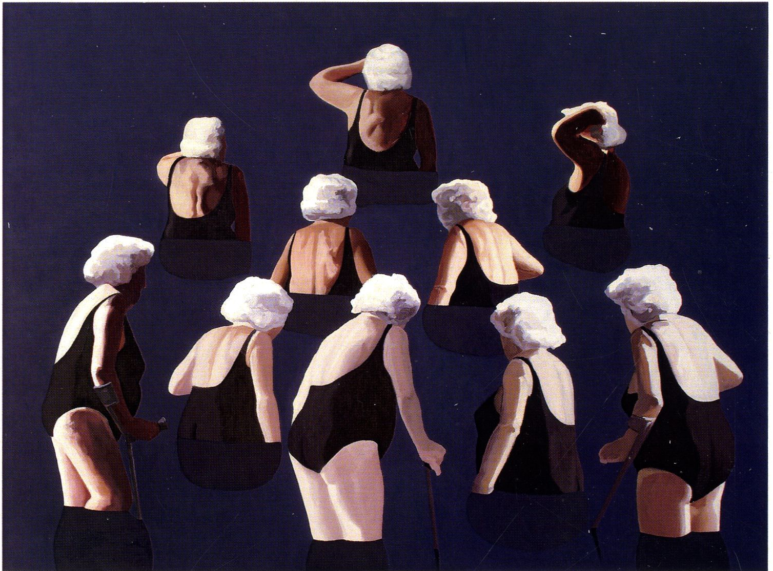
Odchodzenie / 150x200cm / olej na płótnie / 2011 r.