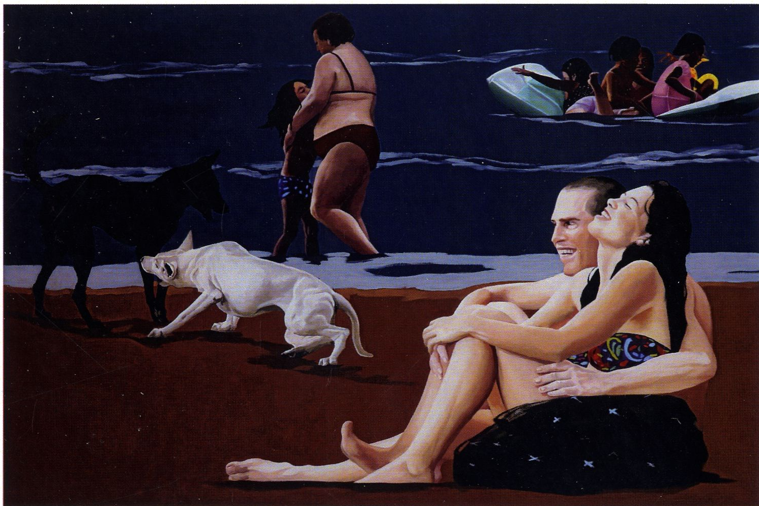
Victory II / 100x150cm / olej na płótnie / 2014 r.