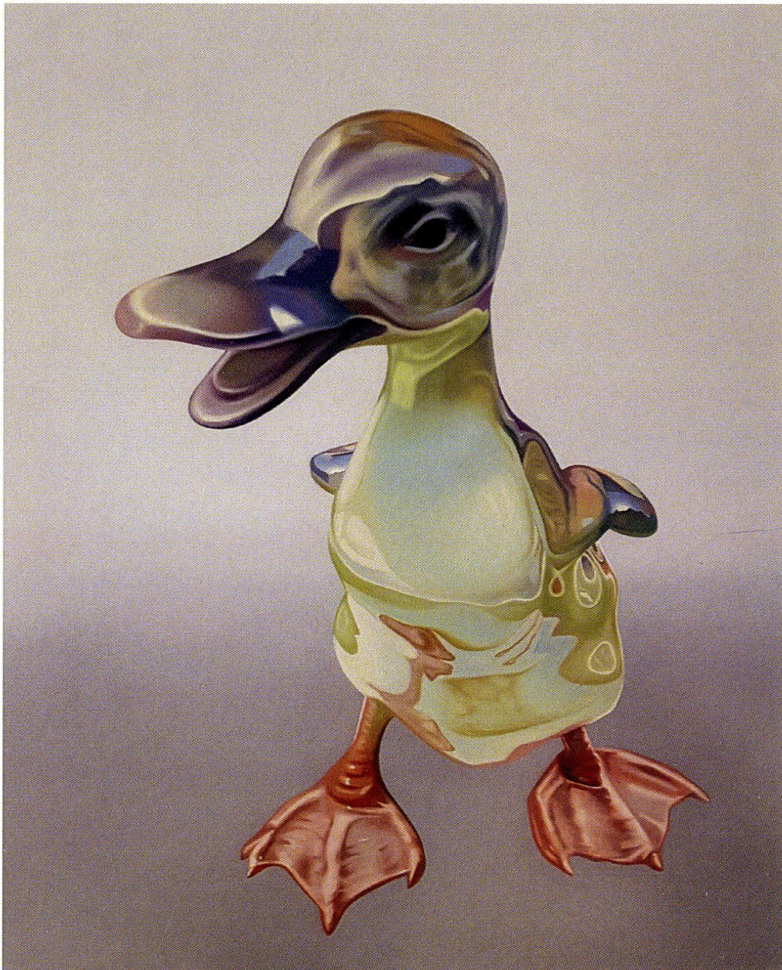
Bez tytułu 2 / z cyklu New Old Beauty / 2018