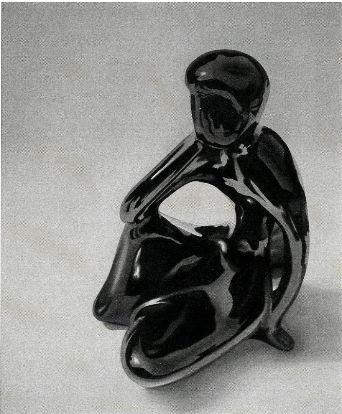
Bez tytułu 1 / z cyklu New Old Beauty / 2019