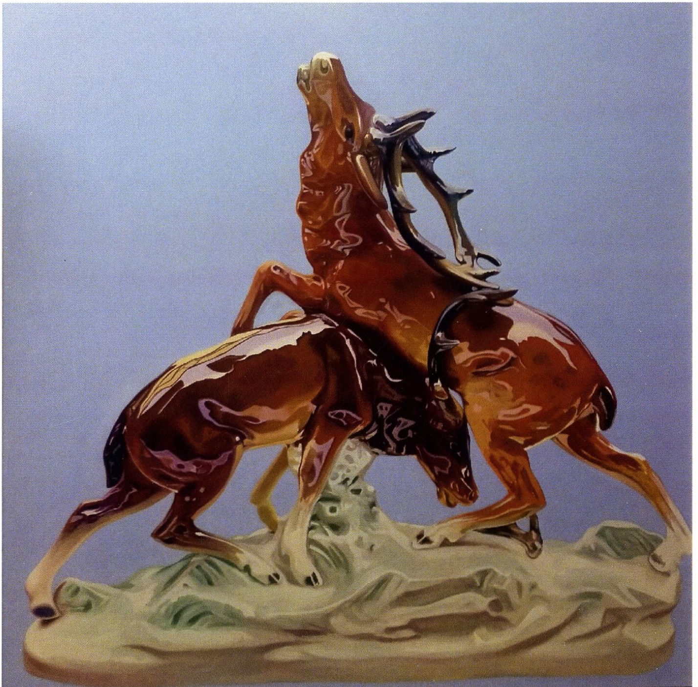
Bez tytułu / z cyklu New Old Beauty / 2018