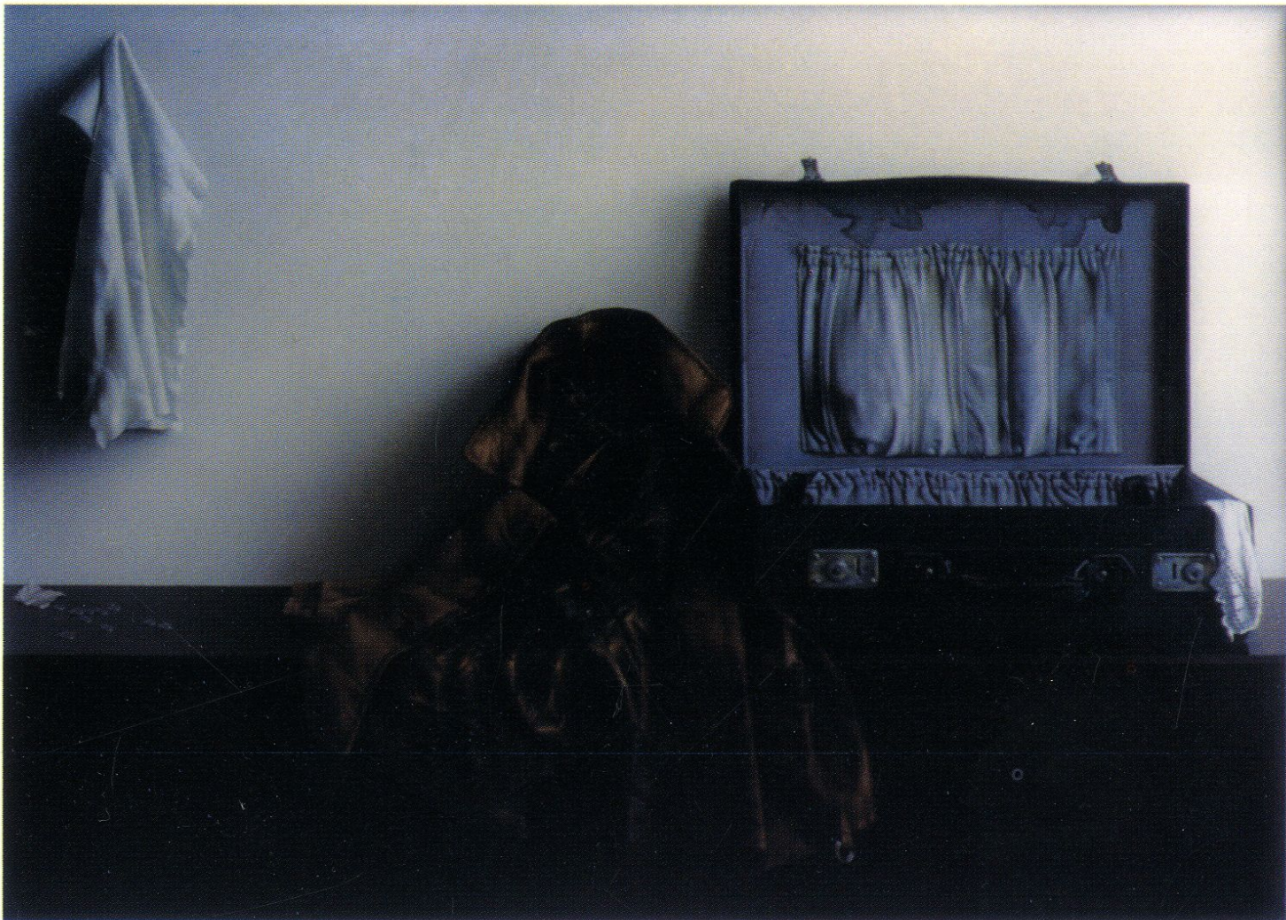
Suitcase / olej na płótnie / 116x160cm / 1980r.