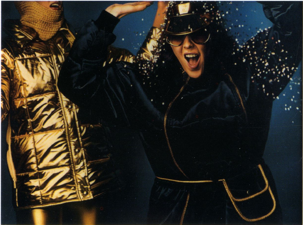
Jumpsuit from L'Officiel / olej na płótnie / 116x160cm / 1980r.

Ma w swoim dorobku wiele wystaw indywidualnych i zbiorowych.