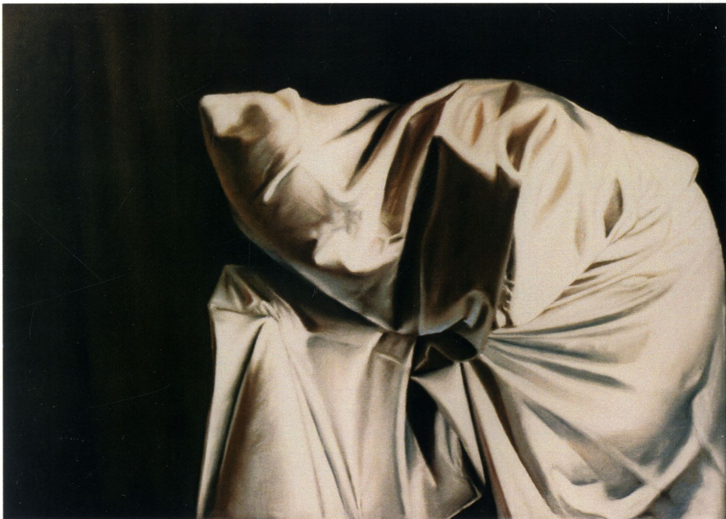
Homage / pastel / 70x100cm / 1988r.

Teatr życia IV / pastel / 140x100cm / 1989r. ►