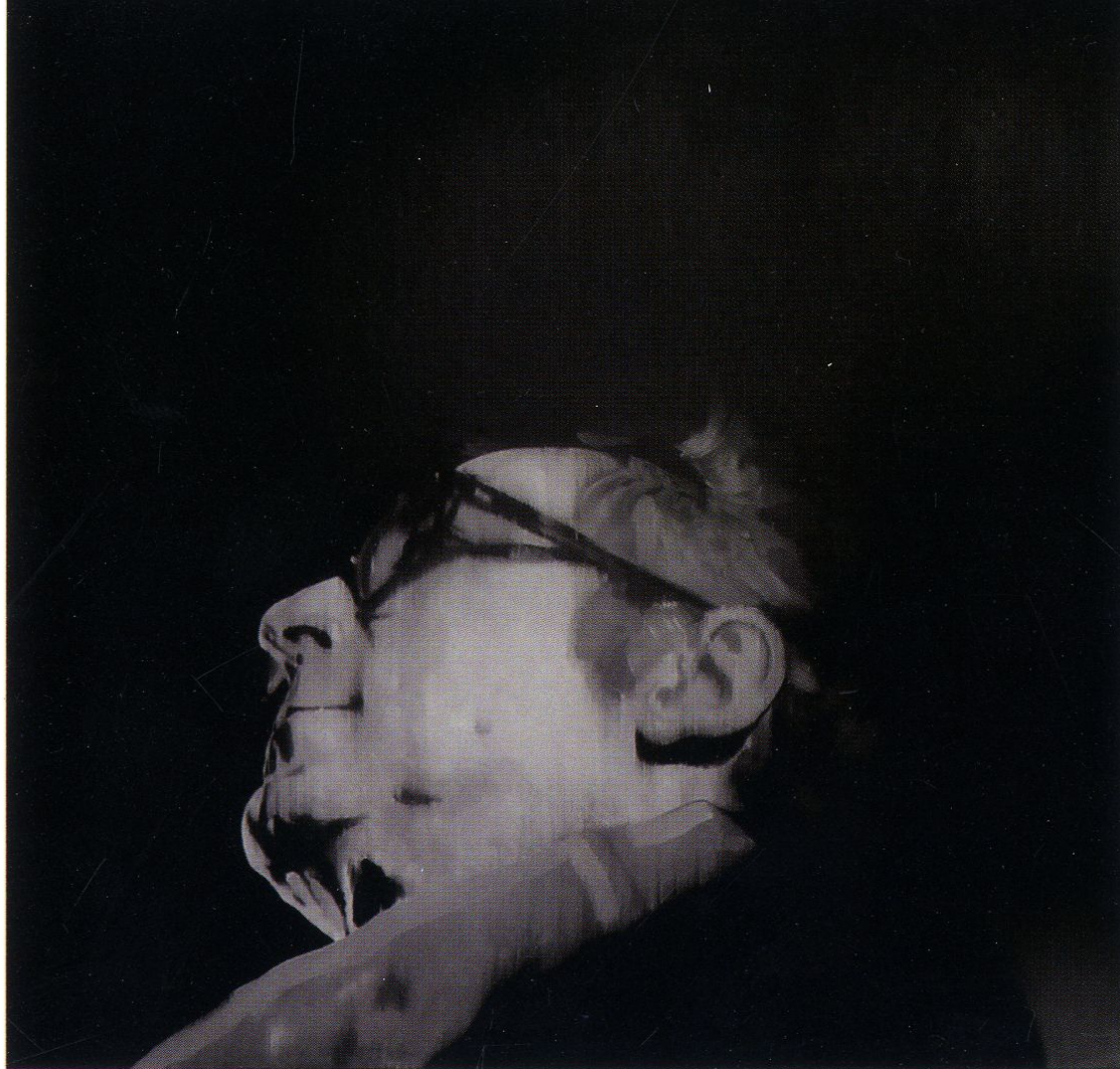
GODard z cyklu powersuit / 120x120cm / olej na płótnie / 2012r.

BWA GALERIA SANOCKA RYNEK 14, 38-500 SANOK TEL./FAX (013)4636030 e-mail: galeriasanocka@gmail.com www.bwa.sanok.pl