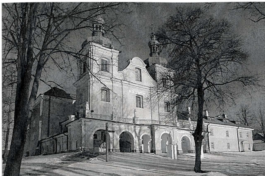
Kościół pw. Znalezienia Krzyża Świętego

odpust „pańskim”, bowiem ściągająca na niego szlachta głównie z ziemi przemyskiej, sanockiej i samborskiej. Ludzie obozowali w rozbijanych przez siebie namiotach. Odpust ten nie cieszył się jednak zbyt wielką frekwencją w przeciwieństwie do drugiego odpustu, który był obchodzony w dniach od 13 – 15 sierpnia i był związany z uroczystością Wniebowzięcia Najświętszej Maryi Panny. Ze względu na czas trwania, a szczególnie jego oprawę oraz udział wiernych, odpust ten po dzień dzisiejszy bywa nazywany „Wielkim”. Na temat przeżywania odpustów w pierwszych dwóch wiekach (XVII i XVIII), niewiele można powiedzieć. Program tego odpustu znany jest dopiero od końca XIX wieku.