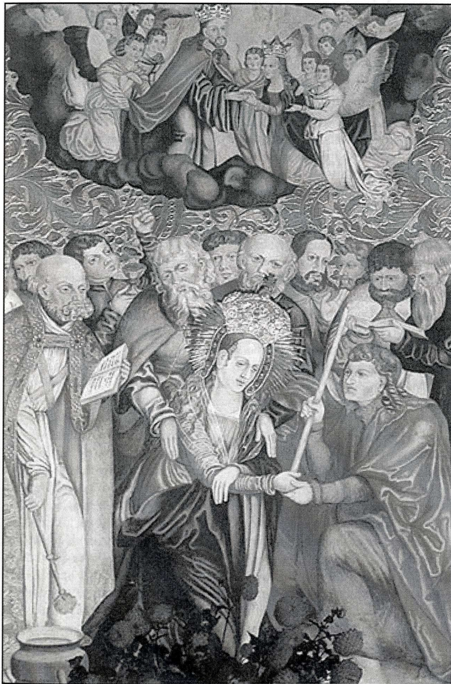
Cudowny obraz Matki Bożej Miłosierdzia