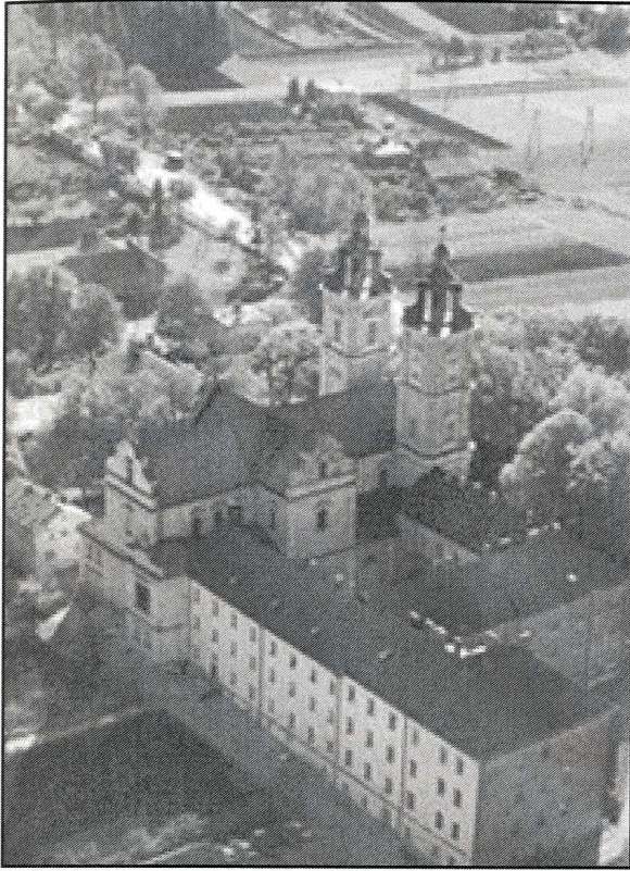
Klasztor o.o. Jezuitów w Starej Wsi