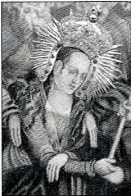
Starowiejska Matka Miłosierdzia