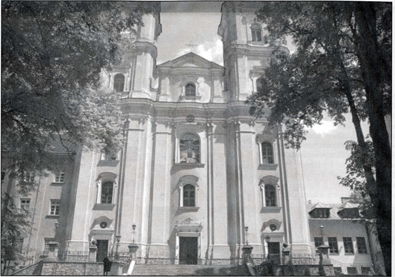
Bazylika Wniebowzięcia Najświętszej Maryi Panny