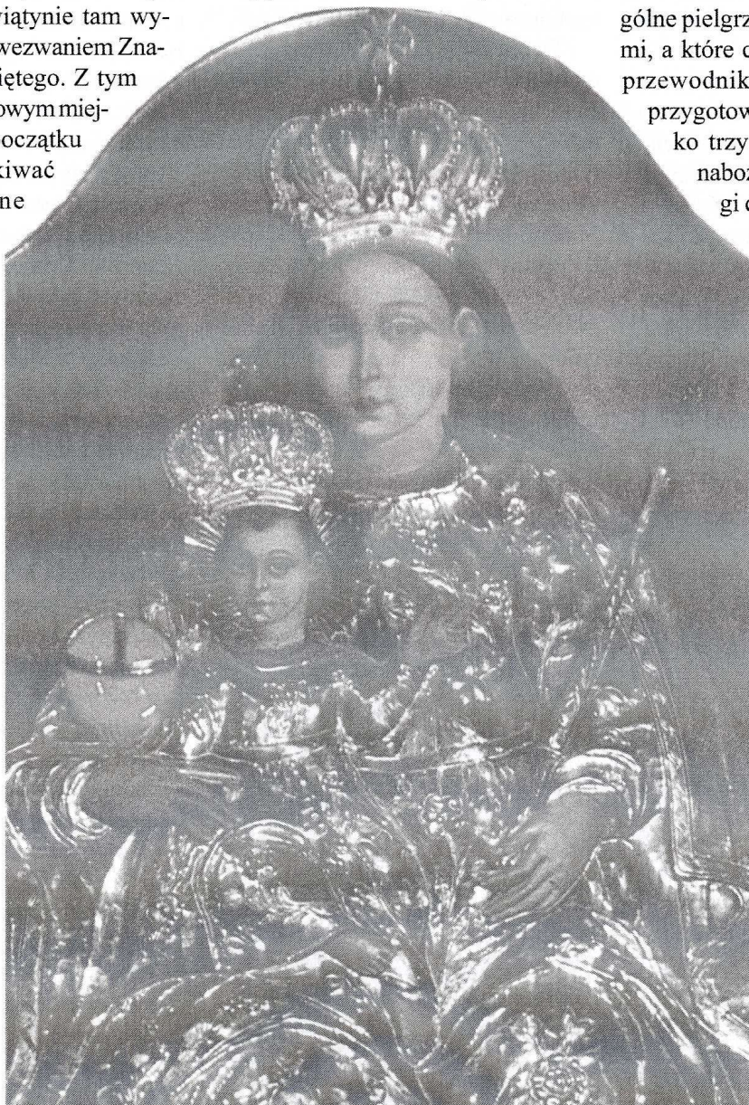
Matka Boża Kalwaryjska