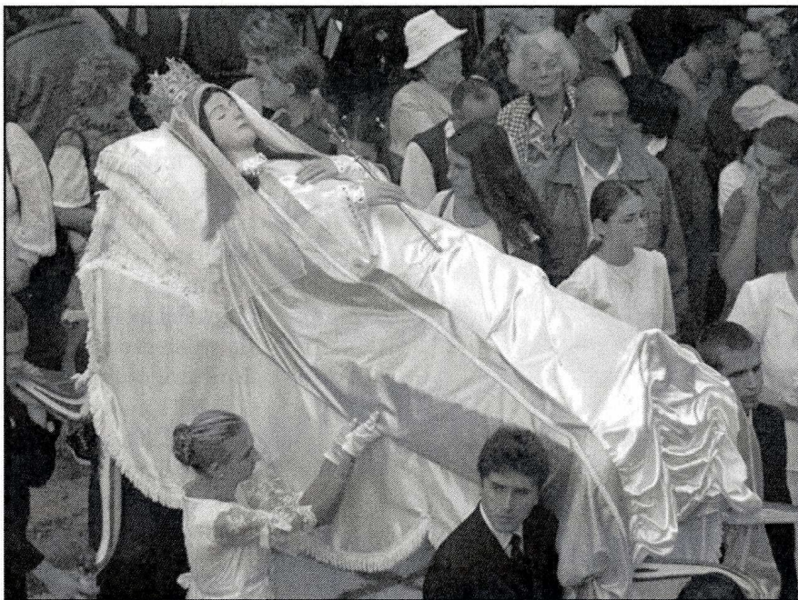
Dróżki odpustowe - figura Matki Bożej Zaśniętej

Na kalwaryjskie odpusty ściągały rzesze wiernych, choć z frekwencją różnie bywało. Zależało to od warunków historycznych, jak choćby zmiana granic po II wojnie światowej, czy nawet odpowiedniej informacji. Początkowo obchodzono dwa odpusty związane z kultem Matki Bożej. Pierwszy obchodzono 2 sierpnia, w dzień Matki Bożej Anielskiej. Nazywano ten