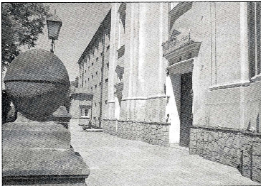
Wokół Kościoła Wniebowzięcia N.M.P.

W czasie okupacji, na tajnych kompletach, młodzi ludzie w zakresie szkoły średniej pod kierunkiem wytrawnych nauczycieli zdobywali wiedzę. Wspomagano także więźniów obozów koncentracyjnych przez wysyłanie im paczek żywnościowych, opiekowano się wysiedloną ludnością, na willi starowiejskiej kontynuowano studia teologiczne. To tylko niektóre, najważniejsze wydarzenia warte przypomnienia. Opisywanie szczegółowych dokonań przekracza ramy tego artykułu i moje aktualne możliwości.