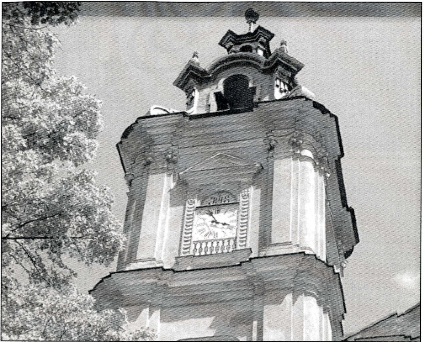
Jedna z wież Bazyliki