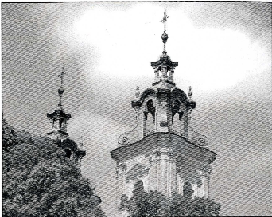
Miedziane chełmy na wieżach Bazyliki

Obraz ten jest podwójny. W dolnej swojej części ukazuje Zaśnięcie Matki Bożej, a w górnej części przyjęcie Jej do chwały niebios – Wniebowzięcie. Maryja znajduje się w postawie klęczącej, w samym centrum obrazu, otoczona gronem dwunastu Apostołów. Ręce ma skrzyżowane i opuszczone. Najbliżej Niej, najbardziej wyraziste postacie to klęczący św. Jan Apostoł wręczający Jej gromnicę oraz św. Piotr z otwartym tekstem biblijnym. Wygląda on najbardziej dostojnie, ubrany w bogate szaty, jak przystało na księcia Apostołów, głowę Kościoła. Jego wyjątkową rolę podkreślają odpowiednio dobrane kolory. Postacie Apostołów są mocno przysadziste, o szerokich twarzach zmęczonych pracowitym życiem. Twarze ich zamysłone, zdają się kontemplować to co się dzieje. Druga część obrazu przedstawia Maryję w chwale niebios. Niektórzy określają to jako Przyjęcie NMP w niebie. Prościej jednak będzie, gdy będziemy mówić o Wniebowzięciu Najświętszej Maryi Panny. Chrystus wydaje się, że zstępuje, aby przy-