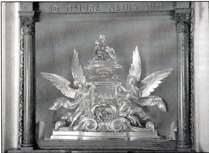
Relikwiarz Św. Stanisława Kostki

6 M. Goetel-Kopffowa, Obraz Zaśnięcia NMP w Starej Wsi, tamże, s. 148.