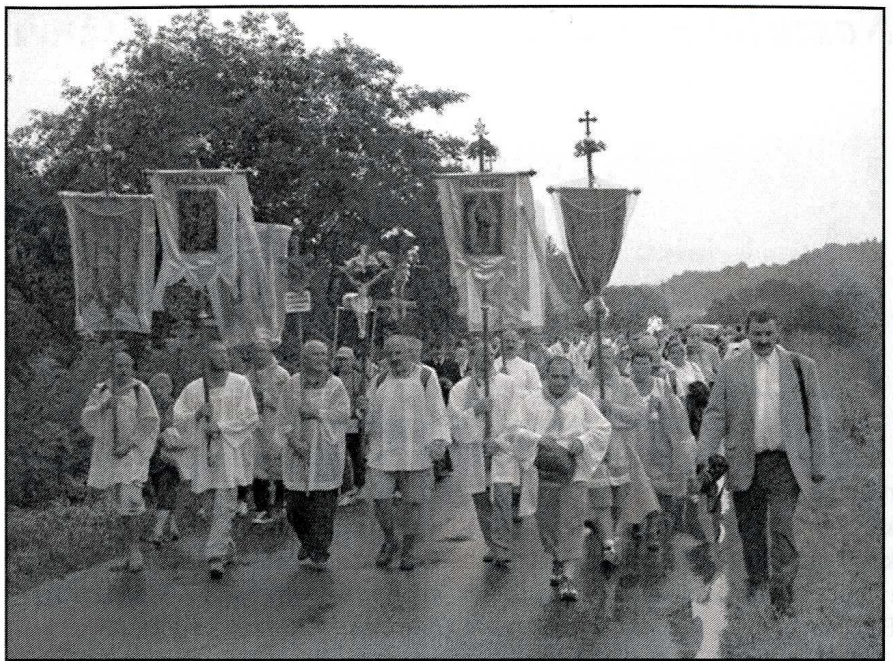
Dróżki odpustowe - kompanie pielgrzymkowe