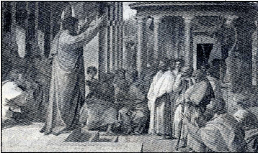
Św. Paweł naucza w Atenach

Wam, Drodzy Parafianie, którzy przyjmowaliście nas z otwartym sercem, szczerze dziękujemy. Przychodziliśmy bowiem z modlitwą i błogosławieństwem Bożym. Zdarzały się sporadyczne przypadki, że mieszkańcy domu wyraźnie nie życzyli sobie naszych odwiedzin. Dziękujemy również za ofiary składane z tej okazji w kościele. Niech wszystkim Pan Bóg błogosławi i ma w swojej opiece.