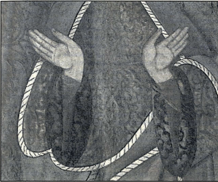
Ręce Matki Bożej – fragment obrazu