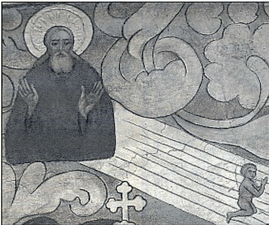
Wizerunek Boga Ojca wysyłającego do Maryi Dzieciątka po drodze z promieni – fragment obrazu