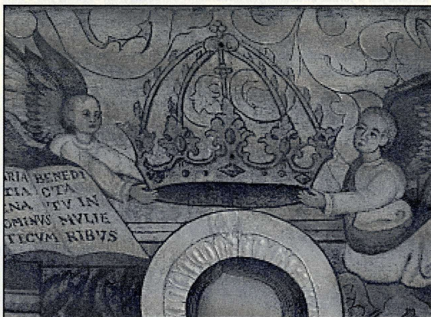
Korona Maryi podtrzymywana przez anioły – fragment obrazu

Od 1965 roku obchodzona jest nowenna przed świętem Niepokalane-go Poczęcia Najświętszej Marii Panny, w maju ze wzgórze rozbrzmie-