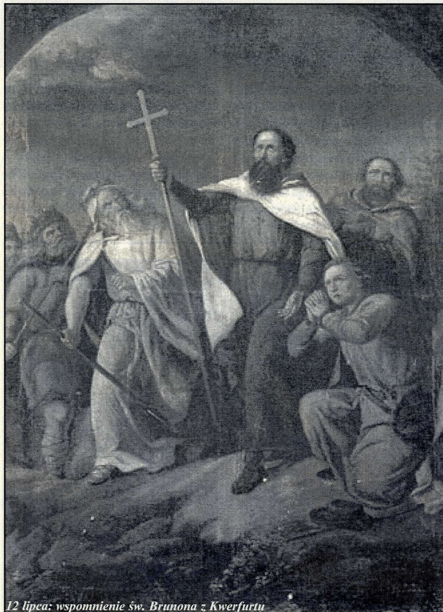
12 lipca: wspomnienie św. Brunona z Kwerfurtu