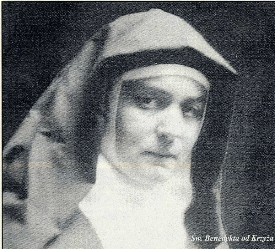
Św. Benedykta od Krzyża

4. We czwartek, 9 sierpnia, święto św. Teresy Benedykty od Krzyża, patronki Europy, a w piątek, 10 sierpnia, św. Wawrzyńca.