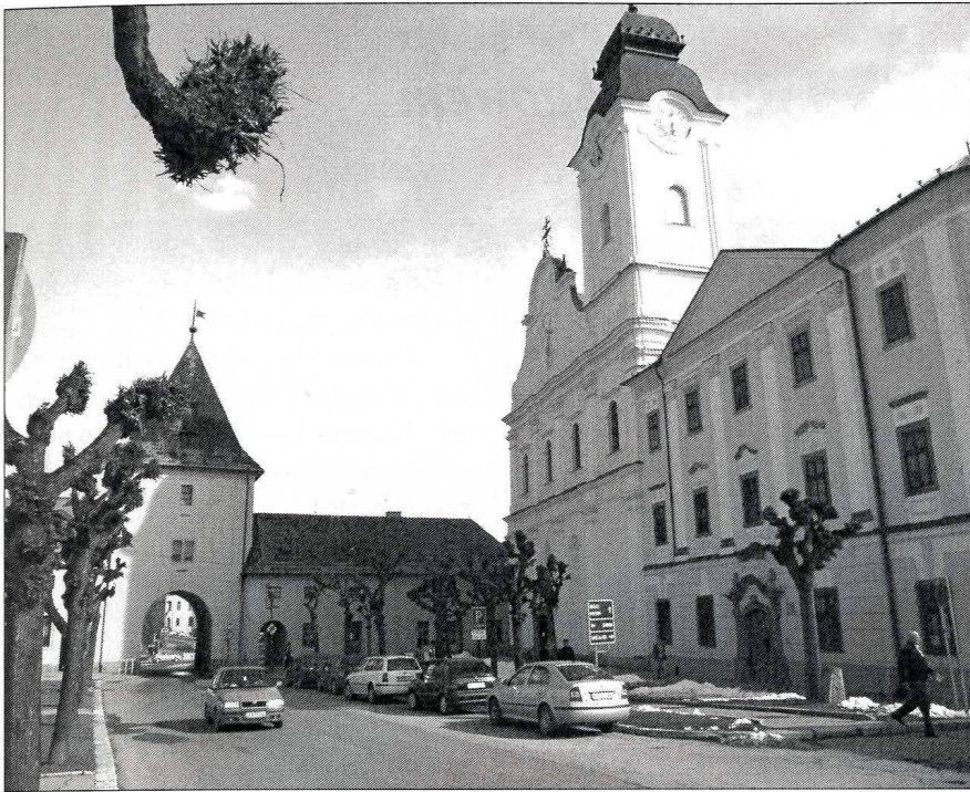
Nowy kościół Minorytów i Brama Koszycka