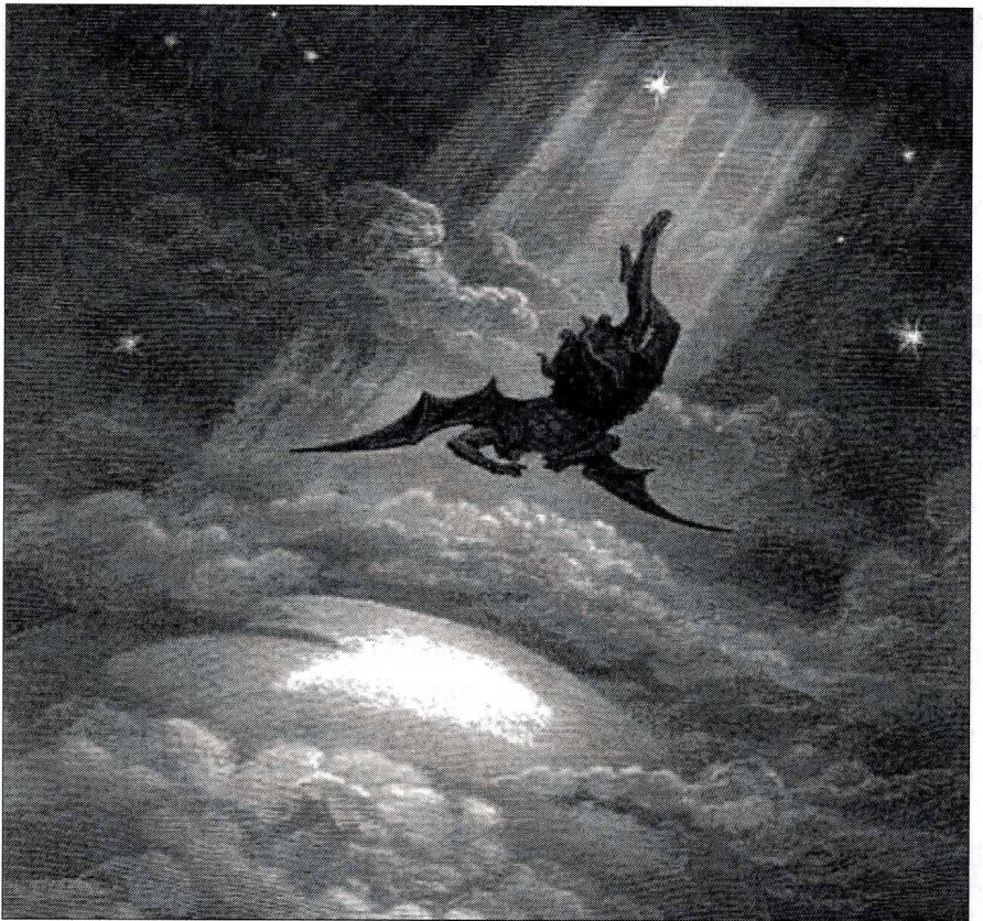
autor: Gustav Dore

1. Satanizm bezosobowy. Punktem wyjścia jest ukazywanie postaci Szatana bezosobowo. Dzieje się to w wielu współczesnych systemach