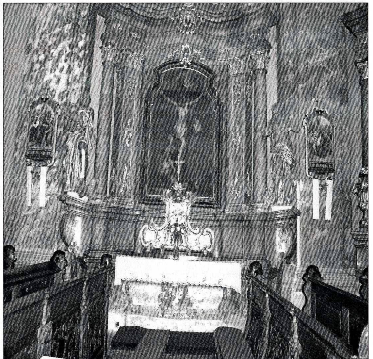
Główny ołtarz kościoła

Lewoczy, które udało się nam odwiedzić. Każda piękna, każda inna, każda ciekawa. Jeśli drogi Twojego życia, zawiodą Cię tu, Drogi Czytelniku, odwiedź je, dostrzeż ich piękno i powierz Panu i Maryi swoje sprawy w osobistej modlitwie.