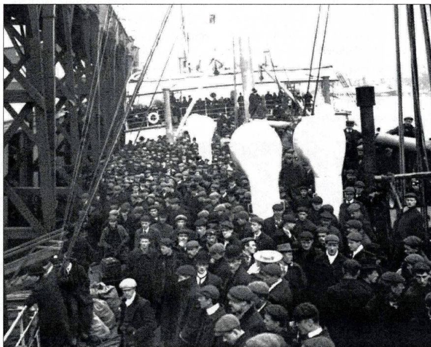
Irlandzcy emigranci- pierwsza poł.XIX w

niemal od zera i w bardzo ciężkich, surowych warunkach: wszechobecność i dziewiczość przyrody, opór tubylców czyli Indian, brak jakiegokolwiek zaplecza technicznego itd. Warunki te wymuszały niejako od przybyszów pewną dyscyplinę, zasady współdziałania, solidarność, lojalność wobec prawa i były tymi czynnikami, które sprzyjały tworzeniu się określonej w swoim wyrazie cywilizacji. Wyznania religijne, zwyczaje, folklor czy język nie miały z początku większego znaczenia, nawet konflikty na tle rasowym nie zdołały powstrzymać rozwoju cywilizacyjnego państwa, które oparte zostało na fundamentach de-