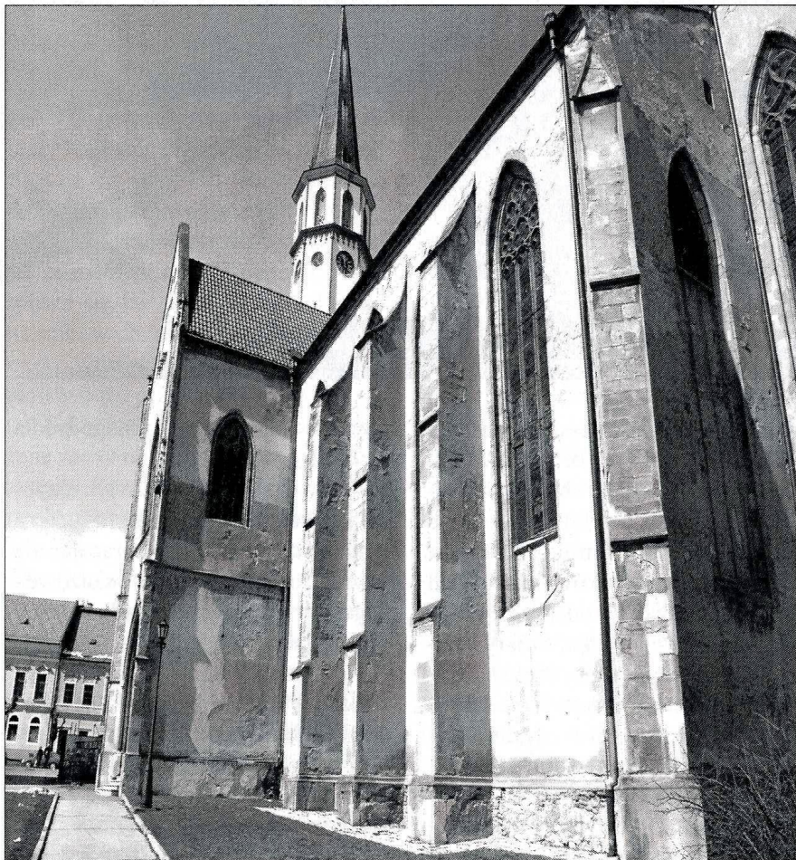
Zewnętrzna strona prezbiterium Fary Św. Jakuba wymagająca renowacji

Najwspanialszą z nich jest niewątpliwie stojący w centrum, na głównym placu, kościół farny pw. św. Jakuba Apostoła . Jest to największa świątynia gotycka na Spiszu, wzniesiona w roku 1400, na miejscu XIII-wiecznej budowli. Od zewnętrznej strony prezbiterium możemy podziwiać ciosy kamienne i gotyckie przypory umacniające konstrukcję. Niestety, od tej strony widać zniszczenia, którym ulegała świątynia w ciągu wieków – przydałaby się tutaj renowacja. Wewnątrz kościół jest bardzo piękny, choć przyznam, że jeszcze większe wrażenie zrobił na mnie, gdy byłem tu po raz pierwszy. Teraz wrażenie było już nieco mniejsze, choć w Polsce trudno byłoby odnaleźć tak dobrze zachowaną gotycką świątynię. Jej wnętrze jest bardzo przestronne, surowe ściany z ciosów kamiennych sprawiają, że przenosimy się jakby co najmniej pięćset lat wstecz. Uroku dodają świątyni także gotyckie i renesansowe ołtarze, których jest aż jedenaście. Najcenniejszy jest ołtarz główny ze wspaniałym rzeźbami Pawła z Lewoczy, ale niemniej piękne są inne ołtarze, autorstwa tegoż rzeźbiarza lub innych artystów. Szkoda, że sznur ogranicza możliwość dotarcia do prezbiterium, co więcej, jest on rozciągnięty mniej więcej w połowie nawy, tak, że do ołtarzy nie sposób się zbliżyć. Trzeba chronić zabytki przed niektórymi turystami – wandalami, ale czy aż w ten sposób? W świątyni są także inne cenne dzieła sztuki – ambona, ławy, kamienne nagrobki oraz dwa cykle malowideł gotyckich w lewej nawie. Trzeba to oso-