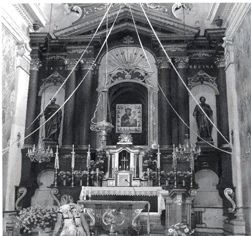
oltarz kościoła w Rudkach z obrazem Matki Bożej Rudeckiej