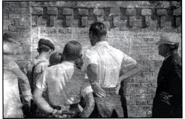
Mieszkańcy Sanoka czytają obwieszczenie o powszechnej mobilizacji naklejone na murze obok Starostwa przy ul. Sienkiewicza

podobnie pluton) zajął stanowiska ogniowe na Górze Parkowej, w okolicach kopca Mickiewicza i na jej zachodnim stoku. Nieregularna strzelanina rozpoczęła się w mieście 9 września, a ostatnim akordem tej mizernej obrony było wysadzenie mostu drogowego na Sanie w Sanoku-Olchowcach przez wycofujących się ostatnich żołnierzy polskich. Niemcy zajęli Sanok w godzinach wieczornych 9 września. Ponieważ most na Sanie był zniszczony, niemieccy saperzy przystąpili do jego odbudowy.