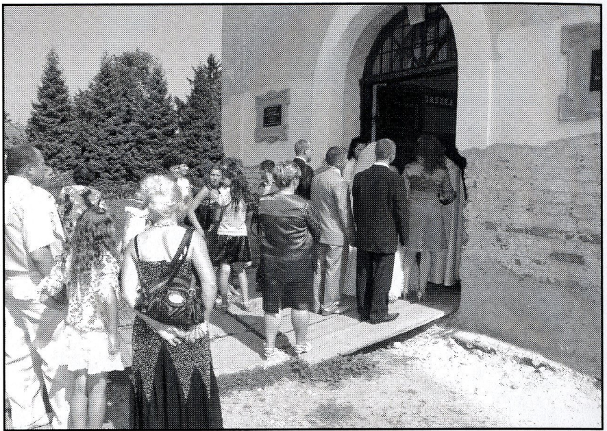
powitanie młodej pary w Rudkach