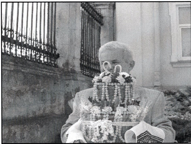
tort weselny przed katedrą