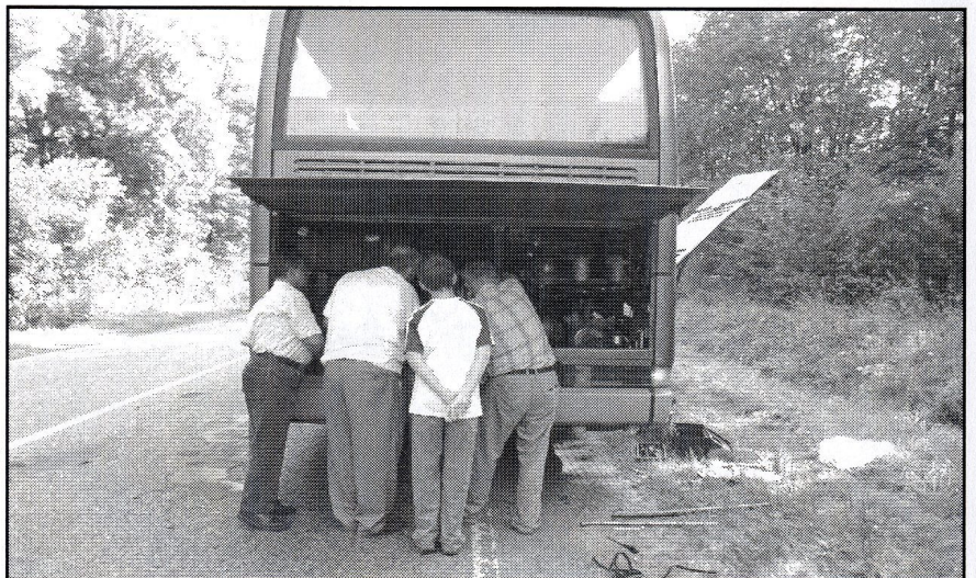
spokojnie, to tylko awaria

ukraińskiego mamy zamówiona Mszę świętą. Niestety, niedaleko Rudek, nasz autobus ma awarię. Z zazdrością