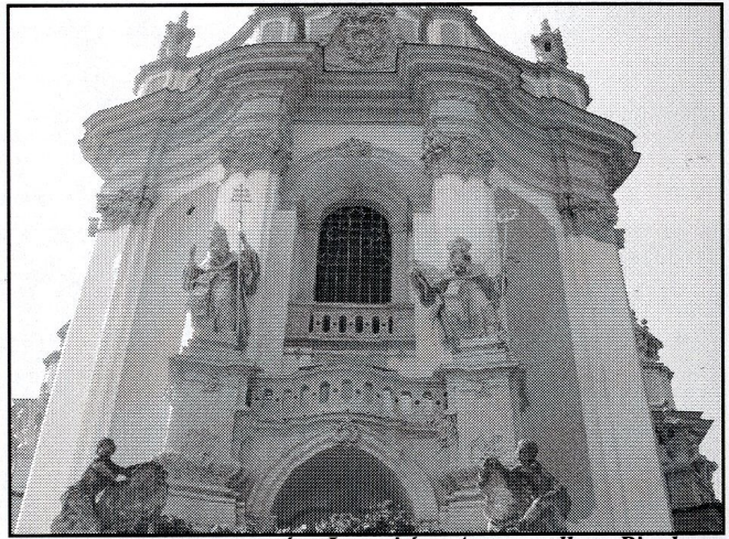
św. Leon i św. Atanazy dłuta Pinsla na fasadzie