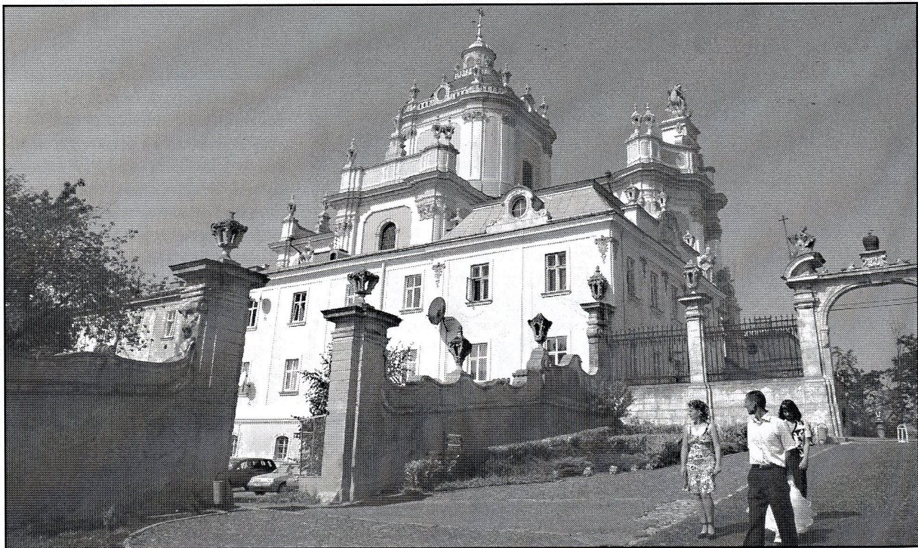
katedra św. Jura w całej okazałości