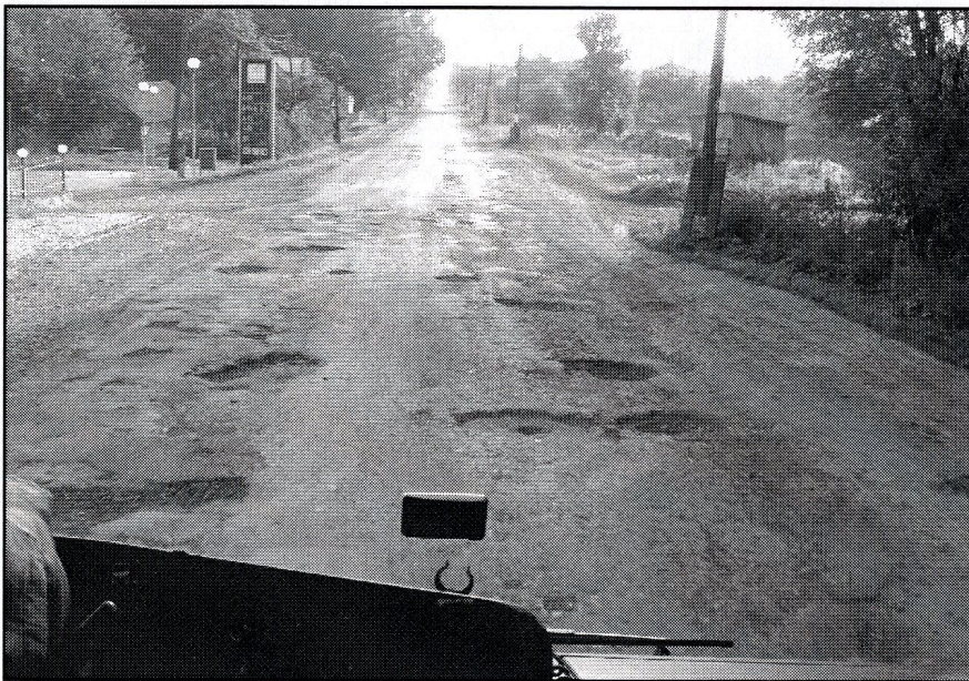
droga na Ukrainie

Matka Boża jest tu czczona od 1612 roku. Kościół rudecki był kiedyś piękny, niestety w czasach komunistycznych został zamknięty i przeznaczony na magazyn. Cudowny obraz został zabrany do Polski i przez wiele lat przebywał w Seminarium Duchownym w Przemyślu. Następnie abp Tokarczuk postanowił go przekazać do