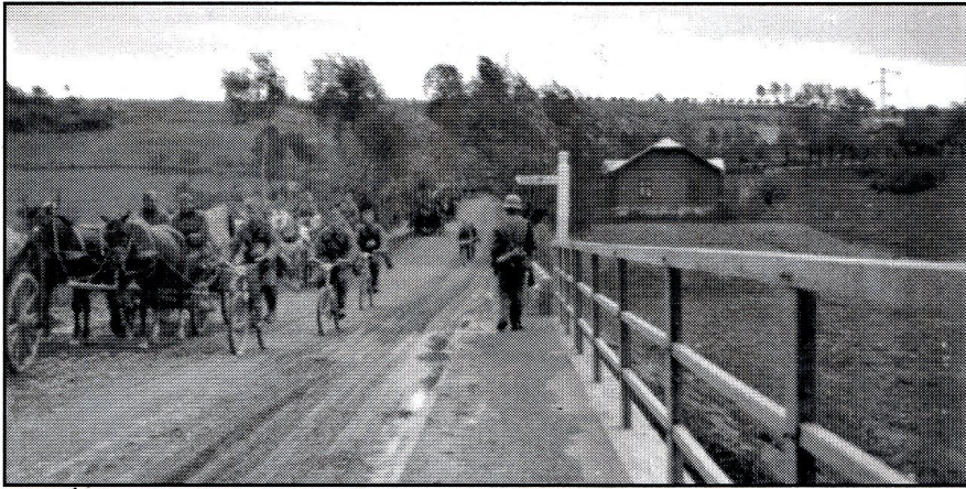
Żołnierze niemieccy przechodzą przez mostna Oslawie w Zagórze, wycofując się na linię demarkacyjną na lewy brzeg Sanu

ców, chcących zająć dom na kwaterę. Podczas gdy niemieckie jednostki uderzeniowe parły na wschód, Sanok – jako miasto na bezpośrednim zapleczu działań wojennych – pełen był niemieckich żołnierzy i sprzętu bojowego. Żołnierze niemieccy, świetnie wyekwipowani i odżywieni, stanowili kontrast w zestawieniu z polskimi żołnierzami, którzy parę dni temu przechodzili przez Sanok, cofając się na wschód – głodnymi, obdartymi, zniechęconymi. Ten kontrast powodował duże przygnębienie wśród mieszkańców. Większość reprezentacyjnych mieszkań w Sanoku zajęta została przez oficerów niemieckich na kwatery.