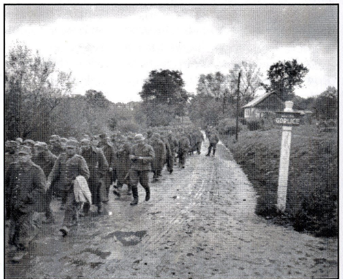
Kolumna polskich jeńców wojennych w okolicach Gorlic.