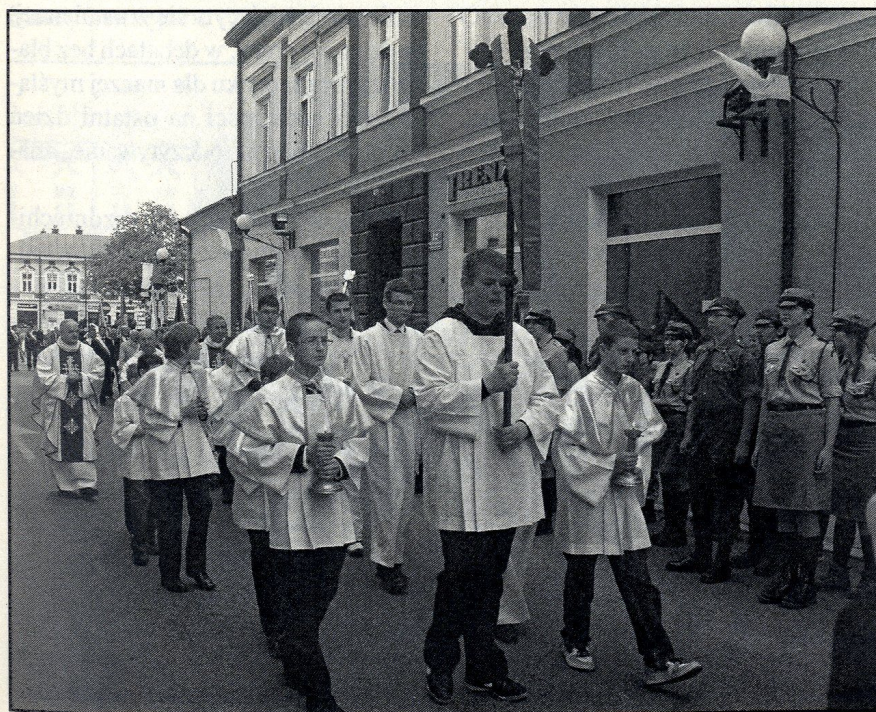
Procesja pod krzyż