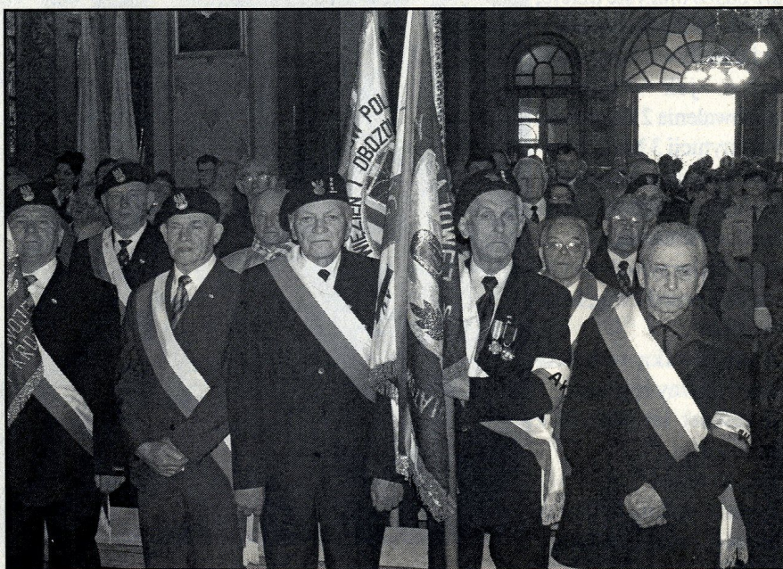
Delegacja Żołnierzy AK

NKWD. Ta okrutna zbrodnia dokonała się 70 lat temu. Prezydent Lech Kaczyński miał tam powiedzieć: „Zabijano ich – wcześniej skrępowanych – strzałem w tył głowy. Tak by krwi było mało. Później – ciągle z orłami na guzikach mundurów – kładziono w głębokich dołach. Tu, w Katyniu, takich śmierci było cztery tysiące czterysta. W Katyniu, Charkowie, Twerze, Kijowie, Chersoniu oraz w Mińsku – razem 21768” 1 . Nie danym mu to było. Raz jeszcze pokazało się jak zawodne są ludzkie wyliczenia, plany. Mówi św. Jakub: „Dlaczego teraz mówicie: