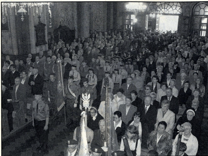
Harcerze, Górniczy i Poczty sztandarowe

życia. Jestem, abyś wskazywała mi zawsze drogę do swojego Syna. Jestem, aby żyć w stałej obecności Boga. Jestem, aby „zawsze stawiać sobie Pana przed oczy, aby nic mną nie zachwiało”. Jestem, aby posłuchać Twojego, Maryjo, wezwania: „Zróbcie wszystko, cokolwiek Syn mój wam powie”. Jestem, aby szukać oparcia w pełnieniu woli Bożej. Jestem, aby od Ciebie, Maryjo, uczyć się skromności, pokory, posłuszeństwa, uwielbiania Pana Boga, służby i bezgranicznego oddania się Bogu i Kościołowi. Jestem, aby u Ciebie, najlepsza Matko, szukać umocnienia w chwilach doświadczeń, choroby, cierpienia, niezrozumienia. Jestem, aby od Ciebie wyjść umocnionym, napełnionym Bogiem. Jestem, aby w Twojej szkole uczyć się miłości Boga i bliźniego.