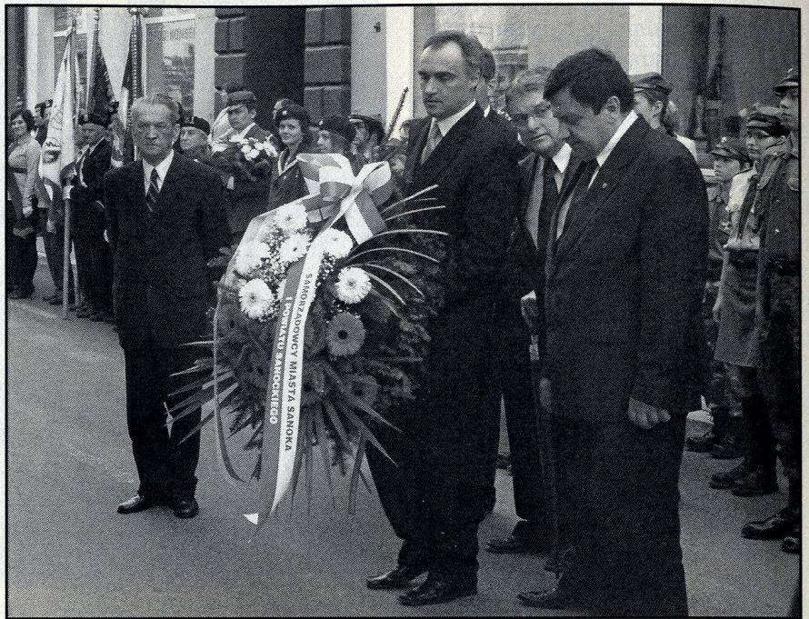
Wieniec składają władze miasta

„My chrześcijanie, wiemy o tym dobrze: prawda, nawet najboleśniejsza,