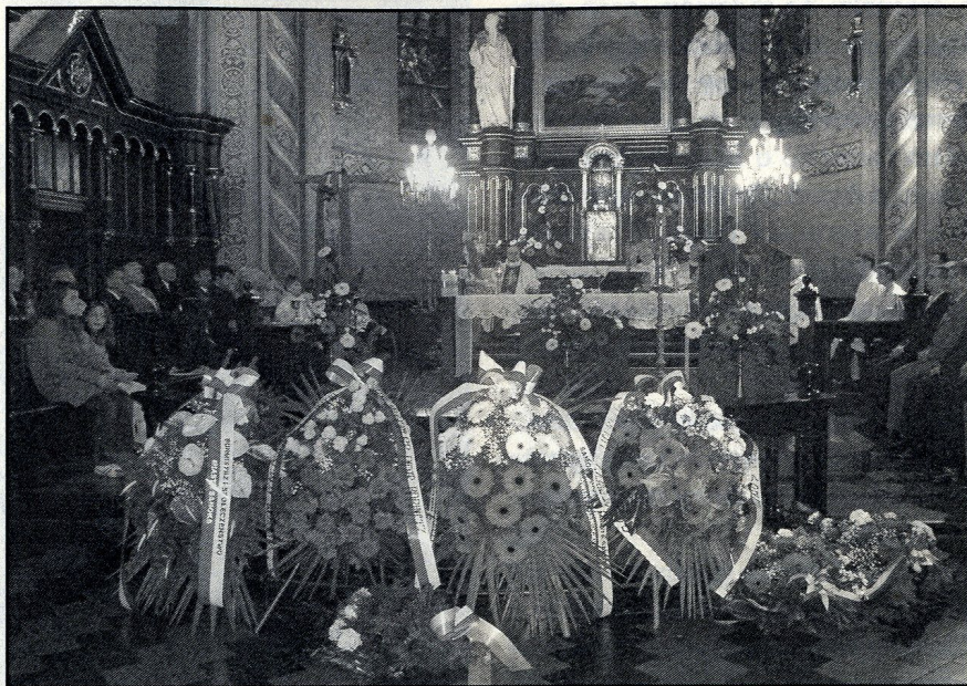
Wieniec w barwach białoczerwonych

„otrze z ich oczu każdą łzę i nie będzie już śmierci ani bólu, ani krzyku, ani cierpienia, bo pierwsze rzeczy przeminę-