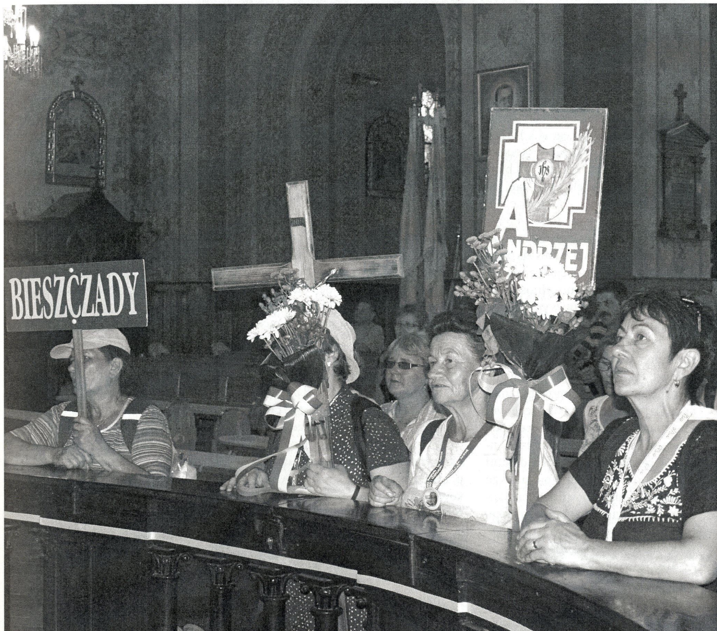
Pieszna pielgrzymka do Częstochowy nawiedza nasz kościół ( 4 VII )