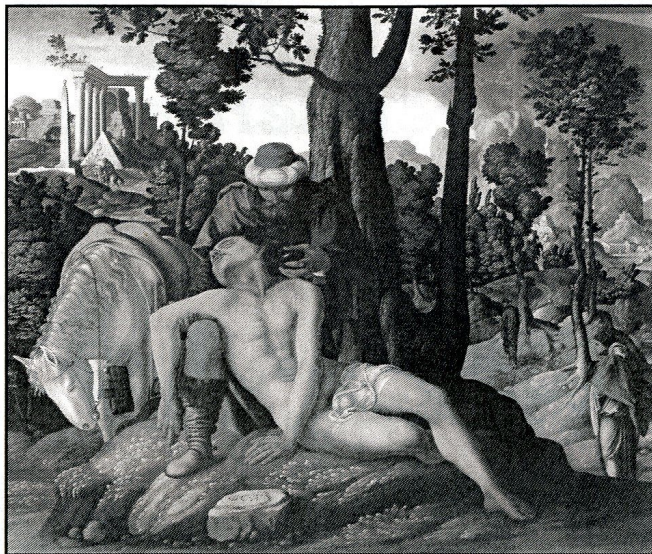
Nieznany malarz holenderski, „Miłosierny Samarytanin” 1537 r, Amsterdam

A zakres ten jest możliwie najszerszy i obejmuje każdego, dosłownie każdego człowieka żyjącego na ziemi. Samarytanin, który pomógł poranionemu Izraelicie, to w powszechnym mniemaniu przedstawiciel obcej nacji mieszańców etnicznych, odszczepieńców i błędnowierców. To ostatni z tych, których mogliby oni nazwać bliźnim. A jednak to właśnie on okazuje się człowiekiem gorącego serca. Spotkawszy nieszczęśnika, pobitego przy drodze, pochyla się nad nim (por. Łk 10,33), wydobywa z prymitywnej apteczki podróźnej wino do dezynfekcji i środek kojący - oliwę, opatruje