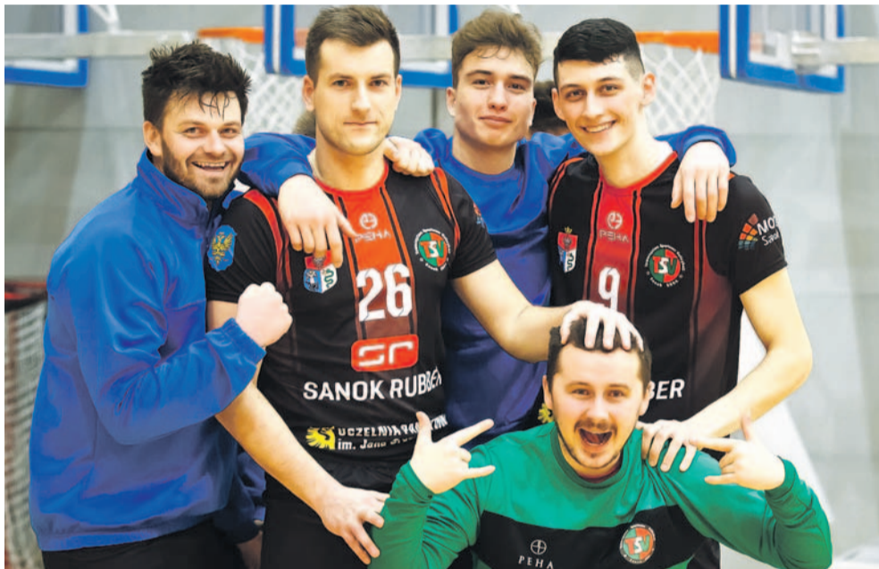
Siatkarze TSV przełamali się po serii trzech porażek z rzędu