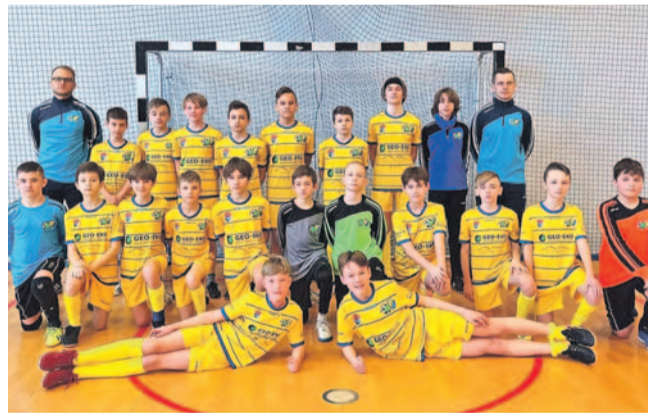
Po turnieju nie mogło zabraknąć wspólnego zdjęcia naszych drużyn