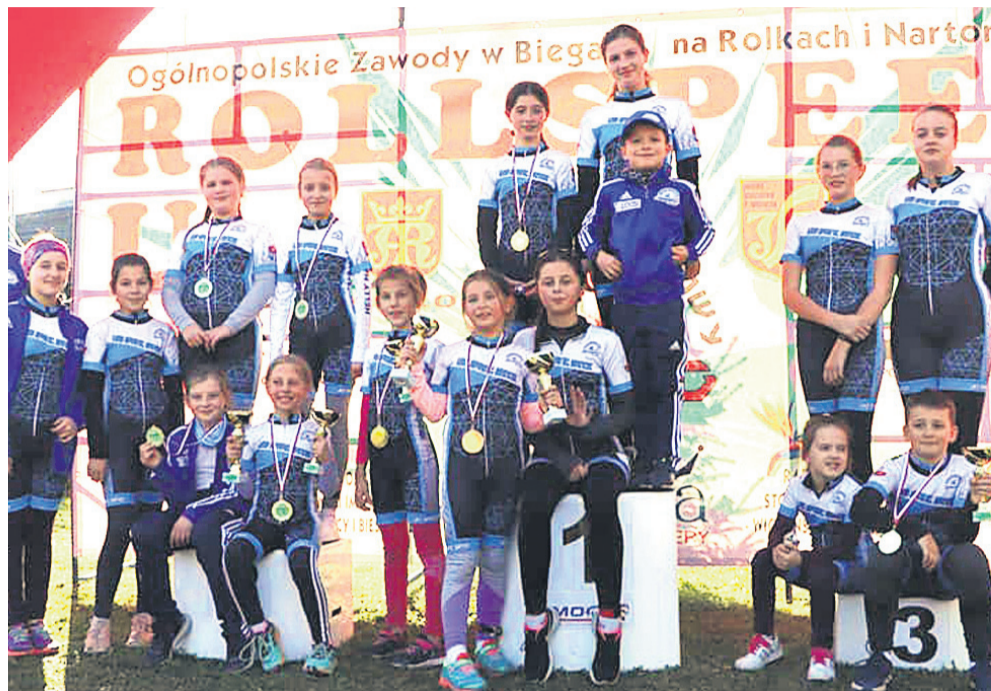
Wrotkarze Sprintu w dobrych nastrojach zakończyli wyczerpujący sezon

To już koniec sezonu. Ostatnim startem Sprintu były IX Zawody Run and Rollspeed Family Cup w Jasle, skąd znów udało się przywieźć sporo medali. Szczególnie cenne były te wywalczone w biegu otwartym na 10 km, bo naszym rolkarkom przypadło... całe podium!