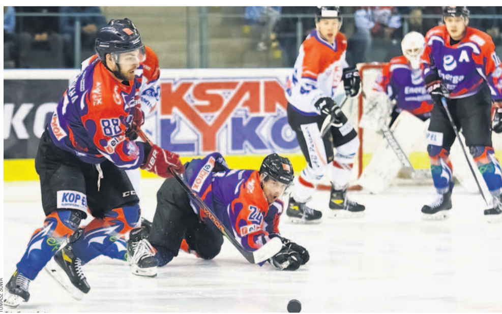
Zawodnicy z Torunia (ciemniejsze stroje) dali nam niezłą lekcję hokeja...

Najwyższa porażka od lat – poprzednie „baty” w dwucyfrowych rozmiarach trudno sobie przypomnieć. Energia wręcz zdemolowała graczy STS-u, zwłaszcza w ostatniej tercji, strzelając wtedy aż 5 goli w niespełna... 9 minut! Wpływ na fatalną postawę gospodarzy mogło mieć zasłabnięcie trenera Marka Ziętare, który trafił do szpitala.