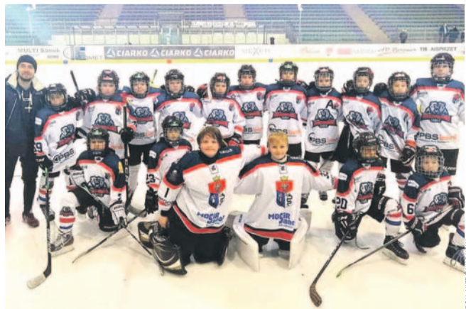
Drużyna żaków młodszych wygrała obydwa pojedynki