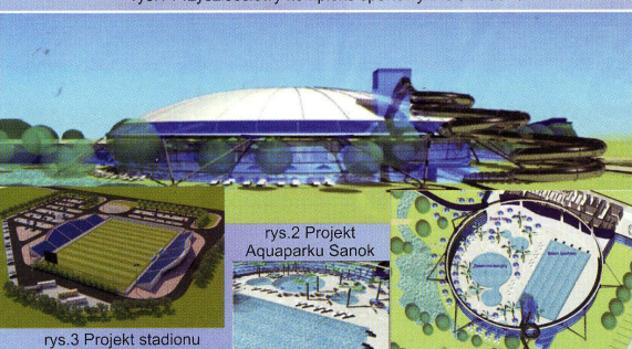
rys.2 Projekt Aquaparku Sanok