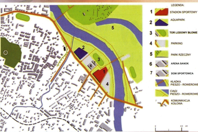
rys.4 Rozplanowanie obiektów sportowych przy drodze krajowej nr 28

Inwestycja marzeń nie jest mrzonką. To konkretny plan spełnienia oczekiwań sanoczan, stawienia czoła wyzwaniom XXI wieku, zrealizowania widocznych potrzeb. Coś – po prostu – niezbędnego.