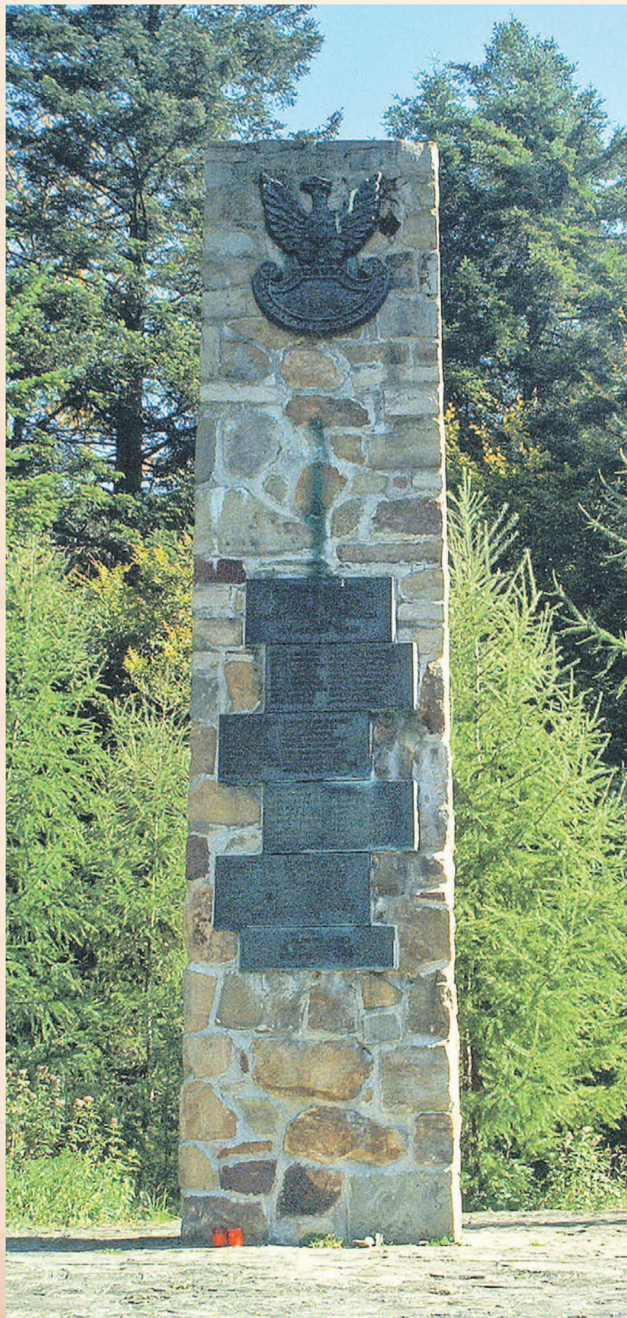
Pomnik pomordowanych w Jasielu

20 marca 1946 roku UPA rozgromiła w bieszczadzkiem Jasielu około stuosobowy oddział wojsk polskich, mordując część wziętych do niewoli jeńców. Była to największa porażka, jakiej polscy żołnierze doznali z rąk nacjonalistycznej partyzantki.