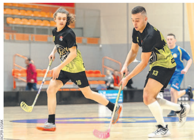
Zespół Jokera nie zmarnował szansy, uzyskując awans do półfinału

Mimo wszystko unihokeiści AZS UP nie stracili szansy na awans do półfinału, bo przynajmniej teoretycznie są najlepszą z drużyn, które w poniedziałek zagrają barażowy trójmecz. Ale Forest i Traf Oknoplast z pewnością tanio skóry nie sprzedadzą.