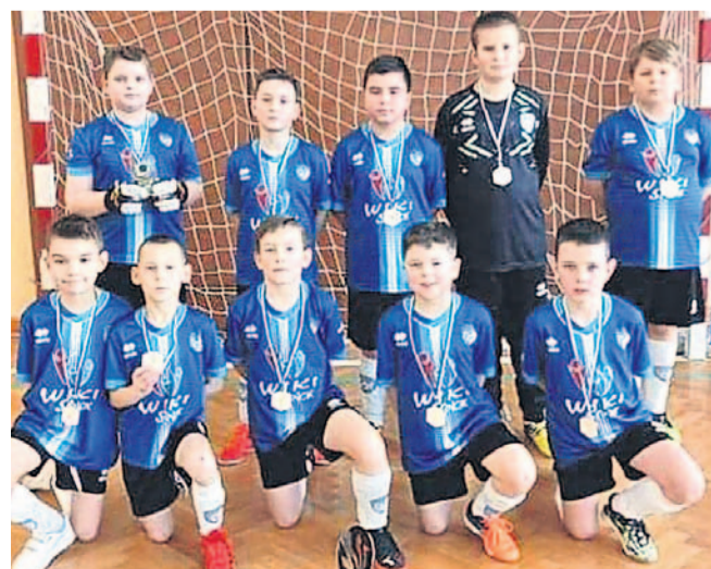
Podczas turnieju w Pruchniku drużyna AP Wiki zajęła 2. miejsce

Wszystkie mecze piłkarzy Wiki przed własną publicznością rozpoczynają się mają o godzinie 14 lub 15. Bilety w cenie 5 zł.