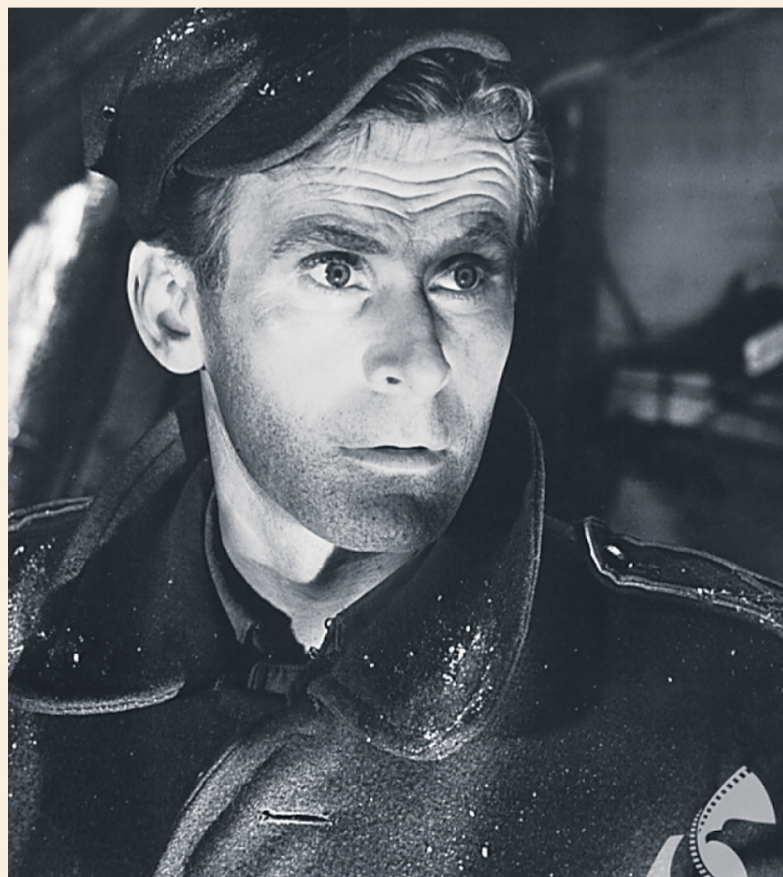
Kaleń, Filмотeka Narodowa