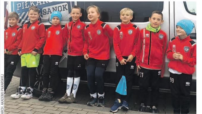
Drużyna AP wygrała Ekstraligę Talentów w Sosnowcu