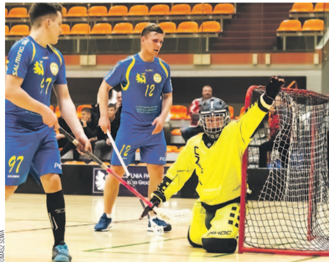
Unihokeiści AZS UP wygrali z broniącymi tytułu Wilkami

Druga kolejka rozgrywek pod patronatem Sanockiej Fundacji Rozwoju Sportu różniła się od inauguracji sezonu, bo tym razem mecze były zacięte. I nie brakowało niespodzianek – drużyna AZS UP wygrała z Wilkami, a Epaka.pl z Besco. Zwycięstwo odniósł też Joker Kosmetyki.