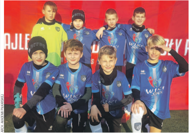
Akademicy okazali się najlepsi podczas turnieju Resovii