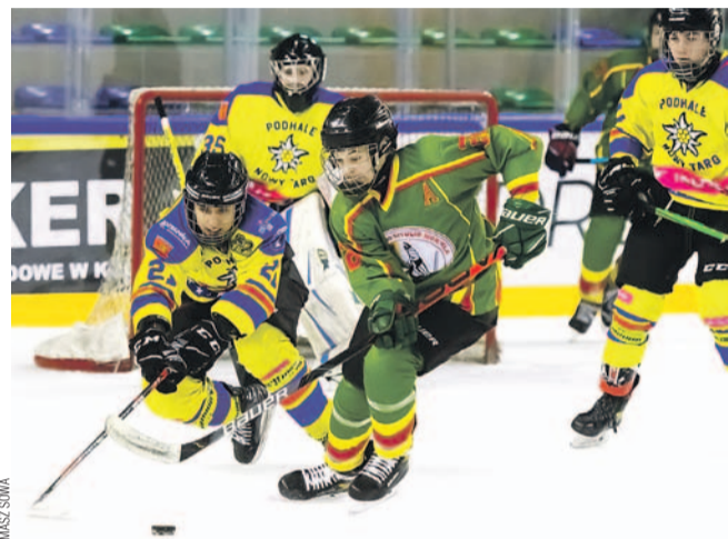
Hokeiści Podhala (na żółto) odnieśli zwycięstwo po zaciętej walce

tuż za turniejowym podium. Walka o czołowe pozycje była bardzo zacięta, a różnice punktowe – minimalne. Ostatecznie zwycięstwo odniosło Podhale z dorobkiem 16 pkt, wyprzedzając litweski Geležinis Vilkas Vilnius (15) i Unię Oświęcim (14).