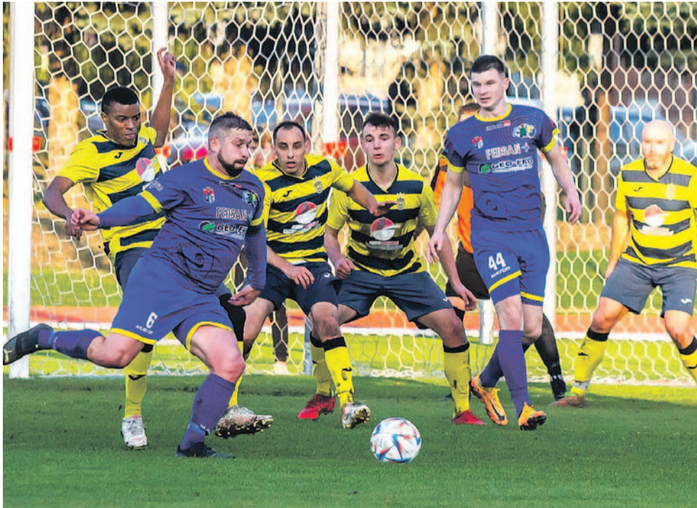
Piłkarze Ekoballu Stal (na niebiesko) zakończyli rundę jesienną w swoim stylu, czyli zwycięstwem 4:0