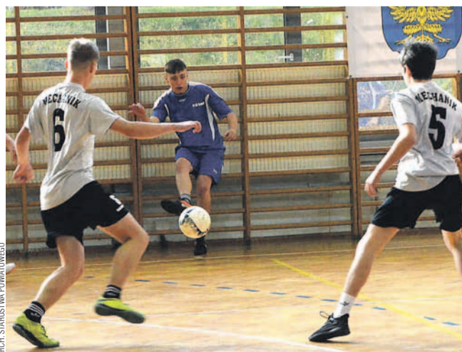
Zacięty turniej w ZS3 dostarczył kibicom wielu emocji