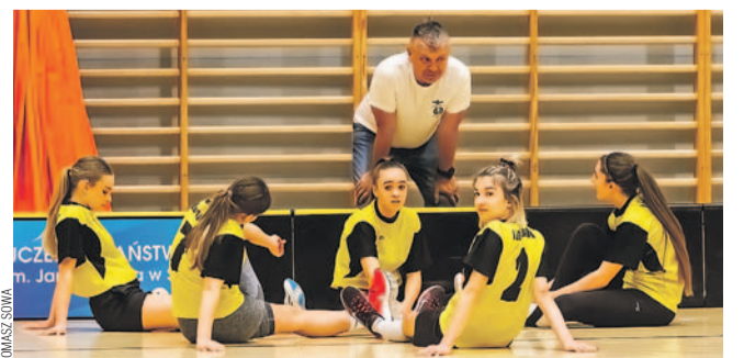
W kolejce nr 6 unihokeistki ILO miały najlepszy bilans bramek