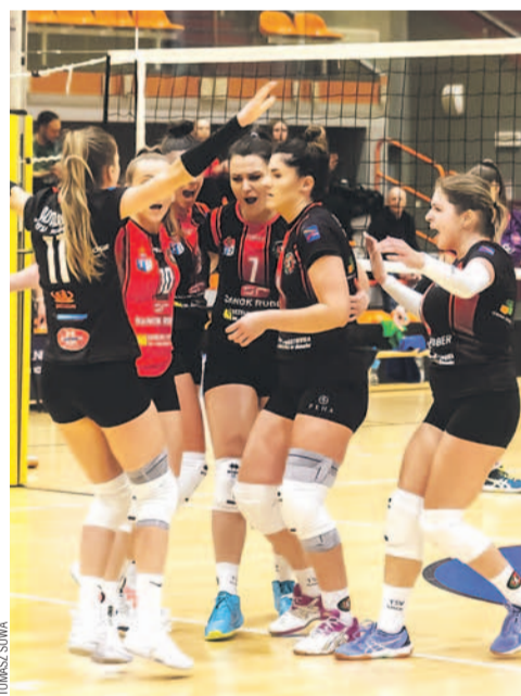
Drużyna TSV wciąż czeka na pierwsze zwycięstwo

W najbliższy weekend siatkarki TSV mają wolne, zagra za to Sanoczanka, podejmując UKS 15 San Pajdę Przemysł. Początek meczu o godz. 16.