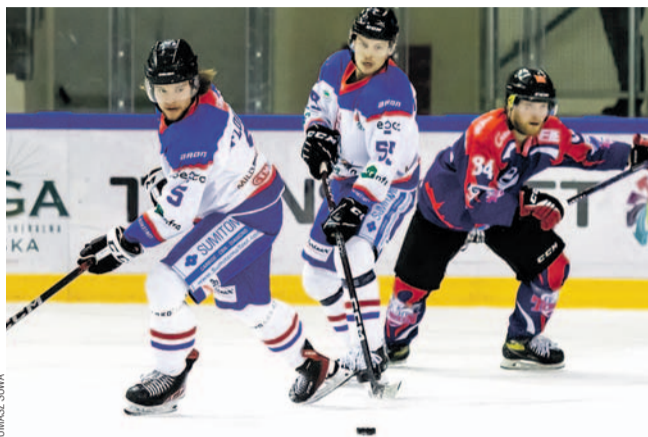
Tym razem hokeiści STS-u pokonali torunian, i to wyraźnie