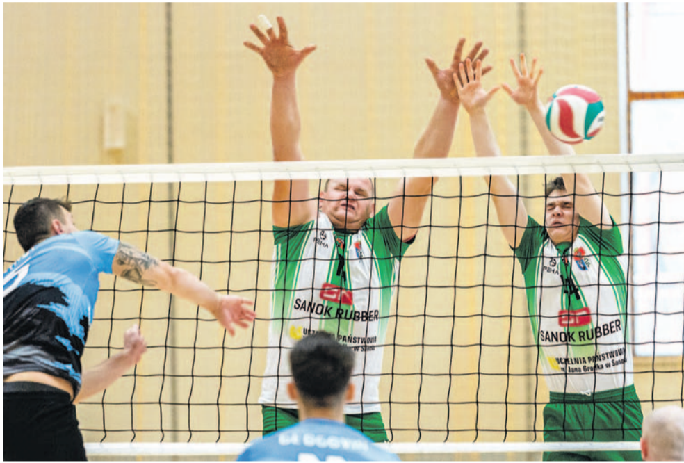
Siatkarze TSV (w głębi) znów musieli uznać wyższość zespołu zajmującego 3. miejsce w tabeli

Tydzień po przegranej z Anilaną Rakszawą kolejna porażka z 3. zespołem w tabeli. Tym razem udało się zdobyć jednego seta, co nie zmienia faktu, że rywale byli wyraźnie lepsi. Drużyna TSV spadła na przedostatnie miejsce i koniecznie musi szukać punktów w następnych spotkaniach.