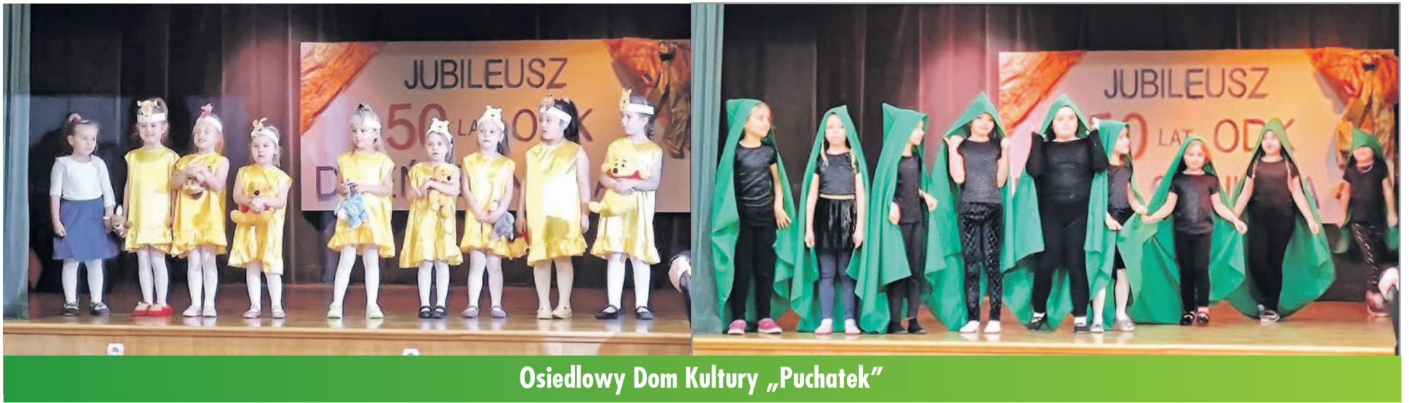
Osiedlowy Dom Kultury „Puchatek”