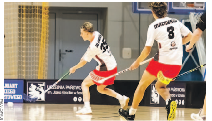
Zawodnicy Epaki.pl (na zdjęciu) pewnie pokonali Foresta