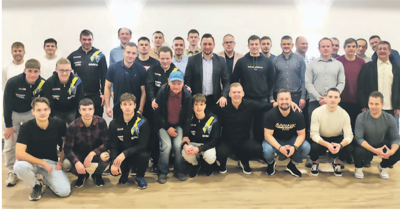
Rundę jesienną sezonu 2022/23 stalowcy podsumowali okolicznościowym spotkaniem w Sali Bankietowej „Karpacka”. Należała im się chwila relaksu, bo na półmetku rozgrywek są liderem z dorobkiem aż 43 punktów

Zdajemy sobie sprawę, że to dopiero połowa drogi i nikt nam nie ułatwi zadania w rundzie rewanżowej. Będziemy chcieli przede wszystkim dobrze przygotować się do drugiej części sezonu. Dobrze byłoby jeszcze wzmocnić zespół, bo na pewno nadejdą absencje z kartki i musimy być przygotowani na wszelkie nieprzewidywalne sytuacje. Ze swojej strony oraz w imieniu drużyny chciałbym bardzo podziękować kibicom za doping i już dziś zaprosić na mecze w rundzie wiosennej – powiedział trener stalowców.