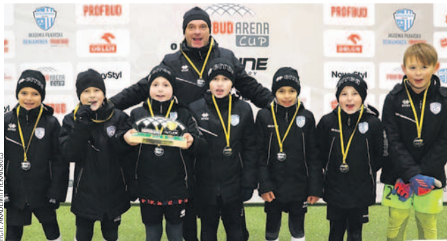
Orlicy młodsi AP odnieśli pewne zwycięstwo na turnieju w Krośnie