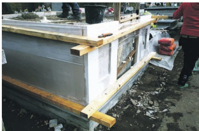
Prace przy restauracji nagrobka Franciszka