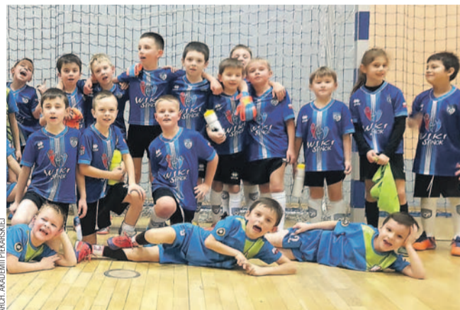
Zawodnicy Akademii Piłkarskiej z rocznika 2015

Mimo okrojonego składu drużyna 7-latków z Akademii Piłkarskiej okazała się najlepsza, pokonując prawie wszystkich rywali.