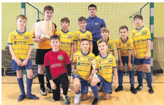
Piłkarze Ekoballu Stal wywalczyli 1. miejsce

Udany start drużyn Ekoballu – pierwsza odniosła zwycięstwo, a drugiej, którą tworzyli zawodnicy z młodszego rocznika, przypadło 3. miejsce.