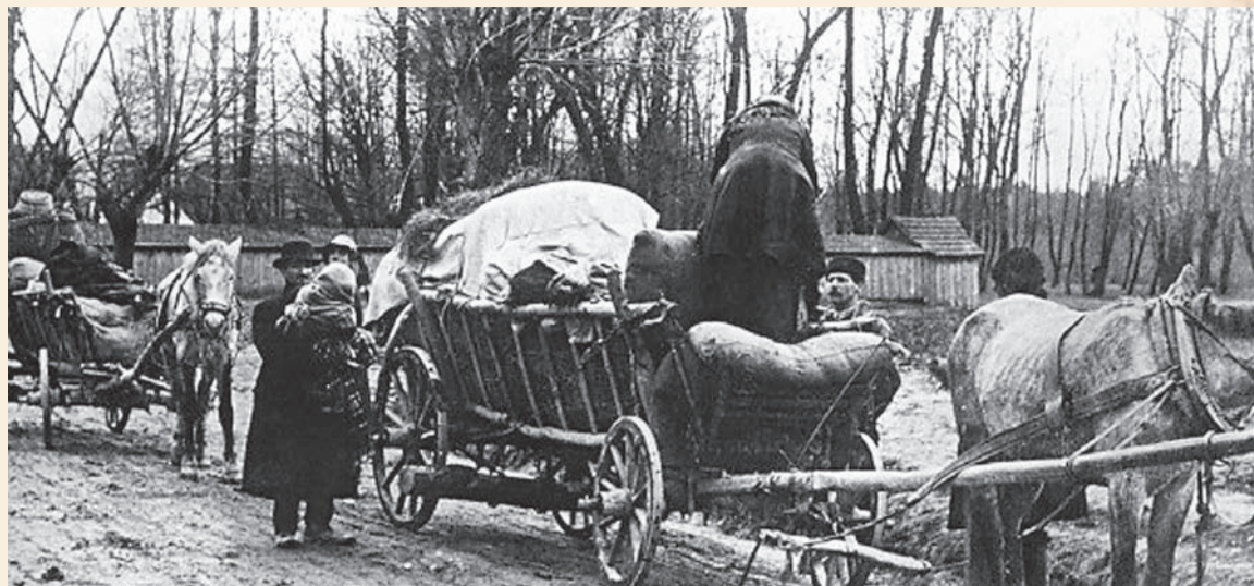
Uchodźcy w okolicach Nowego Sącza.