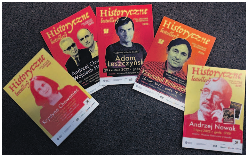
Projekt czytelniczy: „Historyczne bestsellery”