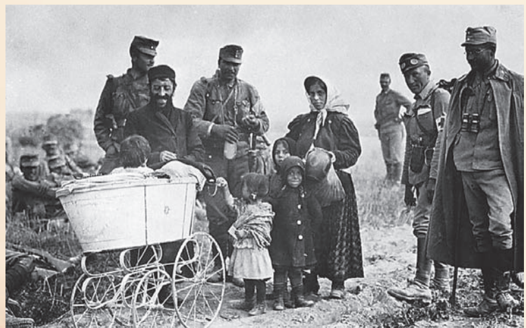
Galicyjscy uchodźcy żydowscy i towarzyszący im żołnierze.