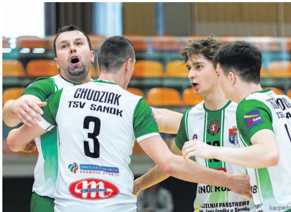
Siatkarze TSV rozegrali jedno z lepszych spotkań w tym sezonie, pewnie sięgając po komplet punktów

Drugą rundę rozgrywek drużyna TSV rozpoczęła identycznie jak pierwszą, zwycięstwem nad Klimą Błażowa, czyli wyżej notowanym rywalem. Tym razem już na własnym boisku i za 3 punkty. Efektem był awans na 7. miejsce w tabeli.