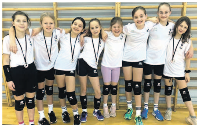
Najmłodsze siatkarki Sanoczanki

się wywalczyć miejsca 4. i 13. w rywalizacji „dwójek” oraz 8. w „trójkach”.