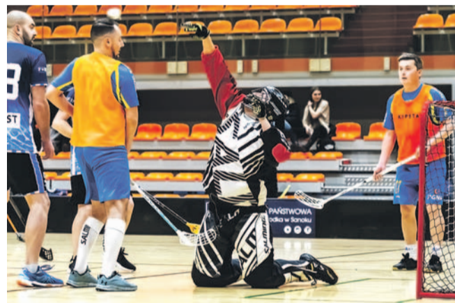
Unihokeiści AZS UP pewnie poradzi sobie z Forestem