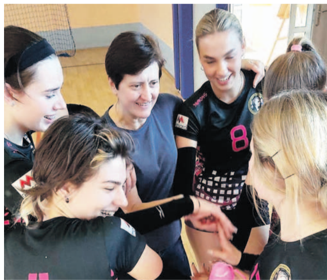
Drużyna ILO była poza zasięgiem rywali

Zawody w I Liceum Ogólnokształcącym zakończyły się zwycięstwami dziewcząt z II Liceum Ogólnokształcącego i męskiej drużyny gospodarzy. Obydwa zespoły awansowały do zmagania rejonowych.