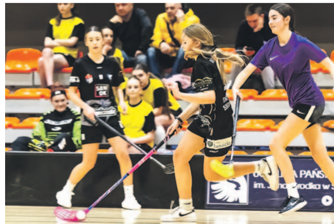
Zawodniczki Wilków powiększają przewagę nad rywalkami

Bramki: Czubek, Proć – Pałys 2, Osekowska.