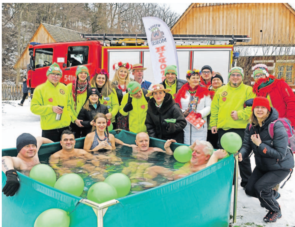
Wesołe Morsy Hipotermia Sanok podczas 30. Finału WOŚP na Galicyjskim Rynku

W razie braku śniegu kulig odbędzie się wozem na kołach.