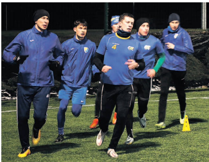
Pierwszy trening stalowcy zaliczyli na sztucznym boisku centrum „Wiki”