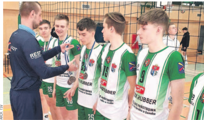
Juniorzy młodsi TSV odebrali medale za 3. miejsce w województwie

Tymczasem drużyna juniorów TSV wczoraj rozpoczęła ćwierćfinałowy turniej w Policach, gdzie jej grupowymi rywalami będą miejscowy SMS i WKS Wieluń. Po meczach wyniki znajdziecie na naszej stronie internetowej. Juniorzy młodsi od przyszłego czwartku grać będą w Kędzierzynie-Koźlu, natomiast turniej młodzików zaplanowany został na marzec (gospodarz nie jest jeszcze ustalony).