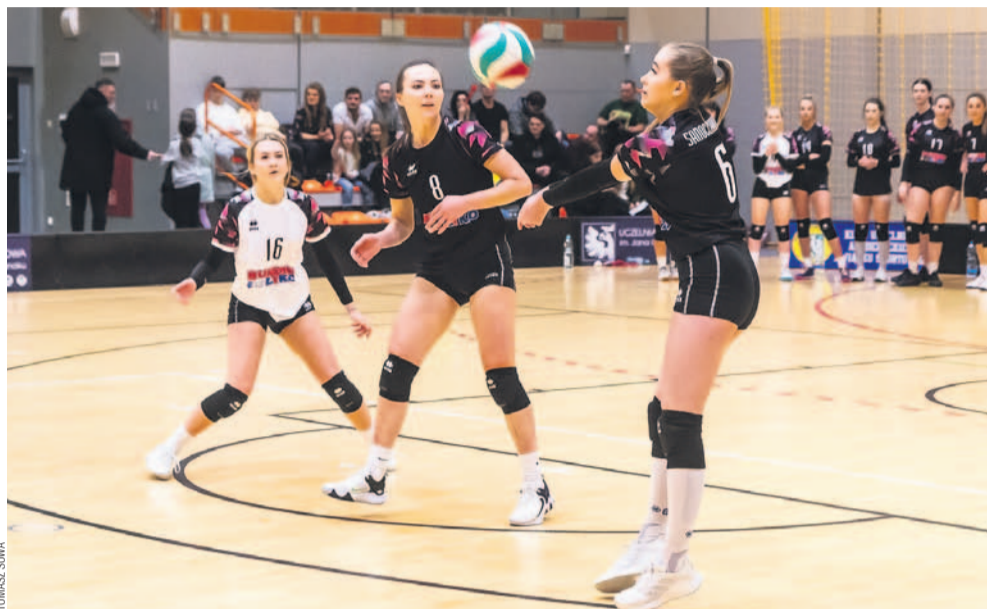
Siatkarki Sanoczanki odniosły kolejne zwycięstwo, szkoda jedynie, że nie za 3 punkty