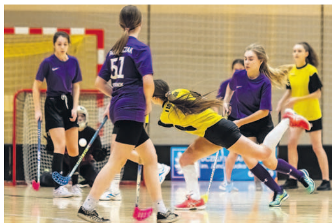
Unihokeistki IILO (na niebiesko) wygrały mecz z ILO