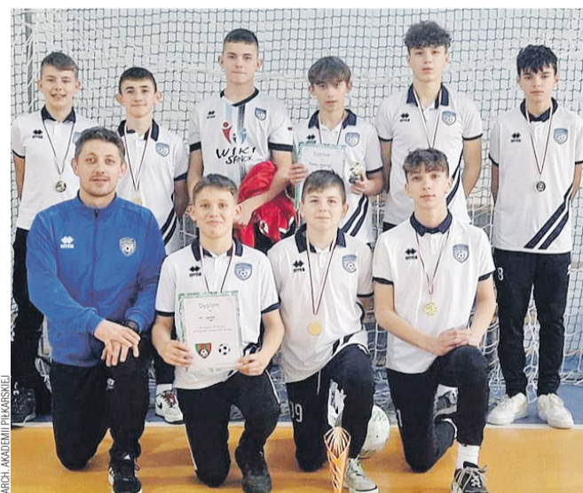
Trampkarze AP zajęli 3. miejsce na turnieju w Nowym Żmigrodzie