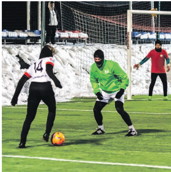
Pilkarze Wiki wygrali cztery pierwsze sparingi

WIKI SANOK – PARTYZANT TARGOWISKA 2:1 Bramki: gracz testowany, Fryc.