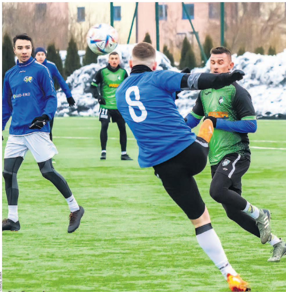
Drużyna Ekoballu Stal (na niebiesko) nie dała szans Błażowiance, strzelając aż 8 goli

Kapitałne rozpoczęcie kontrolnego cyklu – stalowcy nie dali najmniejszych szans zespołowi z rzeszowskiej „okręgówki”, niewiele zabrakło do zwycięstwa w dwucyfrowych rozmiarach. Cieszy forma przed drugą częścią sezonu, w którym cel jest jeden, jasny i niezmienny – powrót do IV Ligi Podkarpackiej.