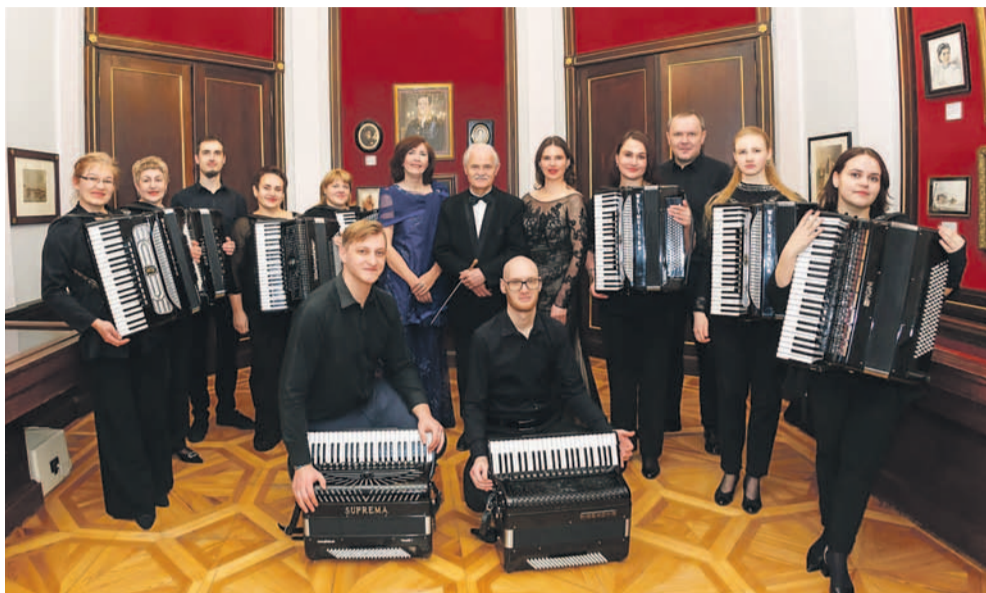
Orkiestra Akordeonowa „Consona” z Wilna