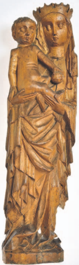
Matka Boska z Dzieciątkiem

wysokość: 70 cm | szerokość: 23 cm Material: drzewo lipowe Technika: snycerka, polichromia (niezachowana) Miejsce pochodzenia: Pomorze Gdańskie (niezidentyfikowany warsztat) Data powstania: schyłek XIV/ początek XV wieku