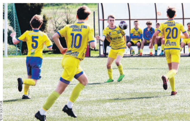
Juniorzy młodsi Ekoballu wygrali obydwa mecze, i to wysoko