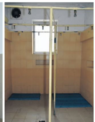
Korytarz, cela z zachowanym parkietem z epoki i łazienka więzienna