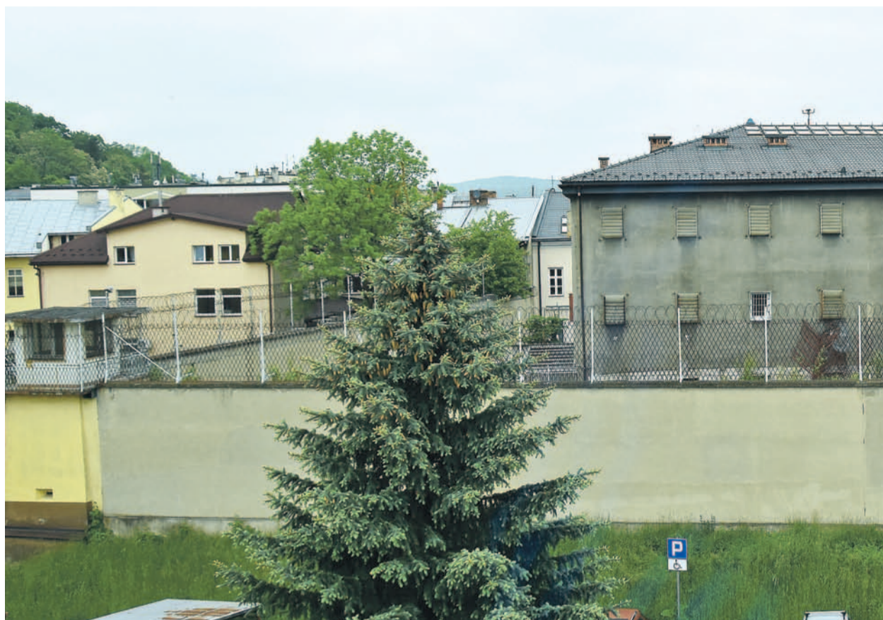
Widok z ul. Wąskiej na dawny zakład karny. Na murze po prawej tablica upamiętniająca Łukasza Cieplińskiego

Najprawdopodobniej pierwszą odnotowaną osobą w ewidencji jest osadzony w dniu 28 września 1939 r., a zatem kilkanaście dni po wkroczeniu Niemców do miasta. Nie oznacza to jednak, że do tego czasu okupanci nie dokonywali aresztowań. W kolejnych miesiącach przelomu 1939/1940 r. nastąpiło masowe zapelnienie więzienia zatrzymanymi. Wśród nich było wielu pochodzących z odległych części Polski. Przybyli oni w nasze