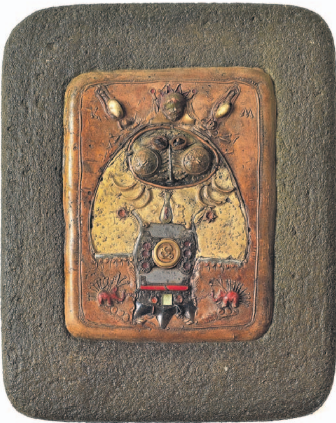
Relief „Diablę”, lata 70.