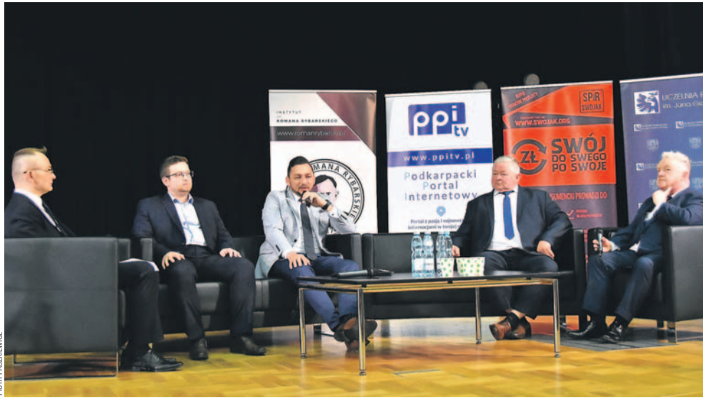
Dyskusja panelowa podczas konferencji.