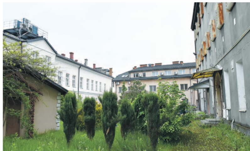
Z lewej gmach sądu, z którego doprowadzano zatrzymanych do więzienia po prawej