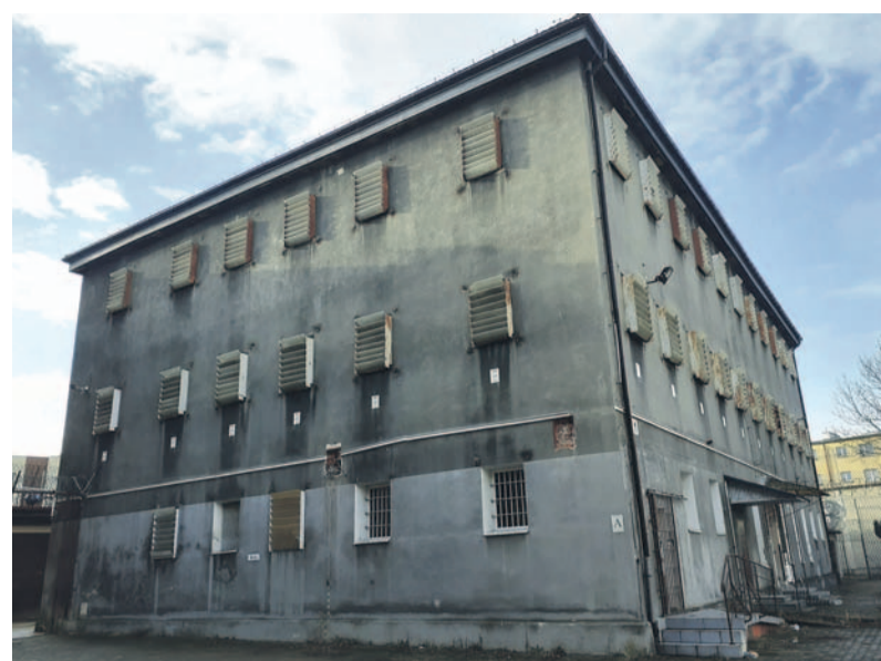
Budynek więzienny – widok od strony Zaulku Dobrego Wojaka Szwejka