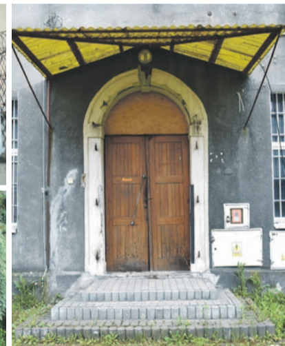
Wieża wartownicza, studnia na dziedzińcu i drzwi do budynku więzienia