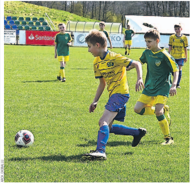
Młodzicy młodsi Ekoballu (na żółto) odnieśli wysokie zwycięstwo

Grupa 3 EKOBALL SANOK – KARPATY KROSNO 4:0 (2:0) Bramki: Czopor (1), Kasperk (30+2), Solecki (32), samobójca (60).