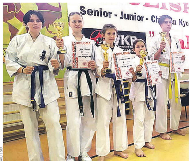
Zawodnicy SKK udanie zaprezentowali się na turnieju w Leżajsku