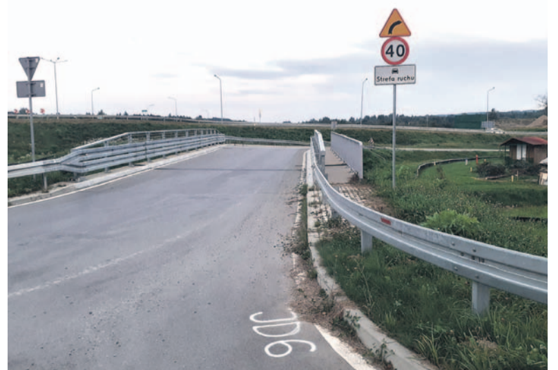
Mostek MD-5A z zagrodzonym przejściem