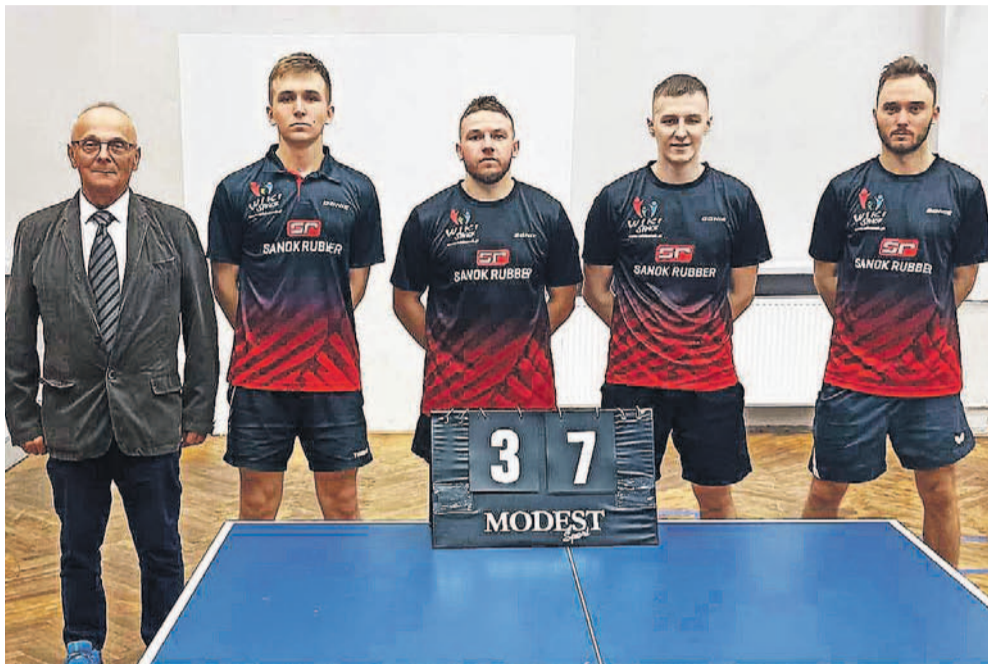
Drużyna SKT kapitalnie rozpoczęła rozgrywki II ligi, od wyjazdowego zwycięstwa w Krakowie

SKT: Kapik 2,5, Staszczyk 2, Poliniewicz 1,5, Seroka 1.