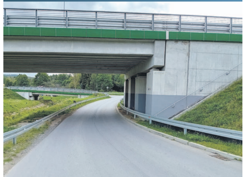
Nieprzyjazny pieszym odcinek pod wiaduktem MD-5. W tle mostek MD-5A

Osobne pytania dotyczące wykonania elementów obwodnicy i w tych przypadkach odpowiedzi udzieliła GDDKiA Oddział w Rzeszowie. Pierwsza ze spraw dotyczy odcinka ul. Konopnickiej pod wiaduktem MD-5. Jezdnia tam biegnie łukiem i opadająco, co skutkuje zwiększoną prędkością pojazdów jadących od strony miasta oraz ograniczeniem pełnej widoczności. To ten fragment pokonują piesi omawiani wcześniej. Nie ma tam chodnika i dla własnego bezpieczeństwa są zmuszeni albo stąpać po krawężniku (idąc prawidłowo w stronę miasta) albo tuż przy barierze ochronnej. W obu przypadkach nie jest to ani łatwe, ani wygodne i tym bardziej niebezpieczne, a na pewno nie dla ludzi starszych. Odpowiedź z GDDKiA brzmiała: – Nie planujemy budowy chodnika w tym miejscu. Jeżeli chodzi o prędkość, do jej kontroli uprawniona jest Policja.