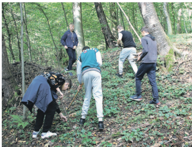
Uczniowie SP6 porządkują miejsce straceń w Olchowcach

W akcję włączali się również uczniowie „Szóstki”, którzy wraz z wychowawczynią uporządkowali miejsce. Działanie to również miało charakter edukacyjny, gdyż porządkowanie grobów świadczy nie tylko o pamięci i szacunku, ale jest również wspaniałą lekcją historii.