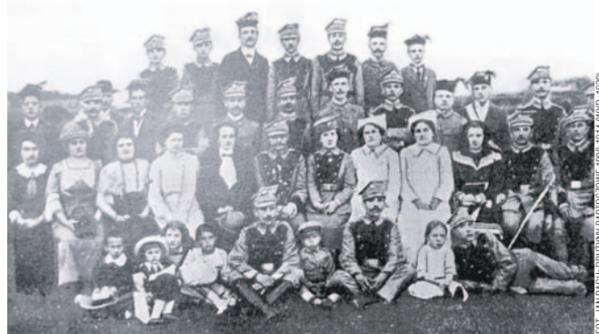
Tustanowscy z Chorągwią Sanocką DB po rewii 1 czerwca 1913 r.