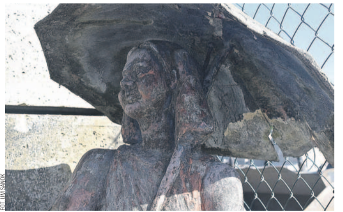
Ulubiony pomnik sanoczan nie wróci na swoje miejsce

Pomnik „Dziewczynki w deszczu”, określanej też jako „Dziewczynka z parasolką”, to fontanna, która na stałe wpisała się w krajobraz Sanoka, będąc niejako jego znakiem rozpoznawczym. Niestety, wizytówka miasta nie wróci już na swoje miejsce, ponieważ podczas ostatniej próby renowacji rzeźba zaczęła się rozpadać.