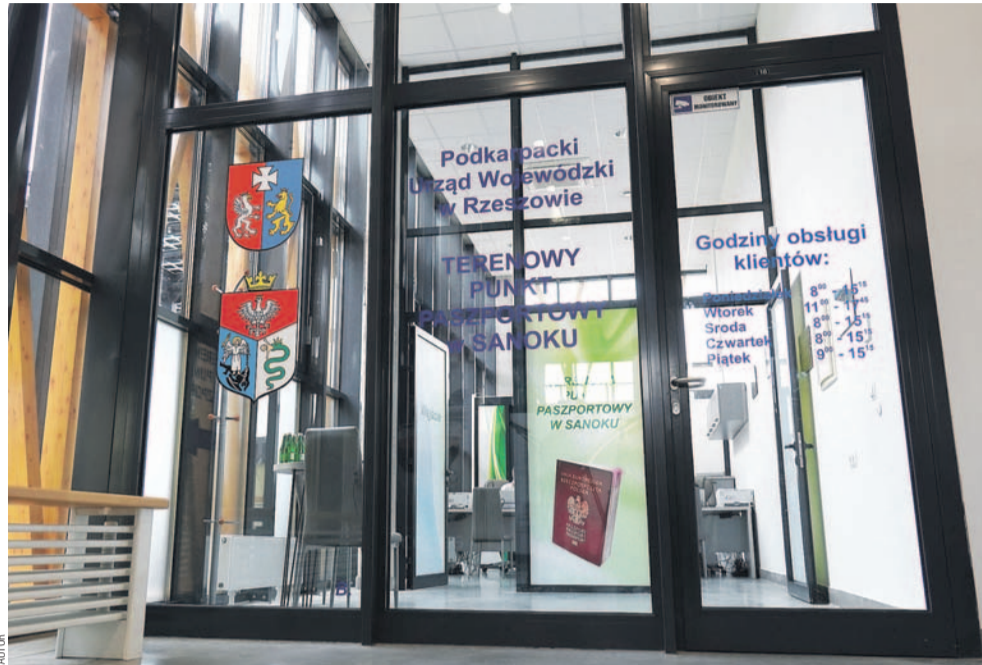
Od października w budynku Dworca Multimodalnego można wyrobić paszport

– Urzędy publiczne powinny być jak najbliżej ludzi. Nowo powstałe biuro paszportowe