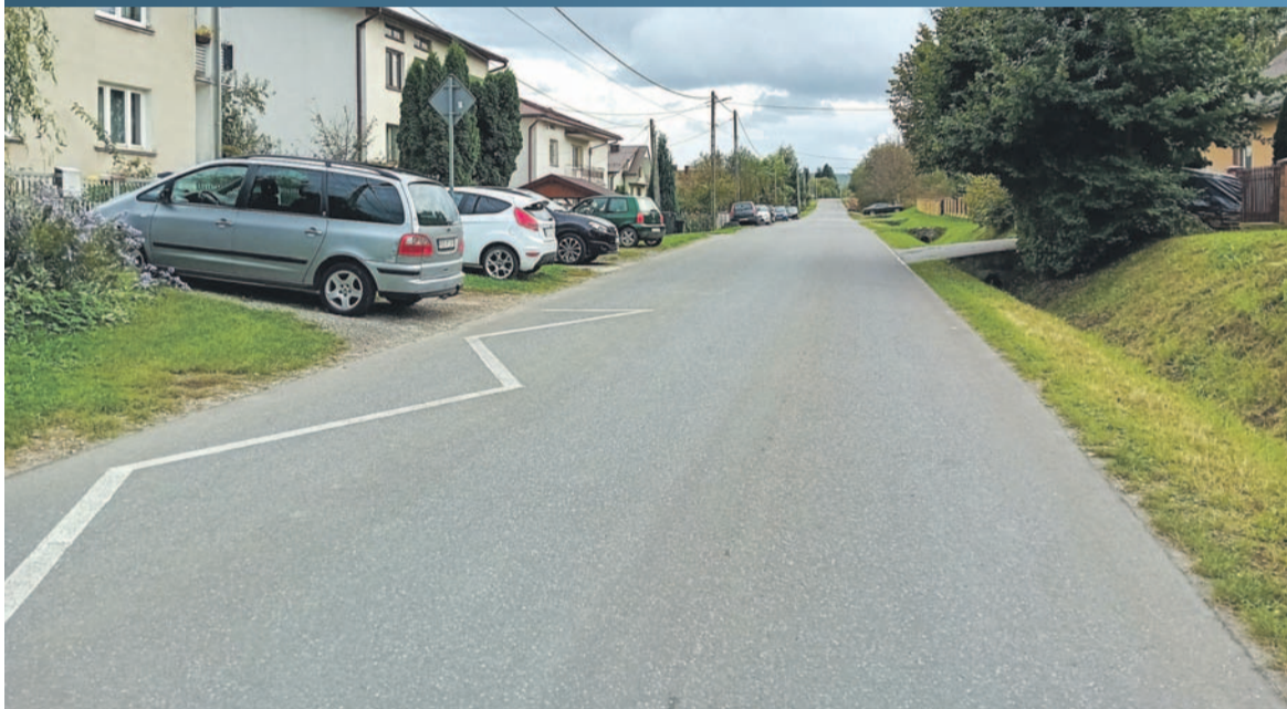
Ulica Konopnickiej otoczona autami na poboczu

W początkowym fragmencie ul. Konopnickiej, tj. od skrzyżowania z ul. Rymanowską, od lat istnieje chodnik. Budowę następnego fragmentu w czerwcu 2022 r. zapowiadał Powiat Sanocki. Długość wymierzono na 67 m i krótki odcinek powstał od skrzyżowania z ul. 1000-lecia.