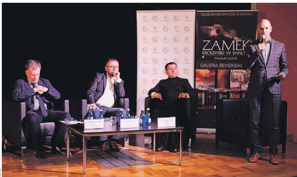
Prelegenci podczas konferencji

W dniach 30 marca – 1 kwietnia 2023 została dokonana ekshumacja ich szczątków,