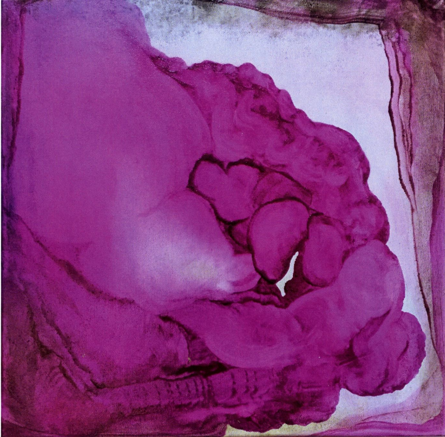
20231021 / DOTYK-TOUCH Georgia O'Keeffe, 39x39cm, płótno, farba witrażowa