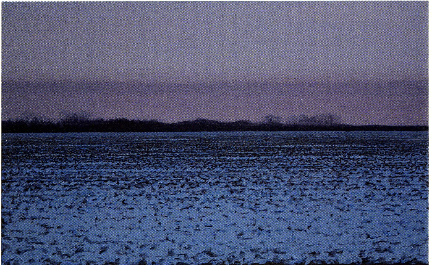
Pejzaż zimowy V (Dzików) / akryl na płótnie / 50x80cm / 2022 r.