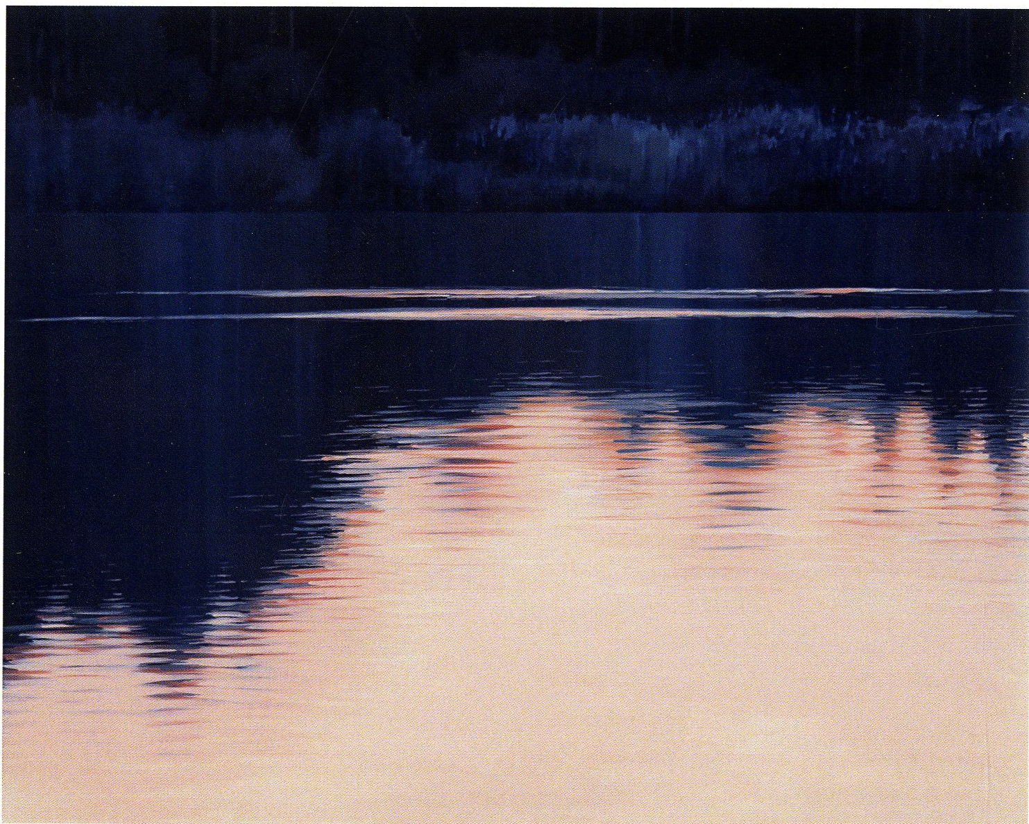
Odbicia II / akryl na płótnie / 100x80cm / 2021 r.