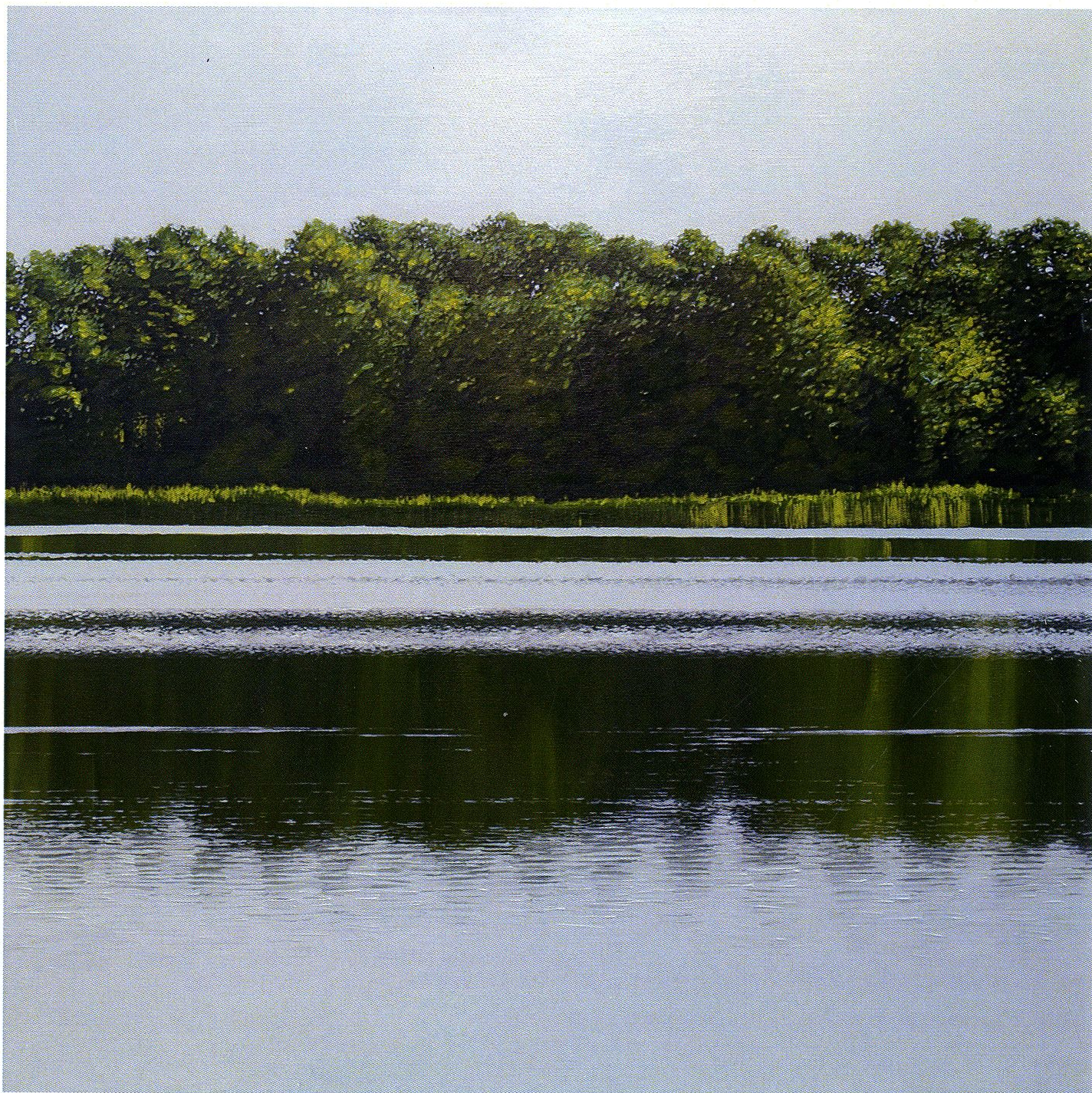
Południe / akryl, olej na płótnie / 80x80cm / 2021 r.