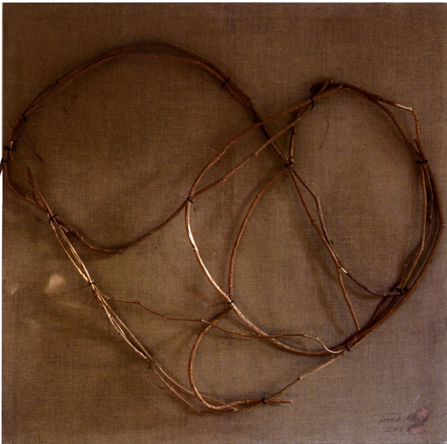
Wybaczenie / 130x130x10cm / krosno, płótno klejone, gałęzie / 2023