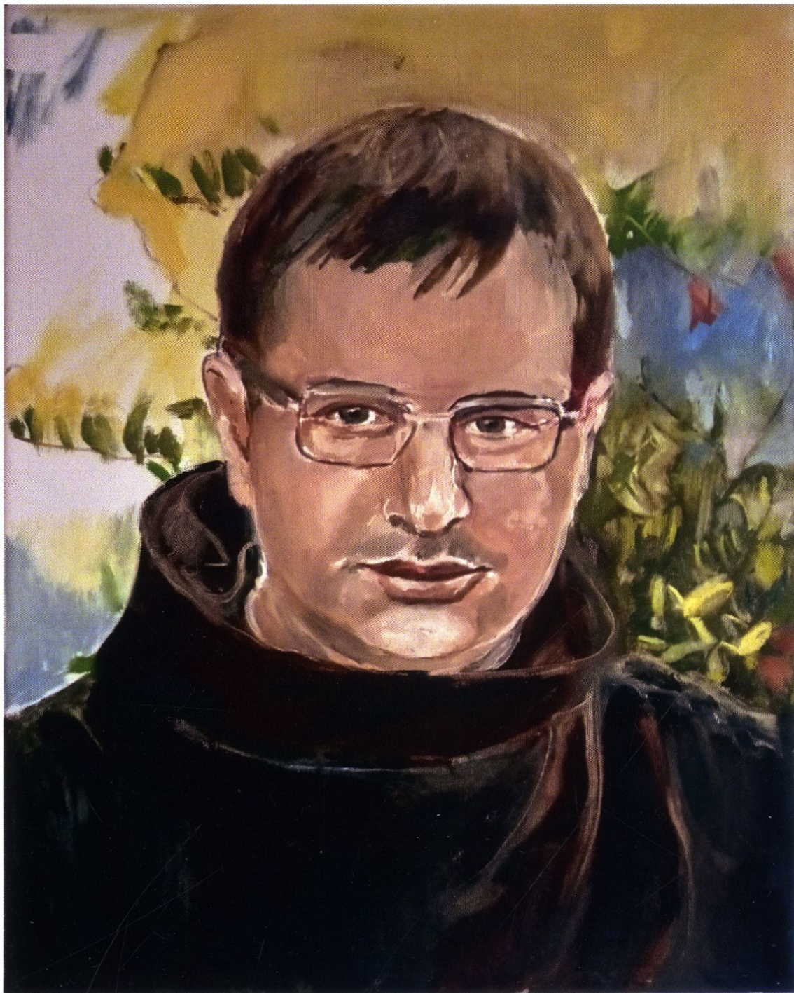
br. Emil Rufin Turek / 50x40 cm / olej, płótno / 2023