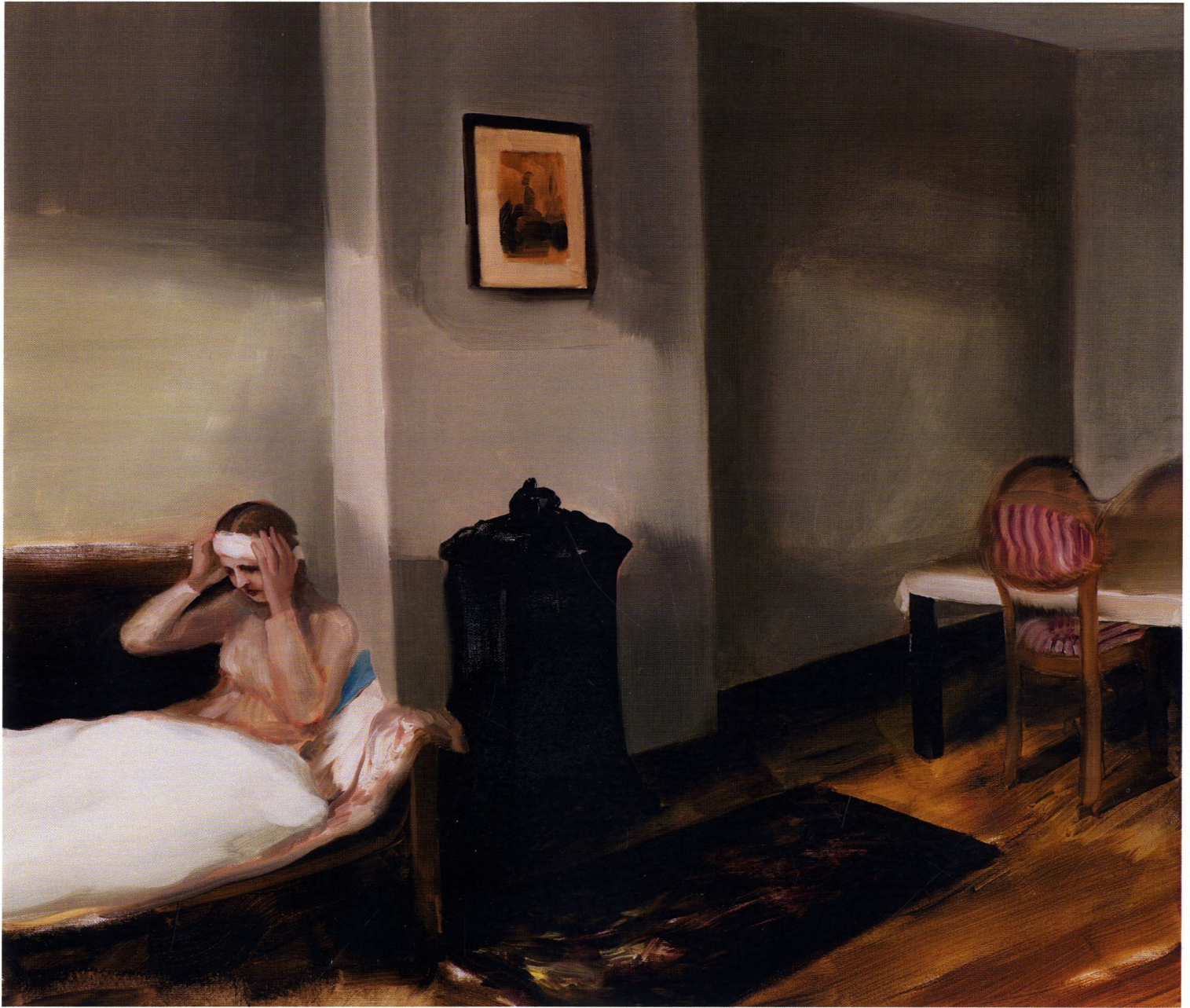
Szara godzina / 70 x 80 cm / olej na płótnie / 2014 r.