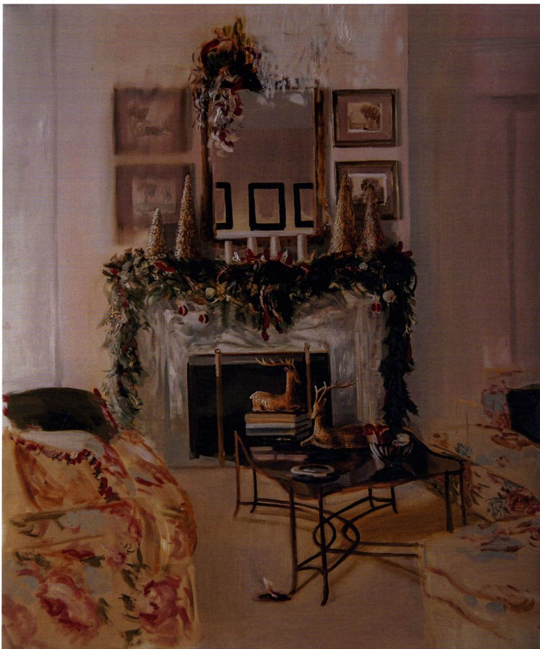
Niezbyt udane święta / 100 x 120 cm / olej na płótnie / 2015 r.