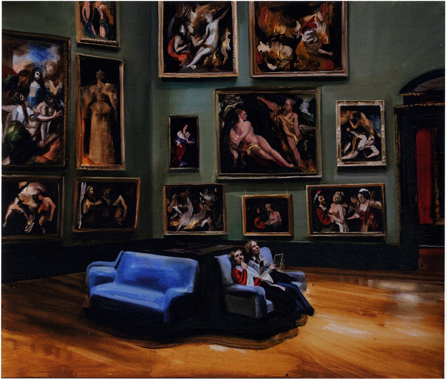
Muzeum II / 60 x 70 cm / olej na płótnie / 2016 r.