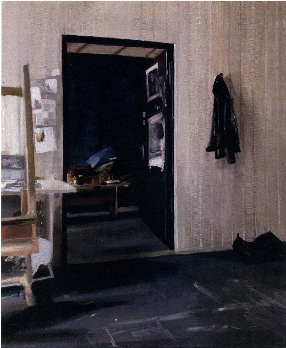
Pracownia Sylwka / 60 x 50 cm / olej na płótnie / 2015 r.