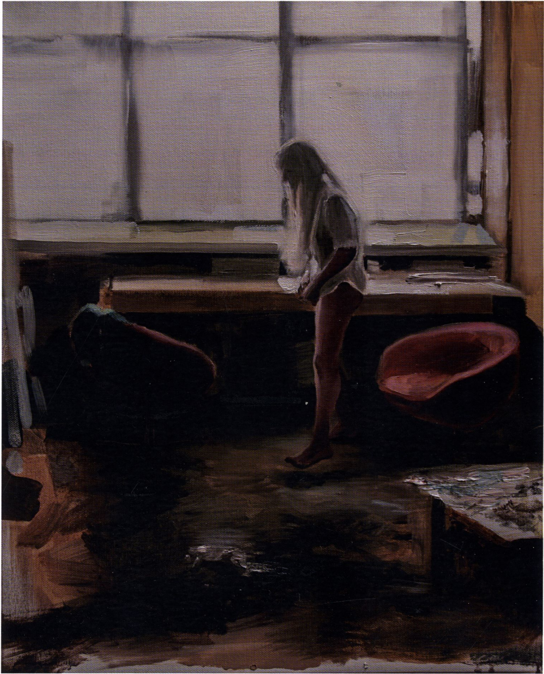
Pracownia / 50 x 40 cm / olej na płótnie / 2015 r.