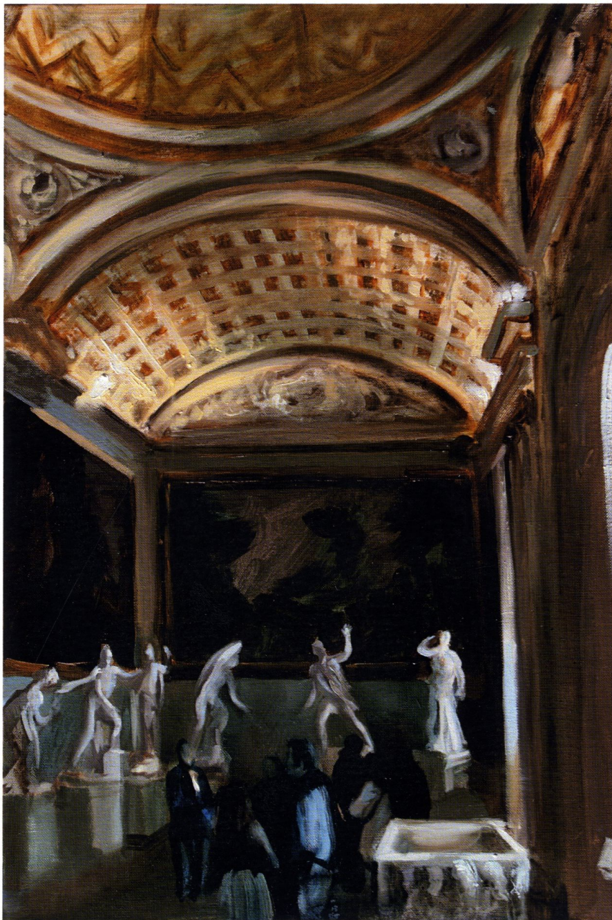
Muzeum I / 60 x 40 cm / olej na płótnie / 2016 r.