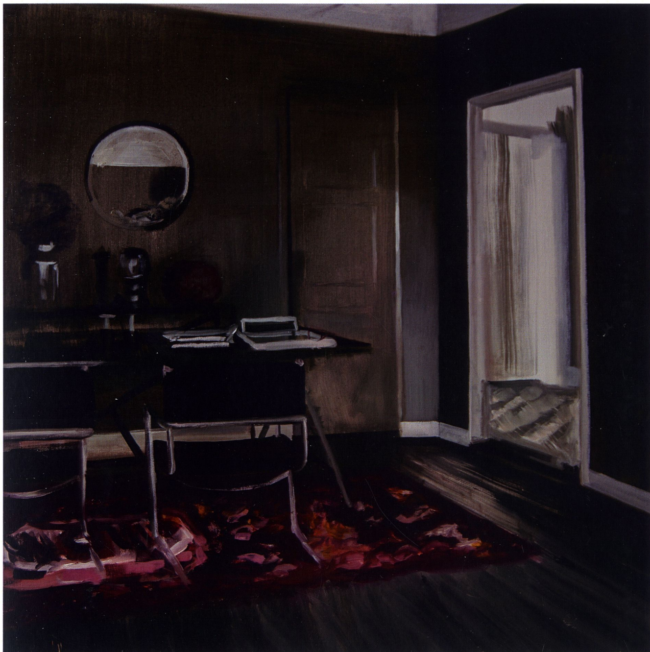
Drzwi których nie ma / 80 x 80 cm / olej na płótnie / 2015 r.