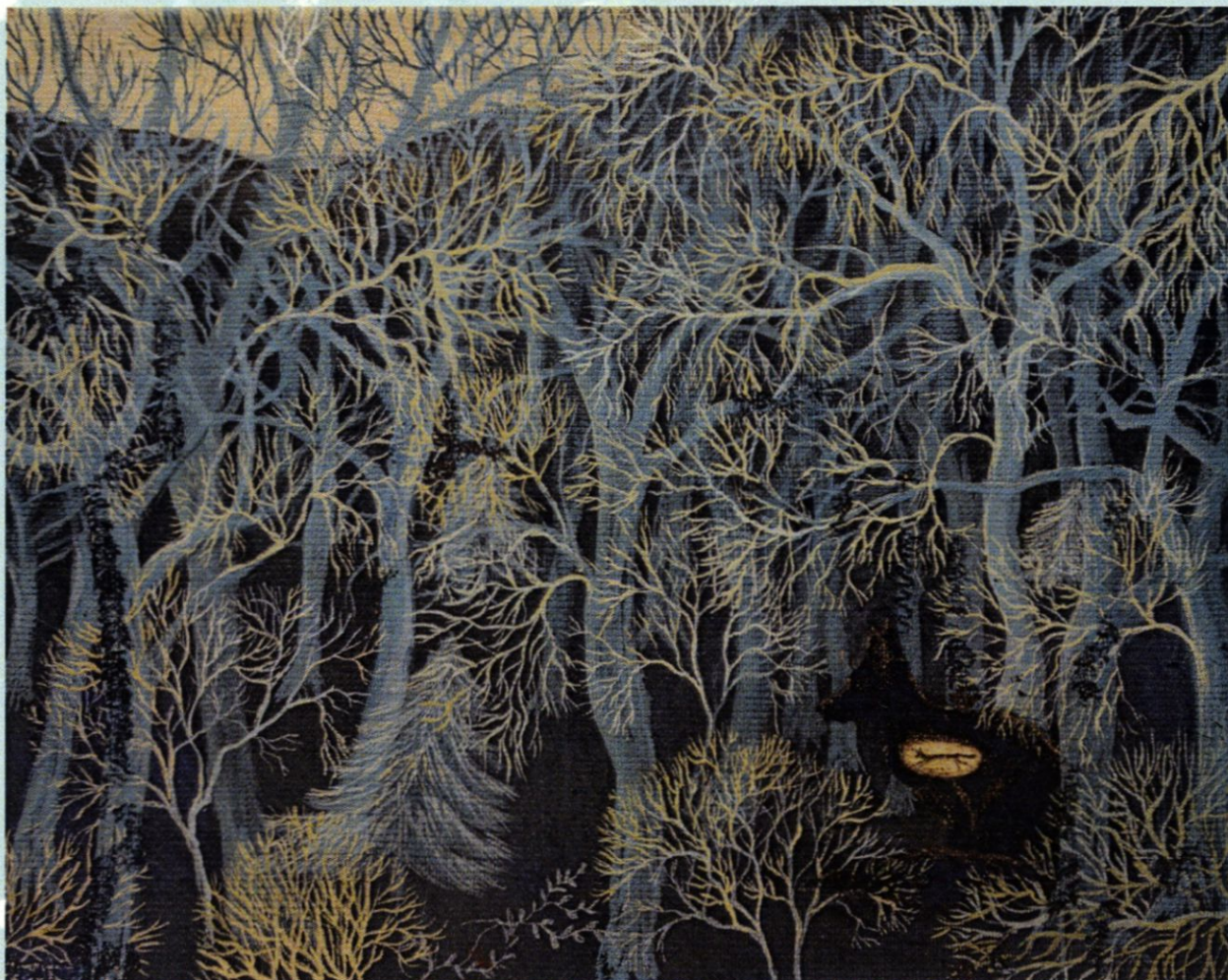
Zimowy sen , tempera jajeczna na płótnie, 2018

Interesują mnie relacje, które dotyczą podobieństwa, doszukuję się analogii, niewidzialnej łączącej siły. Poszukiwania te napędza niedosyt istnienia, rodzaj irracjonalnej tęsknoty. Twórczość w moim odczuciu jest nierozdzielnie powiązana z życiem samym w sobie. Rozumiem ją jako postawę wobec świata, jako pierwotny stan naturalny, podczas którego jesteśmy połączeni z esencją życia. Łaknienie i ciekawość wobec świata sprawiają, że mam potrzebę gruntownego wnikania w aspekty rzeczywistości, których doświadczam, szukam wciąż klucza, żeby nie ślizgać się po ich powierzchni. Twórczość daje mi poczucie jedności z życiem a przez to poczucie sensu. Jest dla mnie formą komunikacji, sposobem pogłębiania i pielęgnowania relacji ze światem i Innym, podsycaniem jej. Jest próbą przełamania osamotnienia.