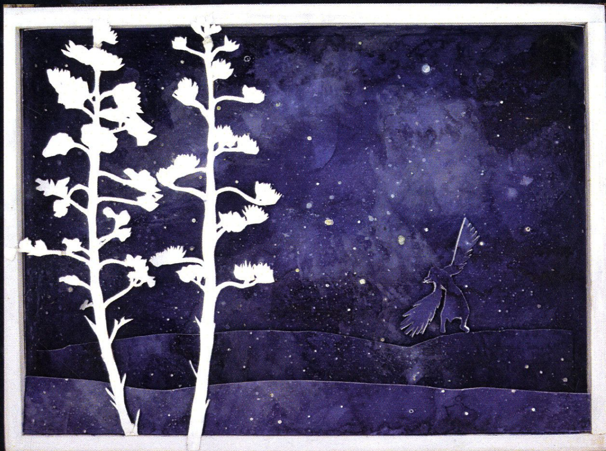
Lot Małgorzaty, gwasz, wycinanka z papieru, 2022