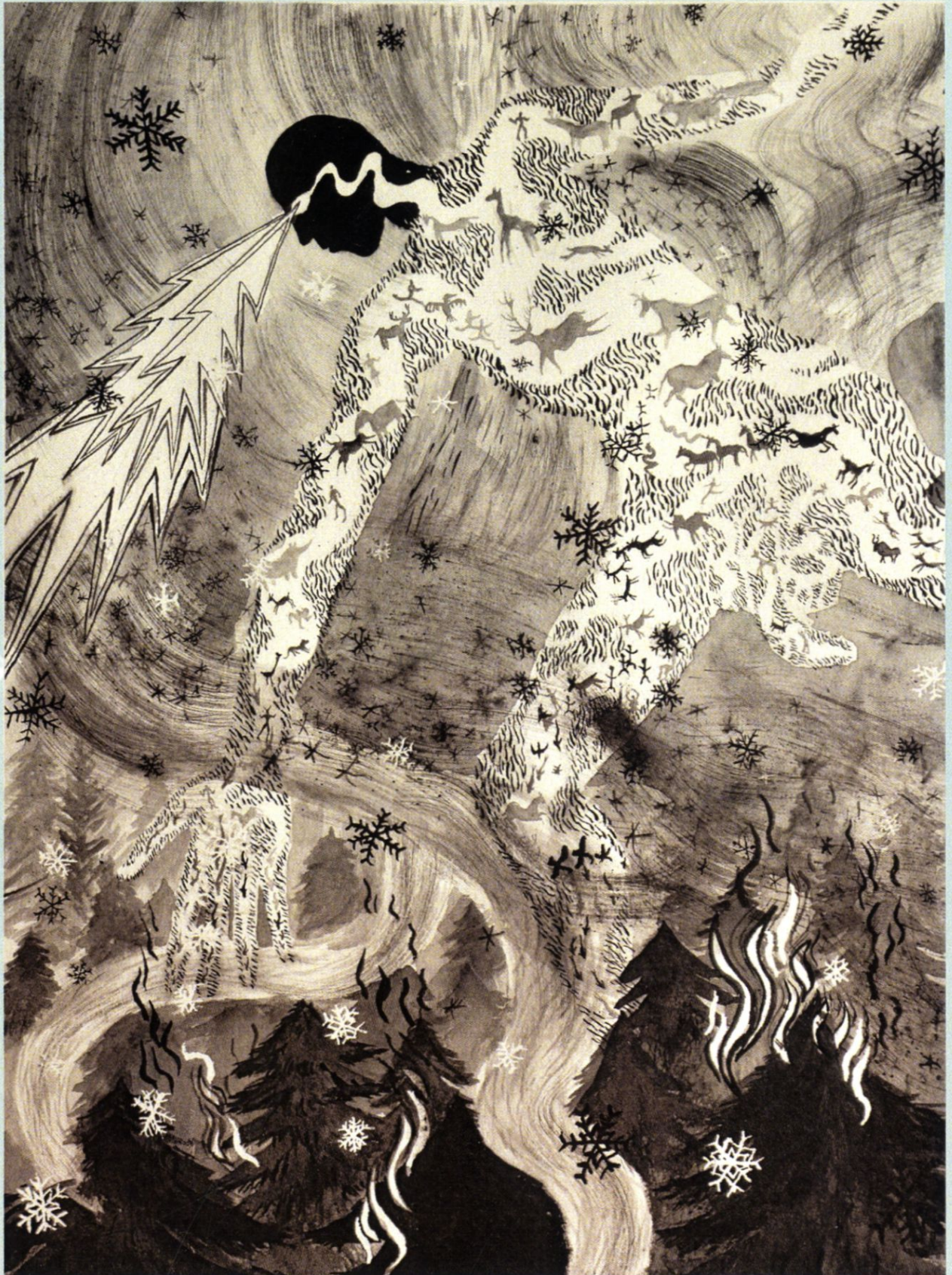
Lodowy Olbrzym tańczący nad pożogą, tusz na papierze, 2023