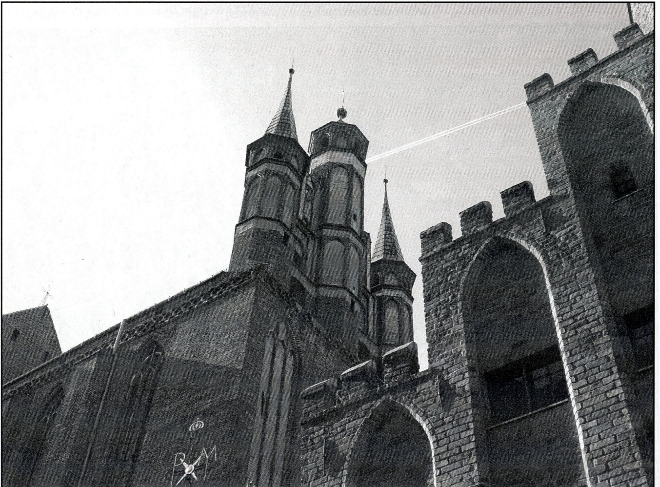
gotyckie wieże pofranciszkańskiego kościoła NMP