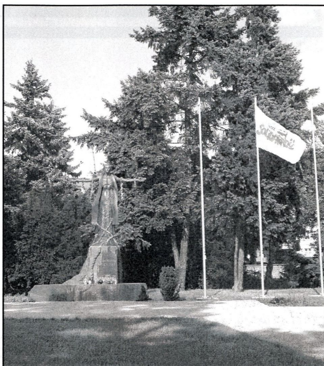
historia najnowsza - pomnik ks. Jerzego Popiełuszki, który zginął niedaleko Torunia