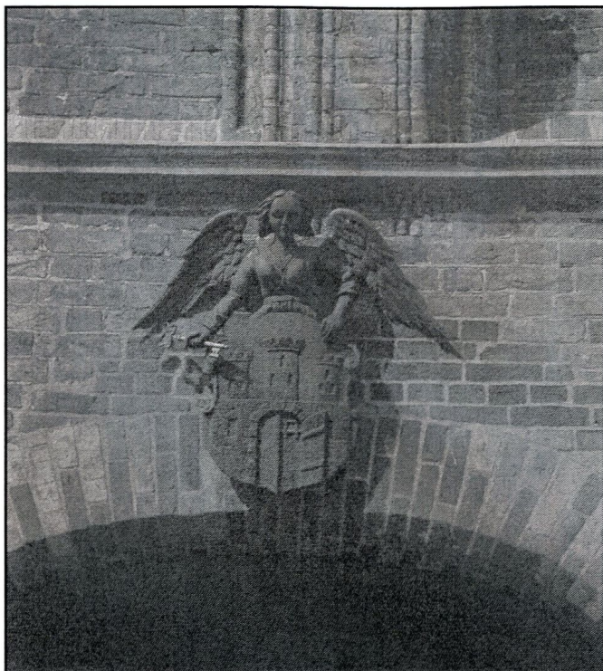
herb Torunia na ścianie Ratusza – anioł trzymający tarczę z widokiem murów miejskich