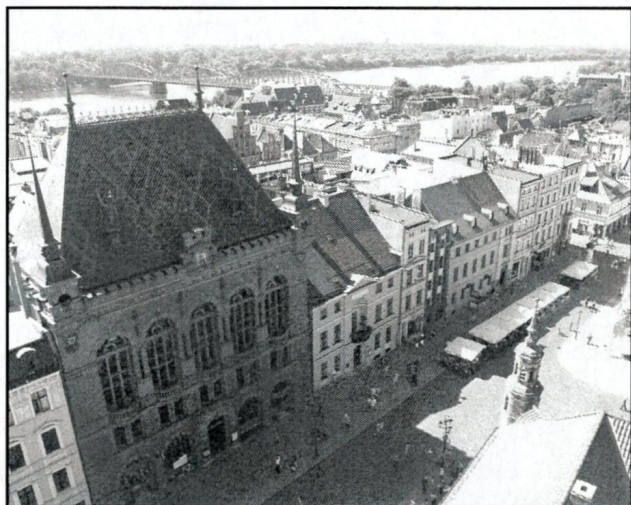
widok z wieży Ratusza na południową pierzeję rynku z XIX wiecznym Dworem Artusa, w tle wstęga Wisły