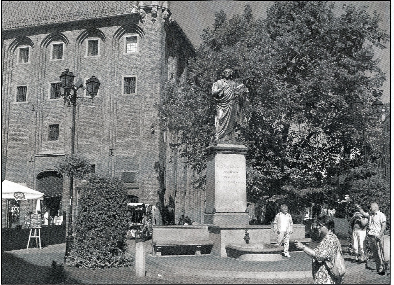
pomnik Mikołaja Kopernika na tle Ratusza