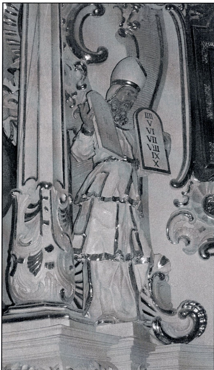
Mojżesz z tablicami Dekalogu, rzeźba barokowego ołtarza w kościele św. Janów w Toruniu

mocno po ziemi, który jednak nie potrafi poradzić sobie z samym sobą