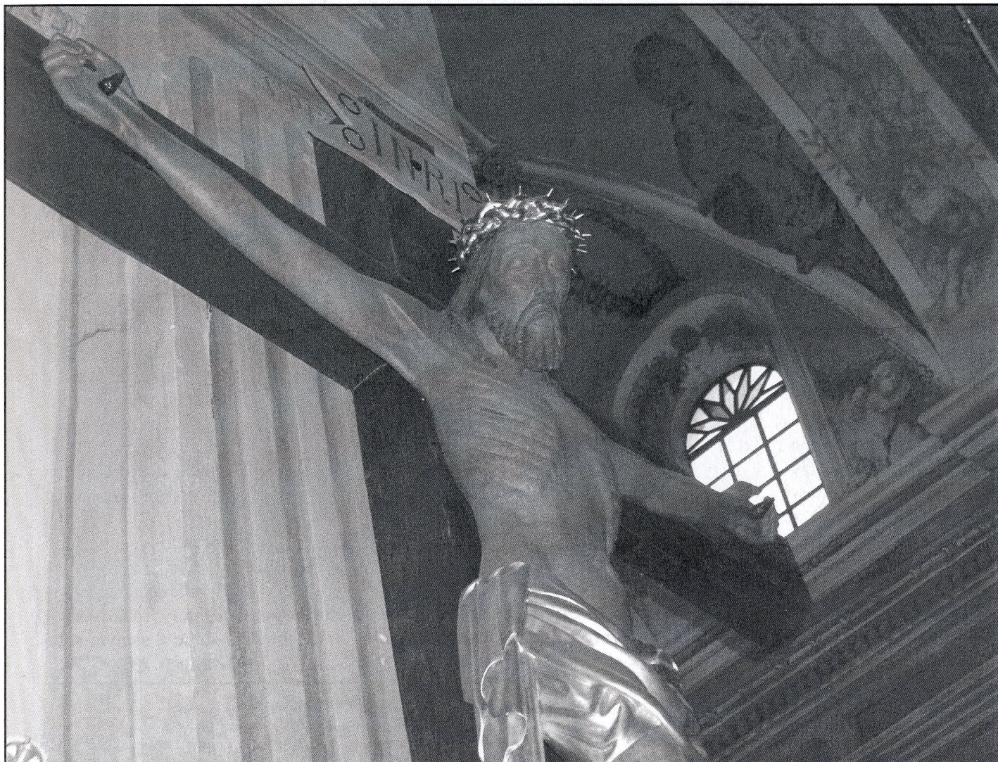
Gotycka figura Chrystusa w kolegiacie w Opatowie