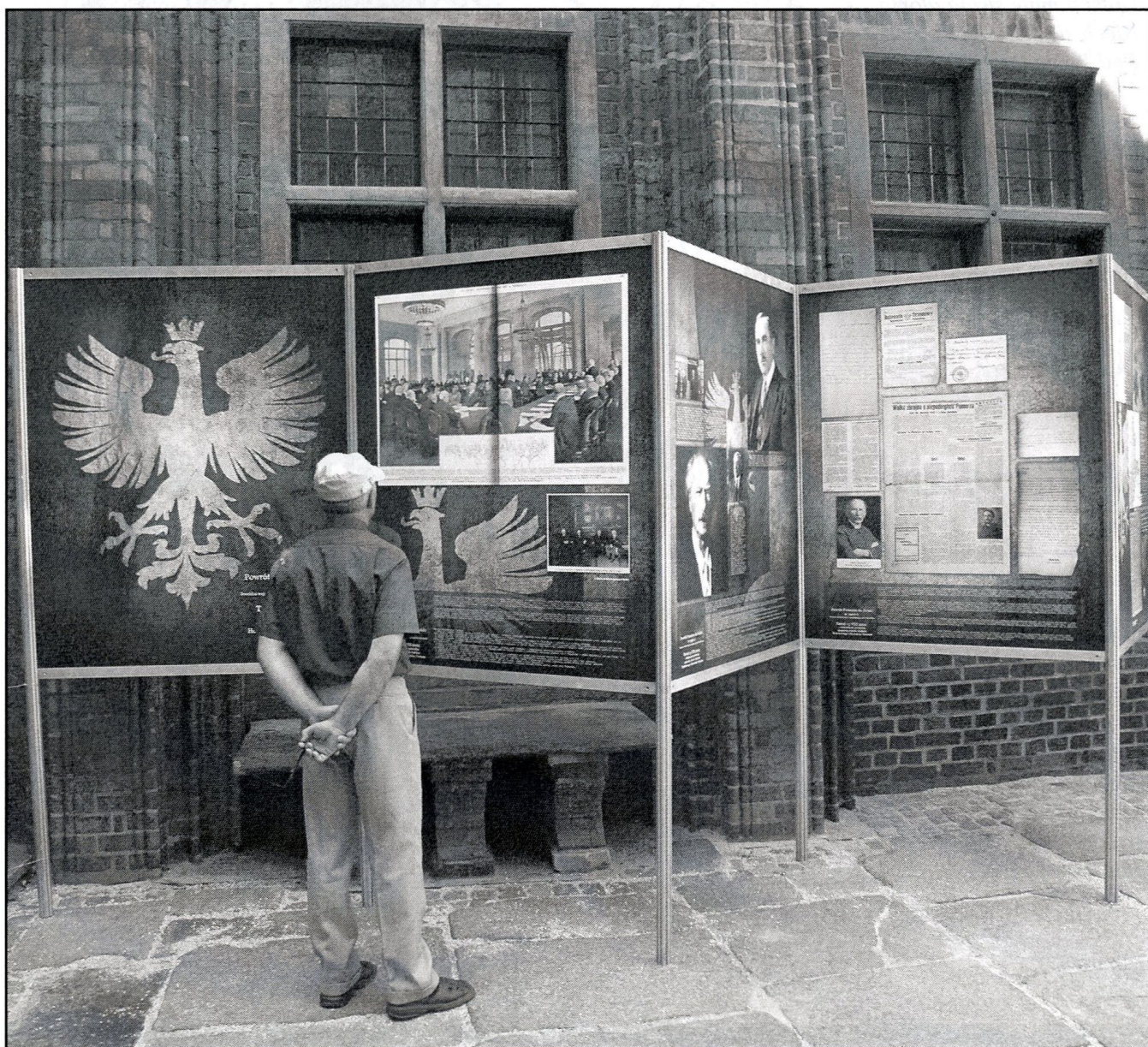
wystawa ukazująca przyłączenie Torunia do Rzeczypospolitej w 1920 roku