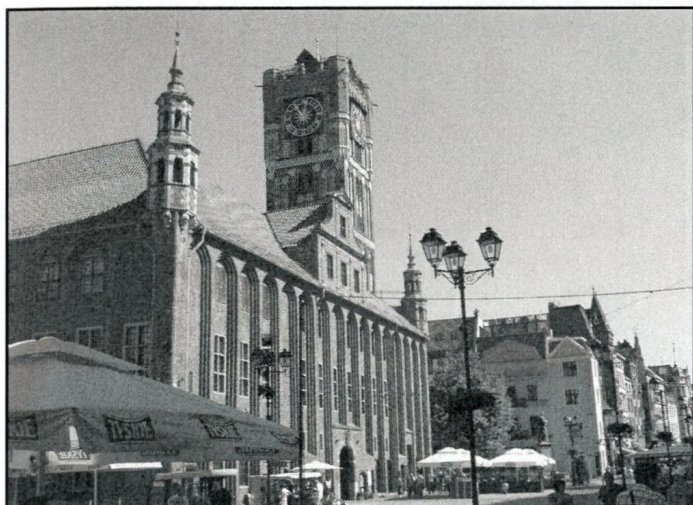
bryła Ratusza – miejsce śmierci króla Jana Olbrachta i słynnej „colloquium charitativum”