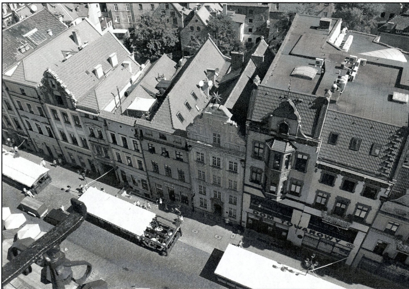
wschodnia pierzeja rynku z Kamienica pod Złotą Gwiazdą