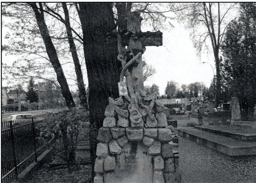
piękny motyw – krzyż z kotwicą nadziei