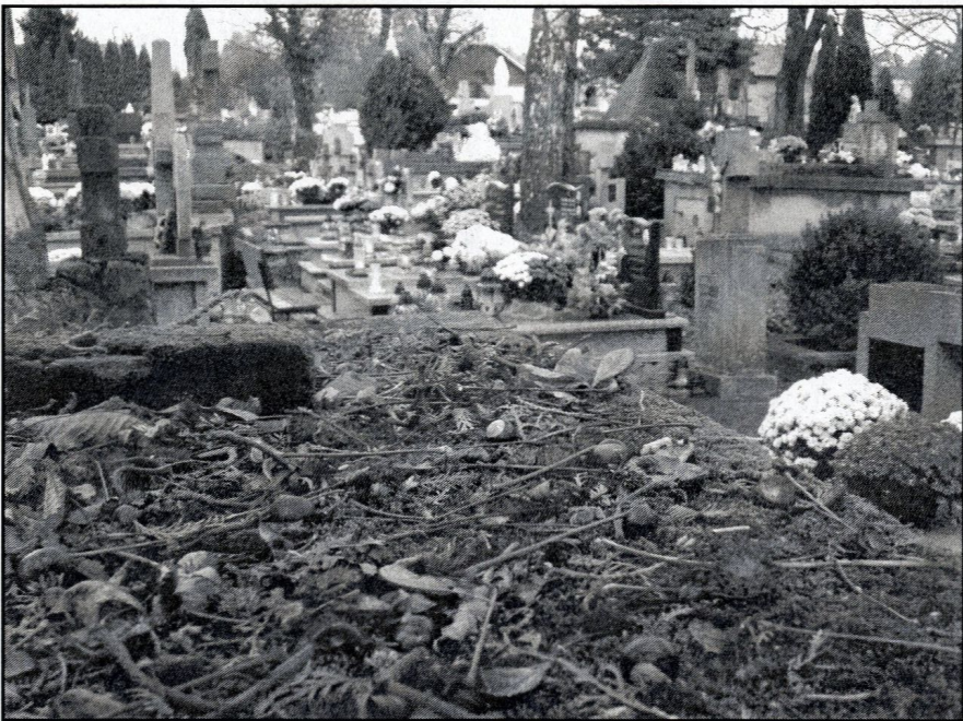
opadłe liście i kasztany na omszonym grobie – „sic transit gloria mundi”