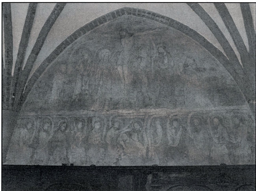
średniowieczny fresk „Ukrzyżowanie” w krużgankach