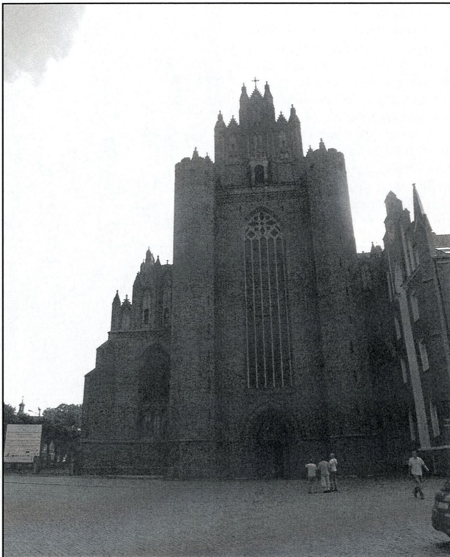
niewielki widok fasady katedry w Pelplinie