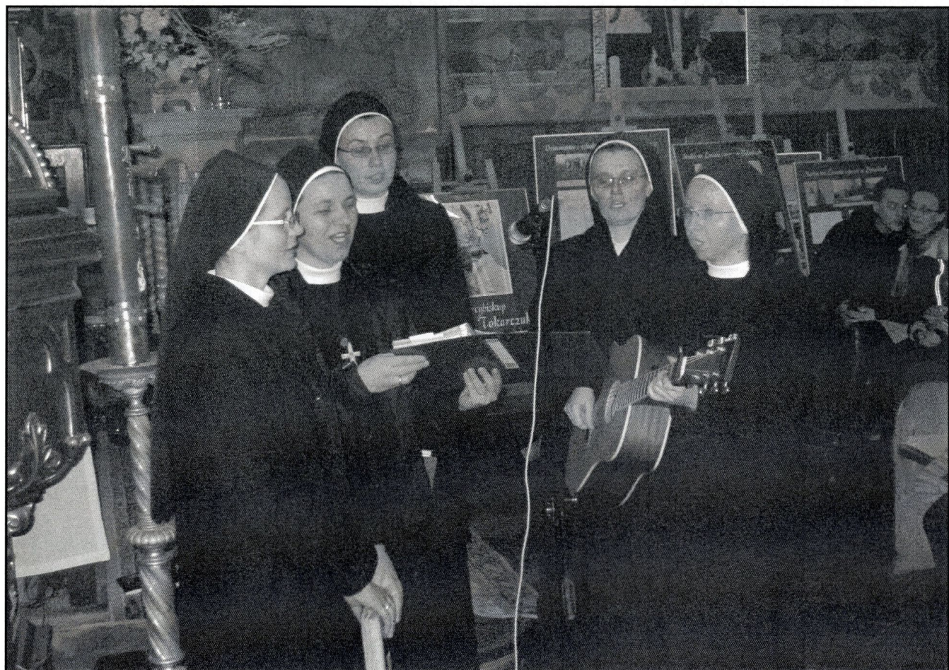
pieśni w wykonaniu chórkę sióstr