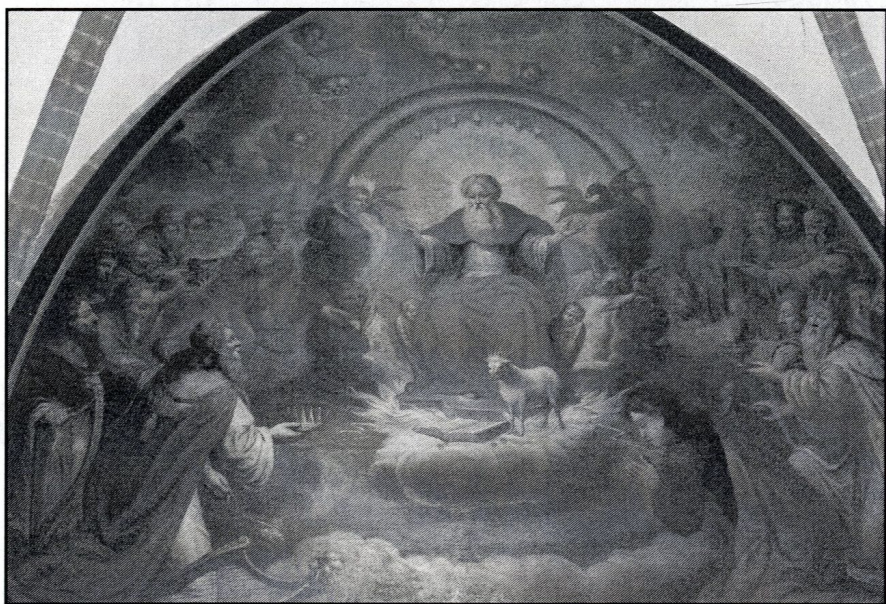
obraz „Baranek Apokaliptyczny” z warsztatu Andrzeja Stecha w krużgankach