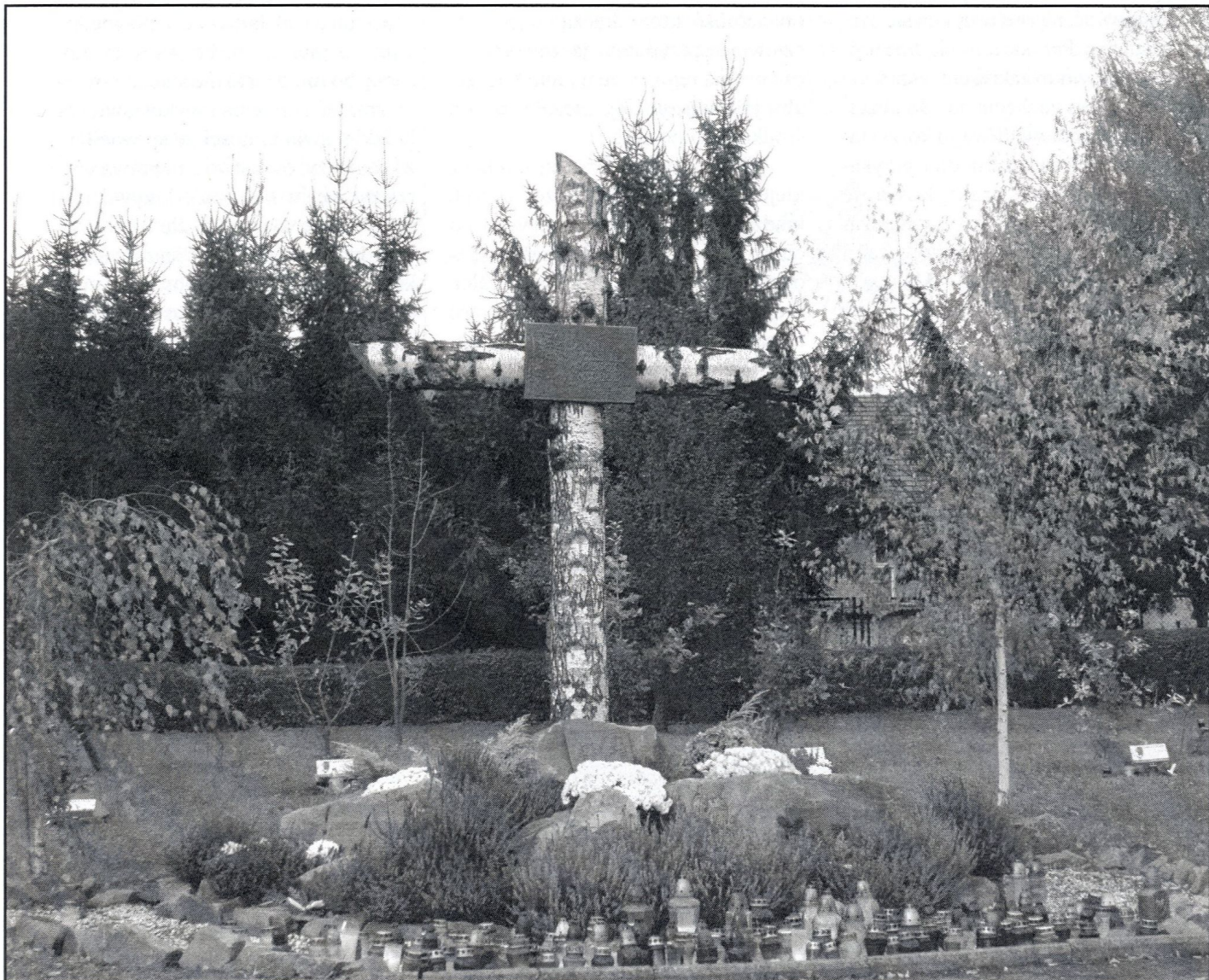
Krzyż katyński na Cmentarzu Miejskim w Sanoku