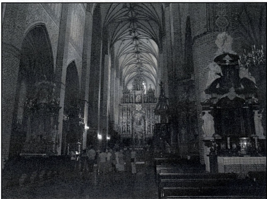
ciemne wnętrze kościoła rozjaśnia blask złoto ołtarza głównego