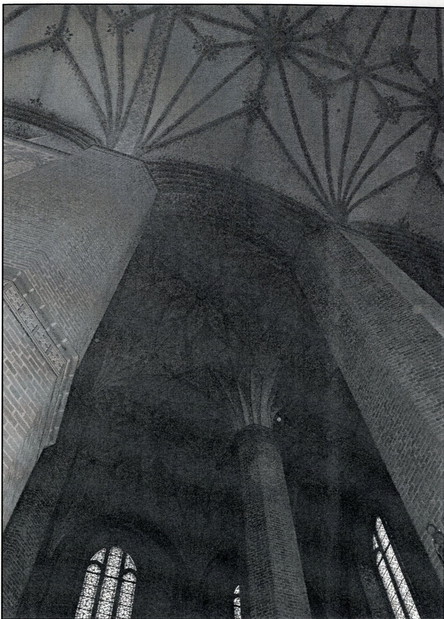
piękne kryształowe sklepienie nawy poprzecznej

Nie jest to jednak wszystko, co warto zobaczyć w katedrze pelplińskiej. Inne atrakcje kościoła to: kryształowe sklepienia transeptu, gotyckie malowidło św. Krzysztofa, 22 ołtarze boczne w nawach i przy filarach, w stylu manierystycznym i barokowym, ze