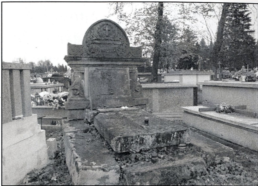
najpiękniejsza forma architektoniczna na Cmentarzu przy ul. Matejki z warsztatu Piątkiewicza – bardzo zniszczona