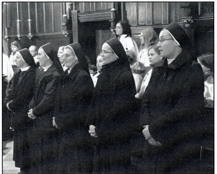
siostry obecne na mszy św.