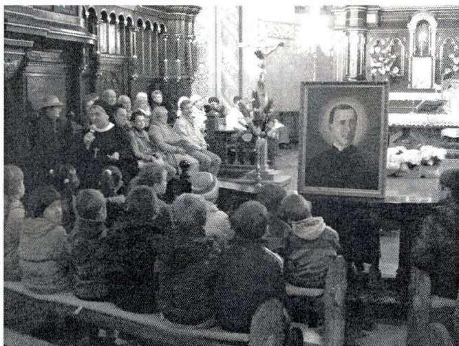
msza św. dla dzieci