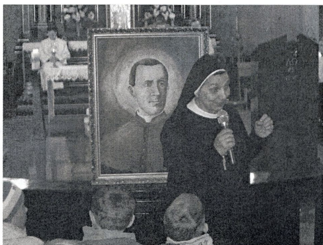
s. Dolores opowiada o św. Zygmuncie