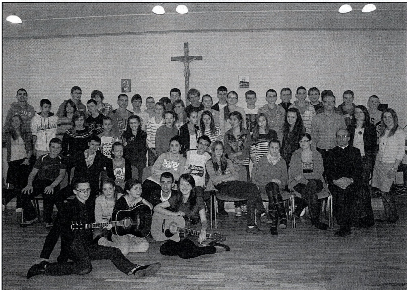
Grupa młodzieży na rekolekcjach przed bierzmowaniem w Rzepedzi, fot. archiwum parafii