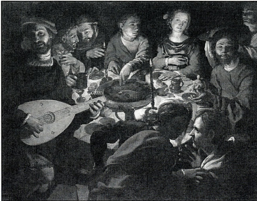
Jan Cornelisz Vermeyen, Wesele w Kanie, ok. 1530 r., Rijkmuseum, Amsterdam

Następne fragmenty Katechizmu omawiają w jaki sposób należy sprawować świętą liturgię. Przede wszystkim wskazują, że liturgii bardzo ważne miejsce zajmują znaki i symbole, słowa i czynności, śpiew i muzyka oraz święte obrazy. Do świętych znaków używanych w liturgii należą: składanie rąk, klękanie, skłony, obmycie, namaszczenie, łamanie chleba. Święte symbole, mające swoje miejsce lub odniesienie w liturgii to m. in. światło i ciemność, wiatr i ogień, woda i ziemia, drzewo i owoce. Bardzo ważne miejsce w liturgii zajmuje słowo Boże oraz oddawana mu cześć przez okazywanie szacunku świętej księdze, okadzenie, wniesienie w procesji, otoczenie światłem itd. Kolejnym skarbem liturgii jest śpiew i muzyka, której tradycje sięga początków chrześcijaństwa. Myślę, że warto zwrócić na to uwagę, ponieważ ostatnimi czasy śpiew w liturgii słab-