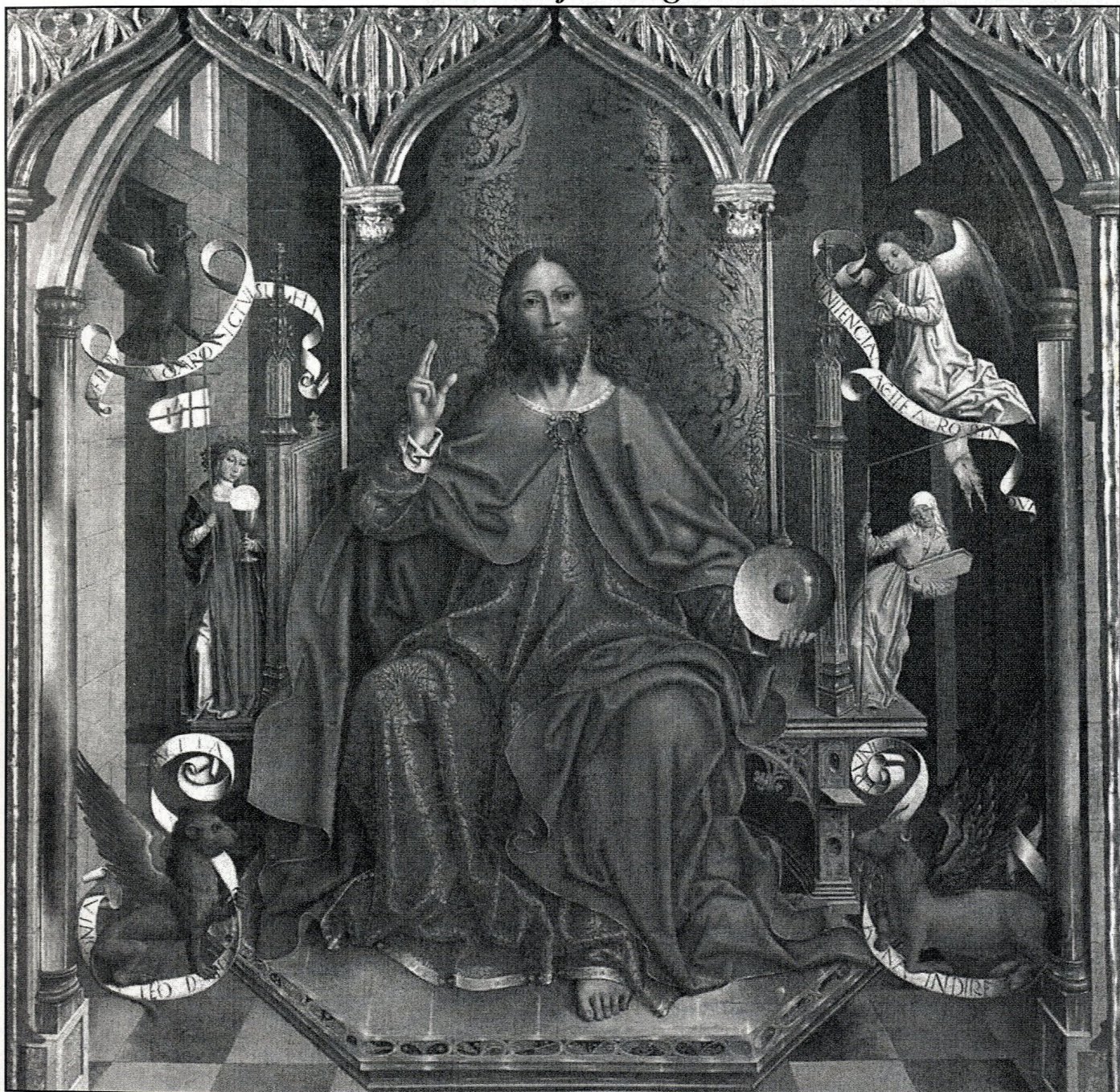
Fernando Gallego, Błogosławiący Chrystus, ok. 1492 r., Prado, Madryt