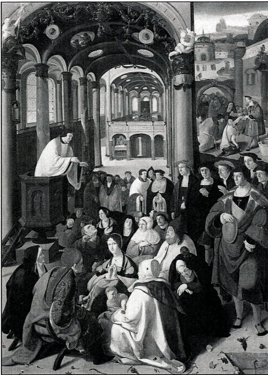
Aertgen van Leyden, Kazanie w kościele , ok. 1530 r., Rijksmuseum, Amsterdam

Z drugiej jednak strony są szczególne godziny i wyjątkowe miejsca, w których modlitwa i liturgia są sprawowane. Wyjątkowym miejscem