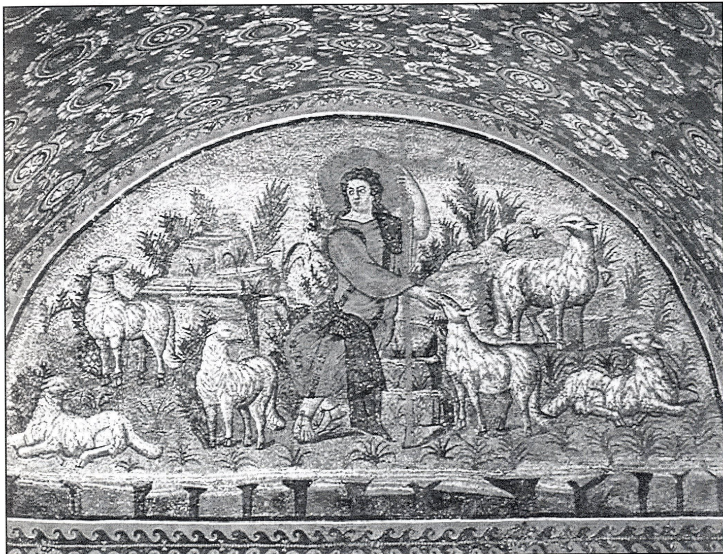
Autor nieznany, mozaika „Dobry Pasterz” w mauzoleum Galii Placydii w Rawennie, V w.