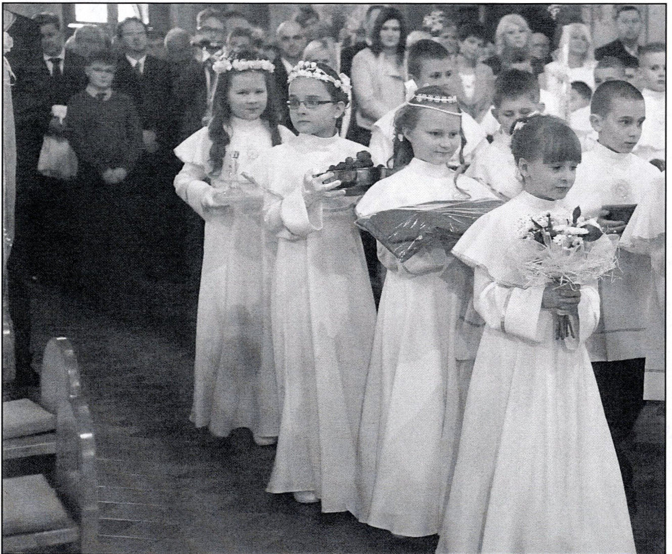
procesja z darami