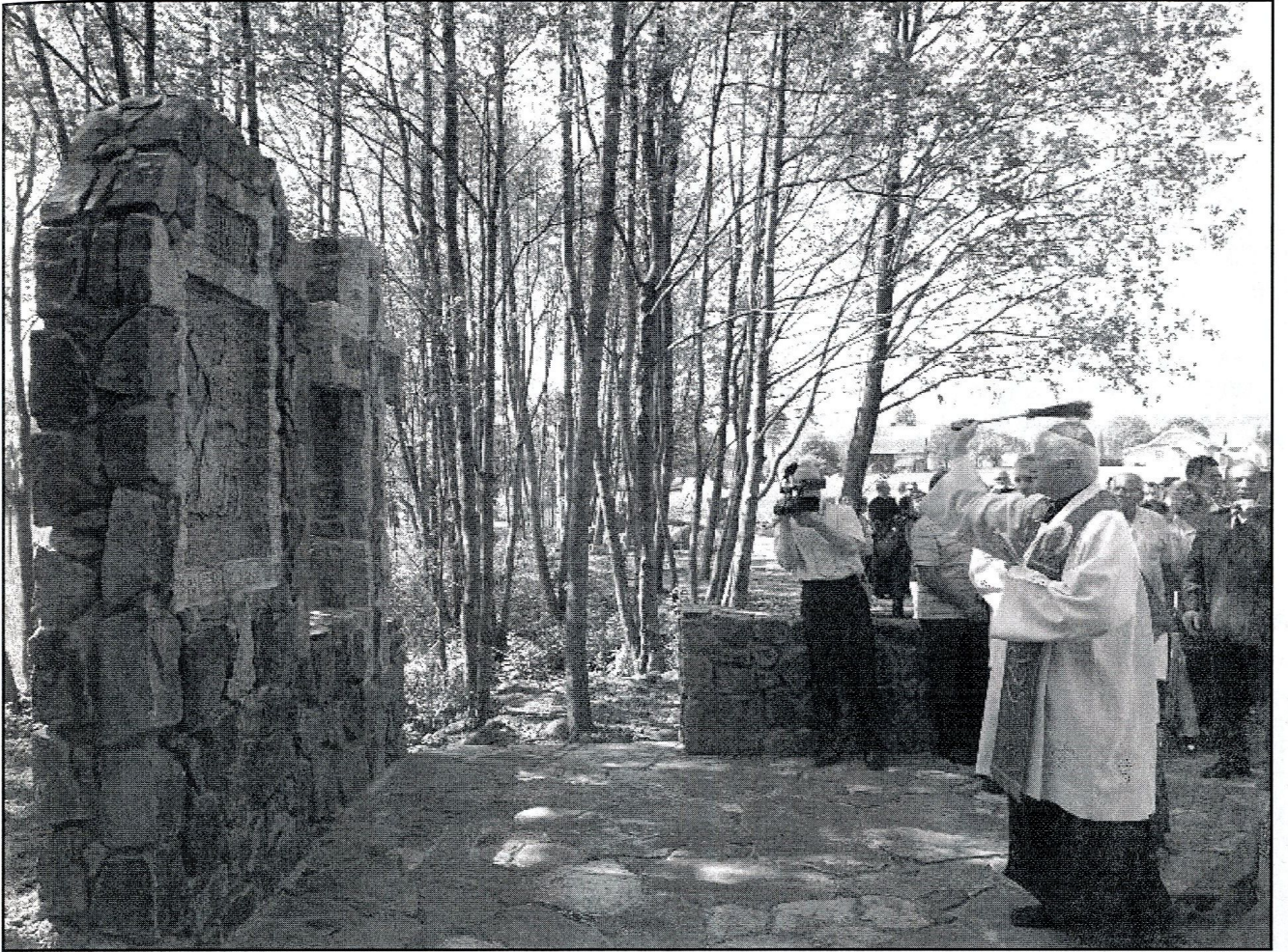
poświęcenie Drogi Krzyżowej