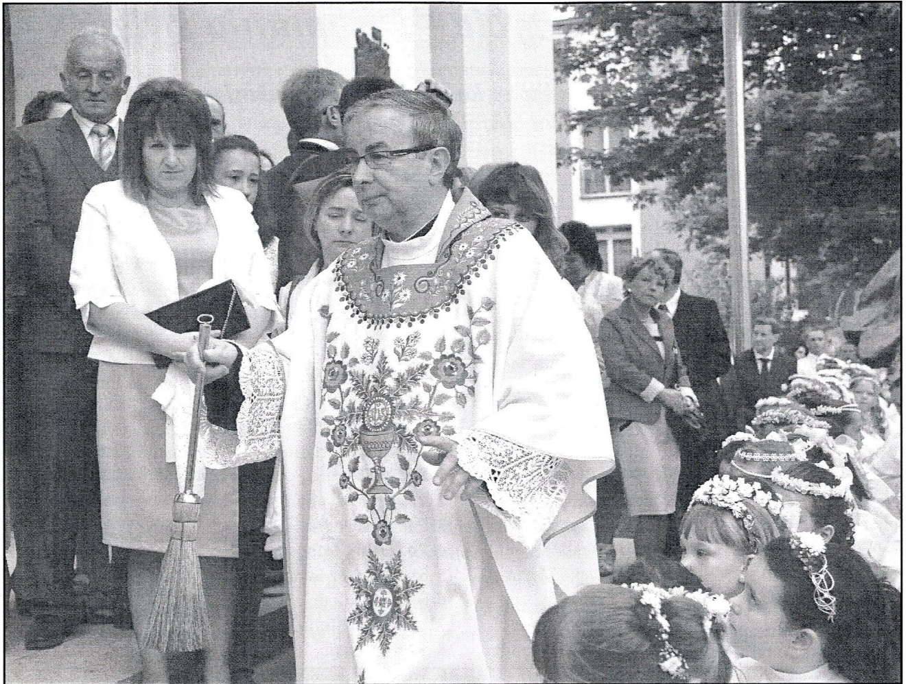
pokropienie dzieci na zewnątrz kościoła