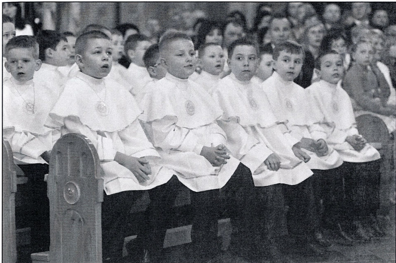
chłopcy na swoich miejscach