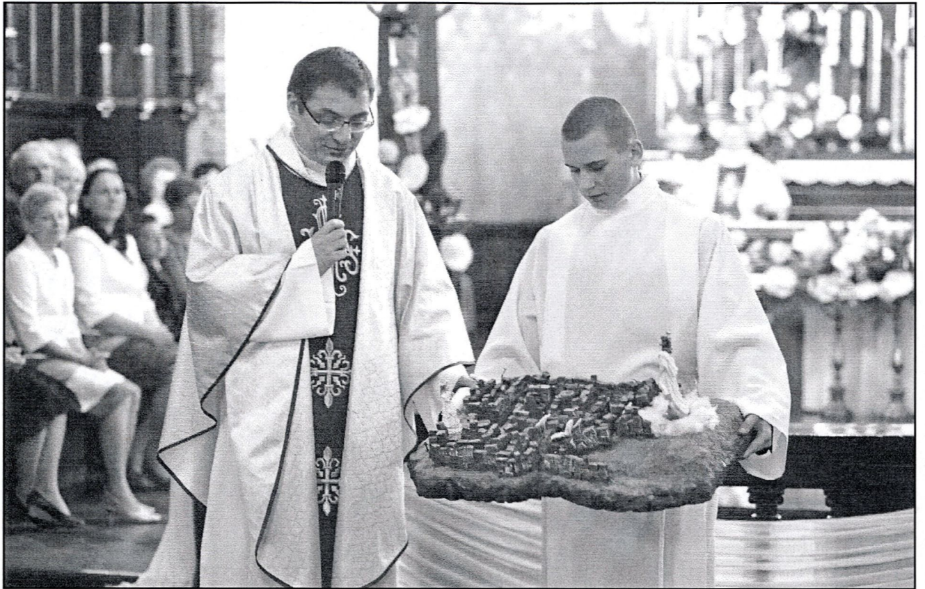
kazanie z makieta życia – labiryntu