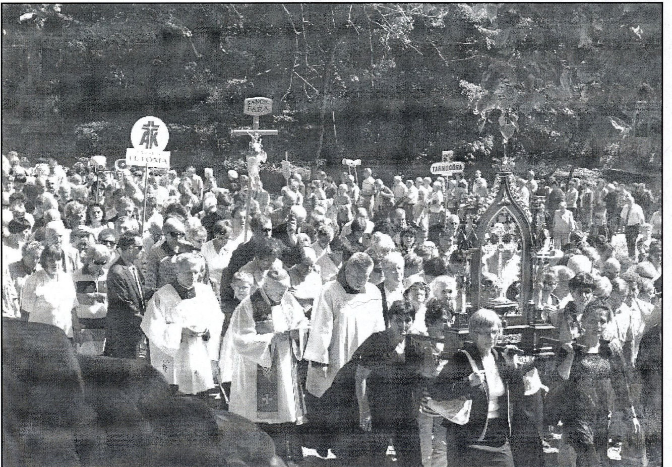
pielgrzymi, m. in. grupa z Sanoka