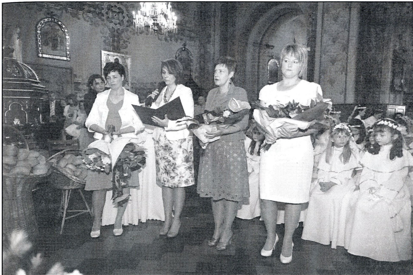
słowo wdzięczności od rodziców