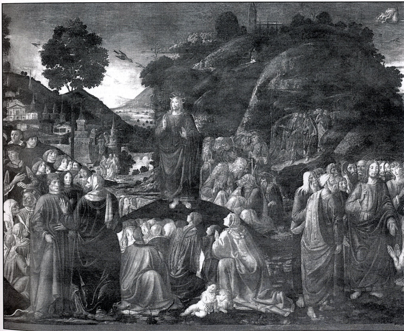
Cosimo Rosselli, Kazanie na Górze, fresk w Kaplicy Sykstyńskiej (fragment), 1481-82 r.