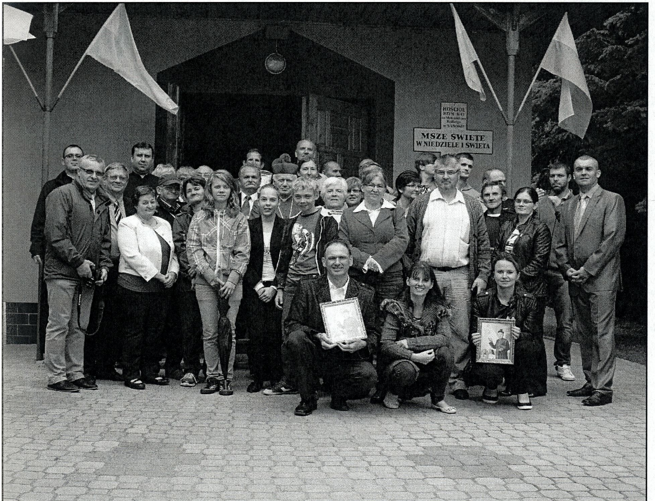
pamiątkowe zdjęcie grupy przed kościołem