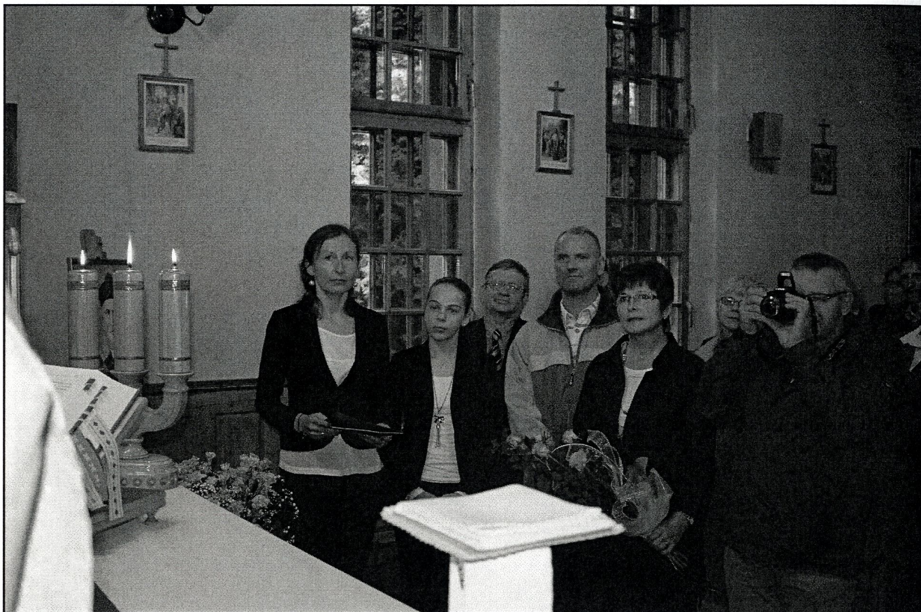
podziękowanie przez głuchoniemych