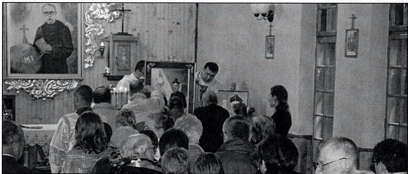
umieszczenie relikwii przy ołtarzu