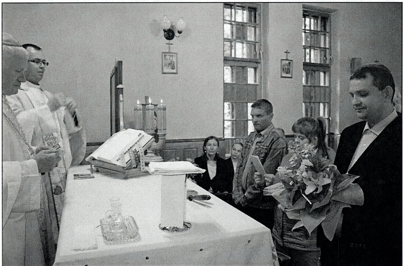
podziękowanie przez niepełnosprawnych