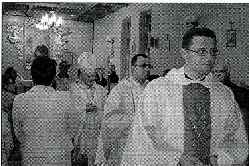
wyjście kapłanów po relikwii