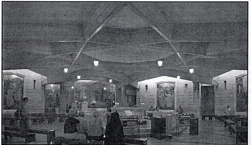
kościół dolny z relikwiami św. Jana Pawła II

Po zakończonych uroczystościach udaliśmy się jeszcze na chwilę