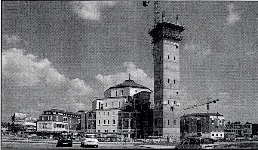
kompleks sanktuarium św. Jana Pawła II w budowie

na terenie dawnej fabryki Solvay, gdzie pracował w czasie wojny Karol Wojtyła. Byłem tu pierwszy raz w życiu i jestem zaskoczony wielkością i pomysłowością przedsięwzięcia. Znajduje się tu kościół św. Jana Pawła II (kościół górny), na planie ośmiokąta, z przepięknymi mozaikami projektu o. Marco Rupnika z Chorwacji. Tenże artysta dekorował też mozaikami nowy kościół św. O. Pio w San Giovanni Rondondo, który miałem możliwość podziwiać w ubiegłym roku. Mozaiki w Krakowie są piękne, tajemnicze i wymowne, ale nie czas dzisiaj na ich opisywanie. Niestety nie mogłem zrobić zdjęcia, albowiem wyczerpała mi się już bateria w aparacie, który użytkowałem na moją prośbę też jeden z pielgrzymów i nieco zagalopował się w liczbie zdjęć na Jasnej Górze. W relacji posiłkuję się więc zdjęciami