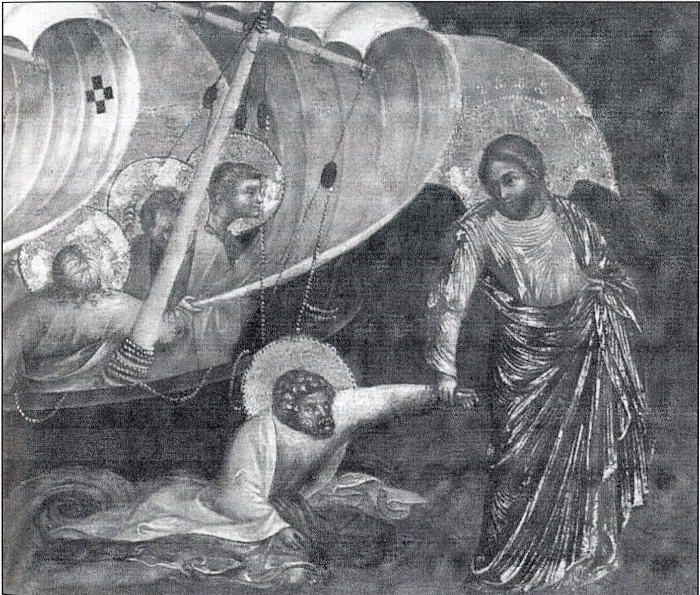
Lorenzo Veneziano, Chrystus ratuje Piotra przed utonięciem (fragment obrazu), ok. 1370 r., Staatliche Museen, Berlin