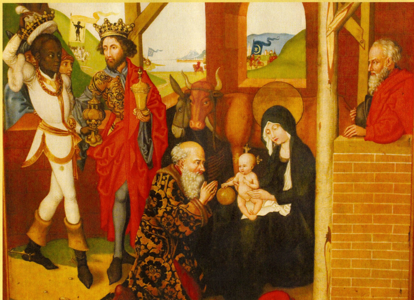
Martin Schongauer, Pokłon Mędrców, fragment ołtarza Dominikańskiego z Colmar w Alzacji, II poł. XV wieku.