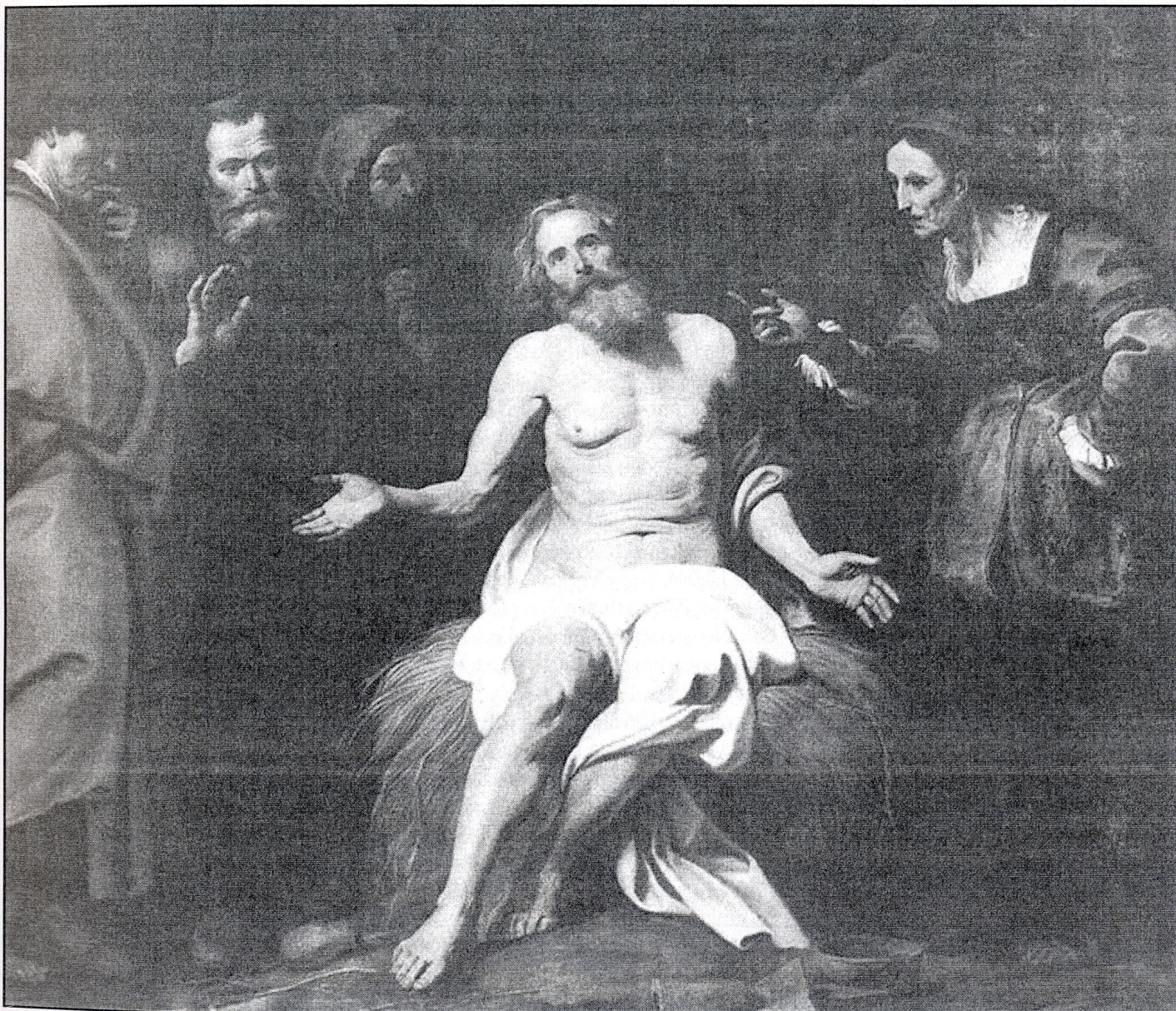
Gerard Seghers, Cierpiący Hiob , ok. 1620 r., Galeria Narodowa w Pradze