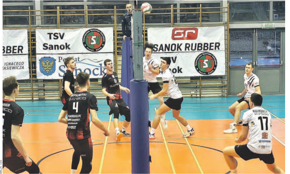
W finale zawodnicy TSV (w jasnych strojach) musieli uznać wyższość ekipy z Rzeszowa