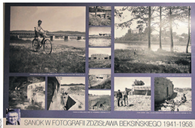
SANOK W FOTOGRAFII ZDZISŁAWA BEKSIŃSKIEGO 1941-1958

Artysta stworzył m.in. cykl ukazujący miasto pod okupacją niemiecką, który posiada unikatową wartość historyczną. Należy tutaj dodać, że Polacy wówczas mogli posiadać aparaty fotograficzne wyłącznie do prywatnego użytku i wszelkie próby rejestracji przestrzeni publicznej,