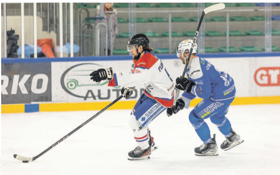
Pościg za krążkiem