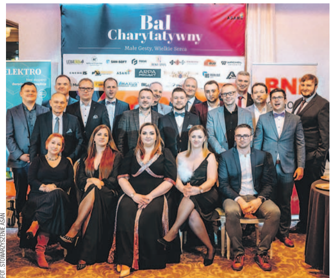
Uczestnicy Balu Charytatywnego

W Centrum Bankietowym „Royal Palace” odbył się Bal Charytatywny, zorganizowany przez grupę BNI Sanok na rzecz Stowarzyszenia ASAN. Impreza przyciągnęła liczne grono gości, a jej głównym celem było wsparcie – poprzez aukcje – lokalnej terapii autyzmu.