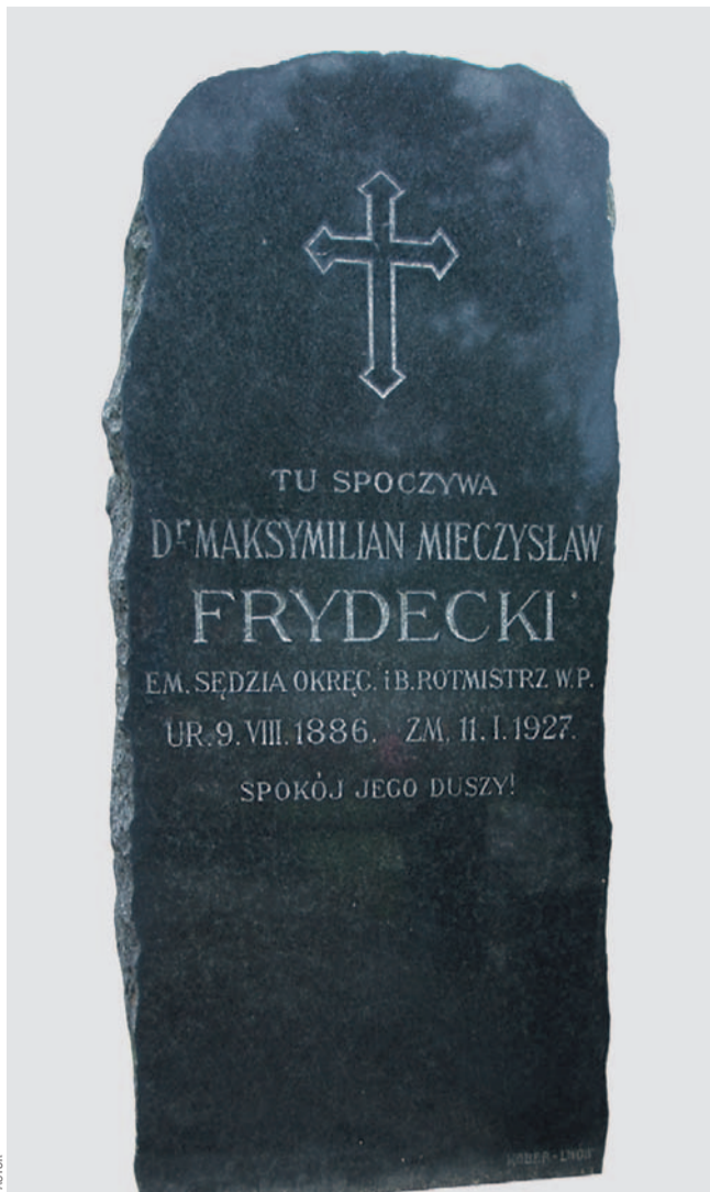
Płyta nagrobna Maksymiliana Frydeckiego

Po tym, jak znów zachorował, urlopowano go i wyznaczono kadrowym pułku strzelców w Przemyślu. Finalnie od 1 czerwca do 1 listopada 1918 r. był w kadrze komendy miasta Lwowa, a tam skierowany do służby policyjnej. Z dniem 1 listopada 1914 r. został awansowany na porucznika, a 1 lutego 1917 r. na nadporucznika w stosunku „poza służbą”.