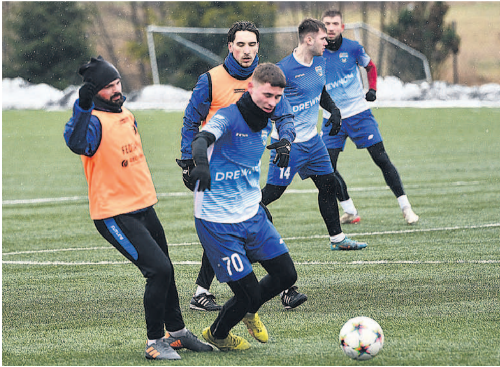
Styczniowa pora nie przeszkodziła rywalizacji sparingowej

Cykl meczów kontrolnych drużyny seniorskiej rozpoczęto pod koniec stycznia. Przeciwnikiem był IV-ligowy rywal, a pojedynek rozegrano na sztucznej murawie w Pakoszówce, gdzie wkrótce odbędą się dwa kolejne spotkania.