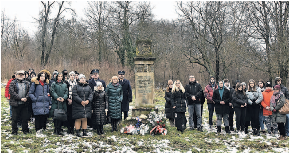
Uczestnicy upamiętnienia na cmentarzu żydowskim

Kilkudniowe uroczystości zakończyły się w ubiegły piątek, a ich finałem było upamiętnienie na cmentarzu żydowskim przy ul. Głogowej. Termin wydarzenia wybrano z uwagi na przypadającą następnego dnia rocznicę wyzwolenia niemieckiego obozu koncentracyjnego Auschwitz-Birkenau, co miało miejsce 27 stycznia 1945 r.