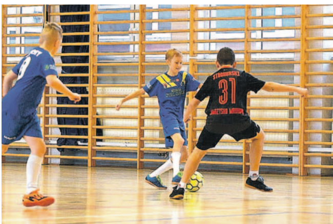
Zmagania turniejowe w sali ILO

W ILO rozegrano turnieje gromadzące łącznie 16 drużyn młodzieżowych z regionu. Dwudniowa impreza przyniosła multum spotkań i wartościowe pojedynki.