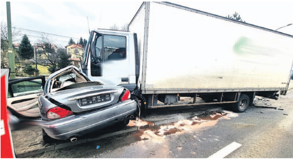
Pojazdy Jaguar i Iveco po wypadku

Skutkiem tego drugie z tych aut znalazło się na przeciwnym pasie ruchu, po czym zostało uderzone przez nadjeżdżające z naprzeciwka dostawcze Iveco.